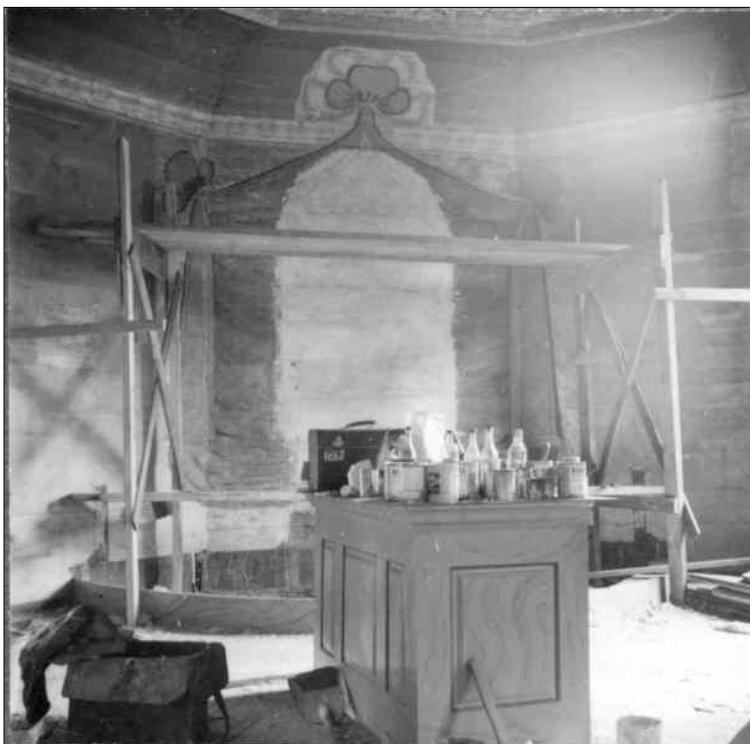
Vy mot öster och koret under pågående restaurering. Altarfönstret är igensatt och det gamla dekorationsmåleriet är framtaget. Bilden är sannolikt tagen 1953 vid den stora restaureringen som skedde då. (ATA)

Under 1960-talet gjordes underhållsarbeten, främst exteriöra, där fönster och dörrar ommålades. Kyrkan rödfärgades och taket tjärades vid flera tillfällen. År 1974 ersattes den dansktillverkade orgeln med en ny då den danska inte fungerade tillfredställande. Den nya orgeln tillverkades av orgelbyggare Nils Hammarberg i Göteborg. Orgeln laserades i grått med krönlist i rött, utformningen är modernt stram. Den gamla orgeln såldes till nöjesparken High Chaparral. År 1992 upprättades ett restaureringsprogram för kyrkans blyinfattade fönster. Programmet upprättades av Glaskonst Winfried Baier i Tranås. Det är