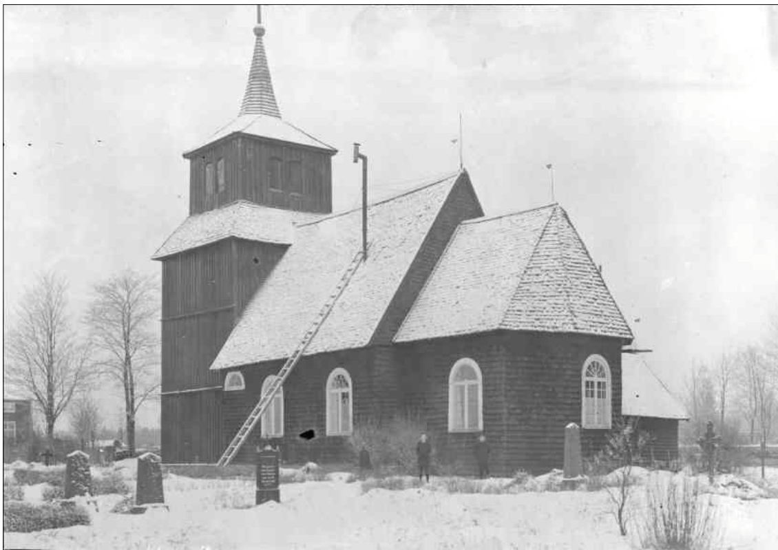
Exteriörbild från 1916. På bilden syns skorstenen från kaminerna som fungerade som kyrkans uppvärmning. I koret finns fortfarande altarfönstret kvar. Foto Erik Fant 1916. (ATA)

En första träkyrka uppfördes sannolikt här under 1200-talet, från den kyrkan återfinns idag kyrkans dopfunt och triumfkrucifix. Den kyrkan ersattes vid okänt tillfälle med en ny träkyrka där möjligtvis den nuvarande sakristian ingått. 1689 införskaffades en predikstol till kyrkan och 1704 uppfördes en klockstapel i kyrkans närhet.