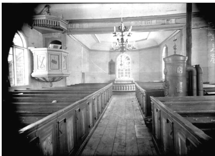
Vy mot öster i början av 1900-talet. På bilden är kyrkorummet vitmålat och hållen i en mer nyklassicistisk prägel. Predikstolen från 1852 som numera finns bevarad i församlingshemmet är här kvar. Foto Erik Fant 1916. (ATA)

År 1850 utfördes reparations och ombyggnadsarbeten på kyrkan där en