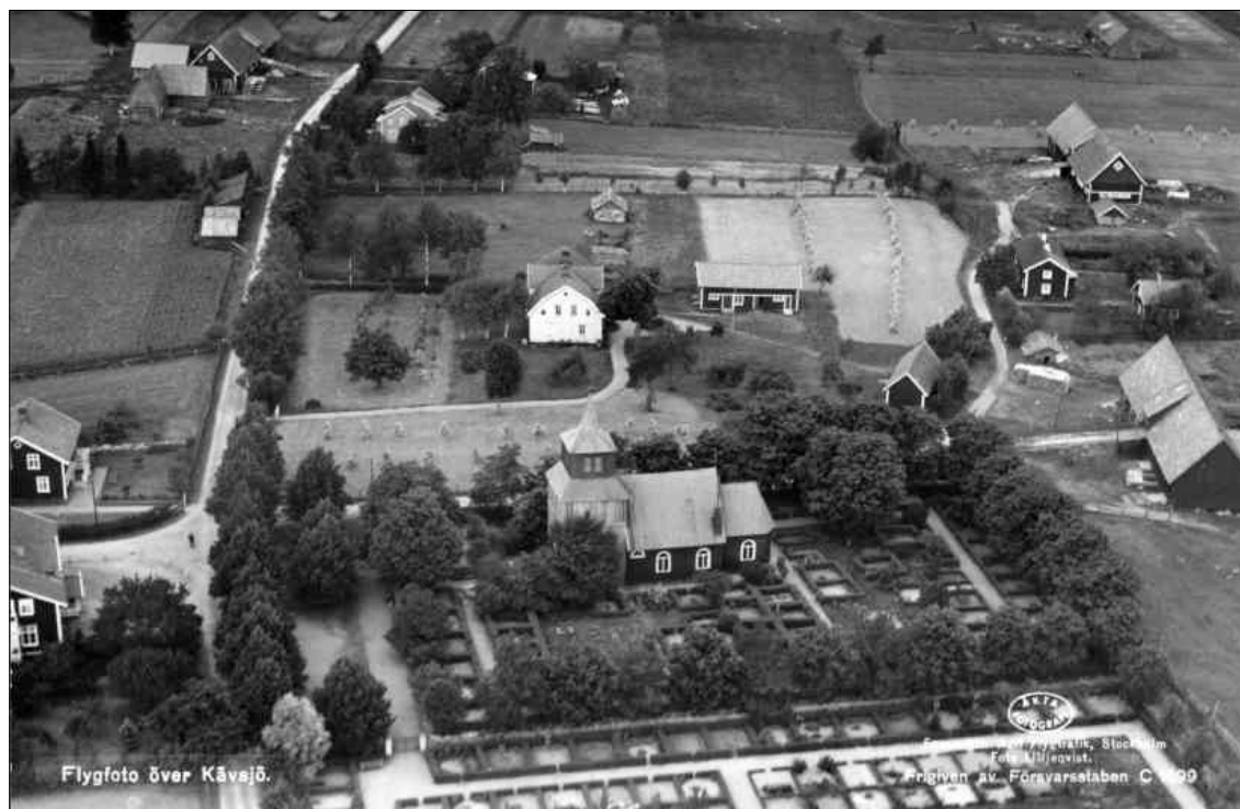
Flygfoto över Kävsjö. mitten av 1900-talet.

Kyrkan och kyrkogården omgärdas av en stenmur, kyrkogården har utvidgats under mitten av 1900-talet. Strax norr om kyrkan ligger prästgården från 1853 och mitt emot kyrkobyggnaden ligger den gamla kyrkskolan från 1891. De angränsande markområdena är i pastoratets ägo vilket medfört att någon bebyggelse inte vuxit upp i kyrkans absoluta närområde. Fornfynd i området tyder på att platsen sannolikt varit bebodd under bronsåldern. Invid Kävsjö är Store Mosse beläget vilket är nationalpark och riksintresseområde. Den omgivande bebyggelsen har vuxit fram främst under andra halvan av 1800-talet och landskapet består i övrigt av ett öppet jordbrukslandskap. Sammantaget utgör kyrkobyggnaden med prästgården och den f.d. skolan ett gott exempel på ett mindre sockencentrum.