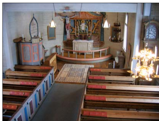
Vy över kyrkorummet. Predikstol och altare med altarskåp utgör några de senare tidskikten i kyrkan. Bänkinredningen bidrar till kyrkans intima karaktär.