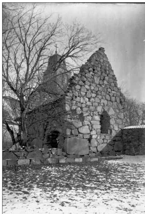
Bondkyrkans västra parti. Fotograferad vid ett okänt tillfälle, troligen före 1920-talet.