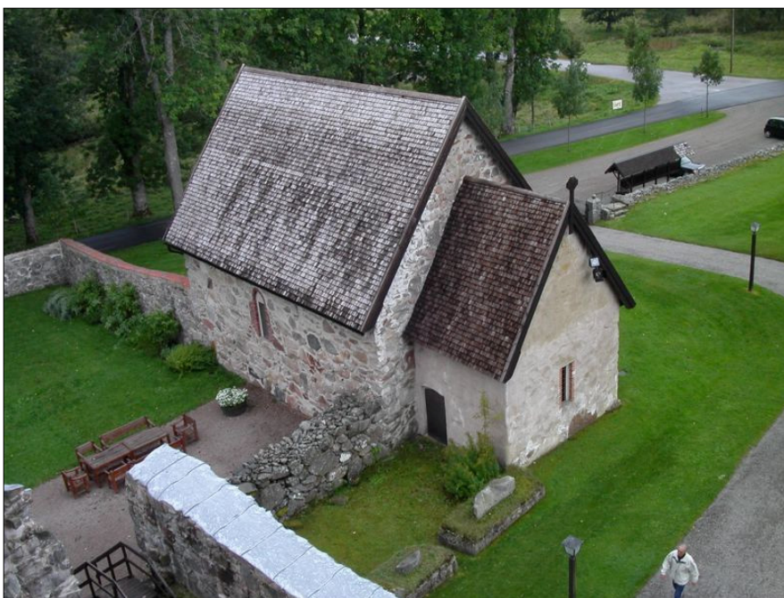
Bondkyrkan sedd från klosterkyrkans torn. Resterna av 1630-talets tillbyggnad mellan om bondkyrkans kor och klosterkyrkan syns tydligt, likaså korets putsade och återskapade murar.

Nydala bondkyrka – även kallat portkapellet – är en del av den medeltida klosteranläggningen i Nydala. Klostret uppfördes 1143 – 1266 av cisterciensermunkar från Clairvaux och är tillsammans med Alvastra Sveriges första cistercienserkloster. Det ödelades i samband med att ägorna drogs in vid reformationen och kort därefter dessutom brändes av danskarna 1568. Delar av klosterkyrkan iordningställdes igen 1688 och har sedan dess fungerat som sockenkyrka. Bondkyrkans historia är till stora delar utforskad men uppfördes troligen i samband med den övriga klosteranläggningen 1143-1266. Bondkyrkan användes under 1600-talet som ett mindre gudstjänstrum, men efter klosterkyrkans iordningställande 1688 övergavs och förföll den uppenbarligen. Vid mitten av 1900-talet återstod endast gavlarna och långsidorna, taket var helt borta och största delen av koret var också nedrivet. Bondkyrkan återuppfördes 1952 till i stort sett det skick den är i idag; ett begränsat kyrkorum av salkaraktär, rakslutet kor i öster, gråstensmurad stomme, ett brant sadeltak täckt med spån. Golvet lades med rött tegel och altare, bänkinredning och predikstol nytillverkades. Bondkyrkan är idag det enda bevarade portkapellet i Sverige, och utgör tillsammans med klosterkyrkan en viktig del i upplevelsen av klosteranläggningen.