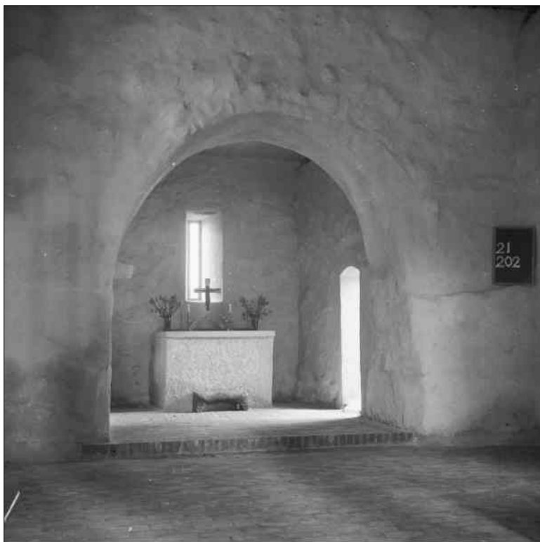
Bonkyrkan efter färdigställandet 1952. Förutom altaret bestod möbleringen fram till 1964 av rygglösa bänkar utmed väggarna.