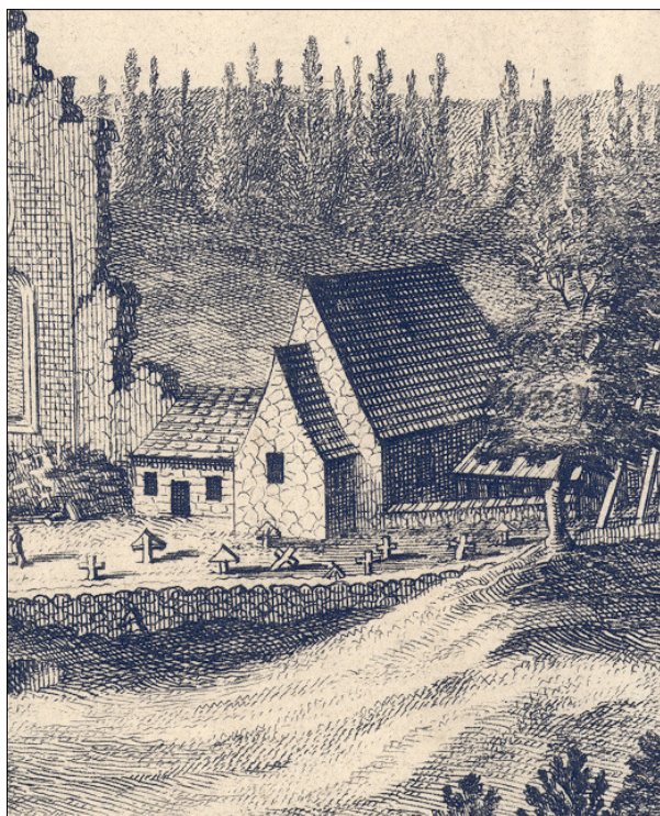
Bondkyrkan så som den avbildades på 1690-talet när Erik Dahlberg gjorde teckningar till Suecia Antiqua. Även sidobyggnaden söder om koret finns här avbildad, liksom en nu försvunnen utbyggnad på norra sidan. Hela kapellet är vid denna tid i gott skick. Detalj ur Suecia Antiqua i Jönköpings läns museums samlingar.

byggnad som kallas "klosterstallet" av okänd ålder. C:a hundra meter söder om anläggningen ligger Nydala herrgård. Godset som senare blev säteri bildades som en följd av reformationen, den nuvarande herrgårdsanläggningen uppfördes omkring 1790-1800 och föregicks av en karolinsk huvudbyggnad från 1600-talets mitt. Herrgårdsanläggningen inreddes till skola 1946 och drevs som sådan fram till 1969. Idag används den för olika ändamål och flyglarna som privatbostäder.