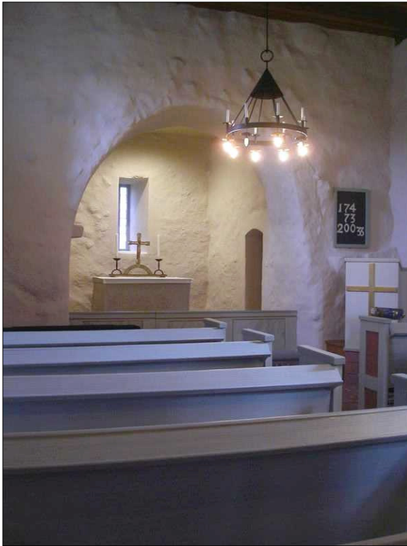
Del av långhuset och koret, med den södra kordörren, samt predikstolen. Inredningen är samtida från 1950- och 60-talet.