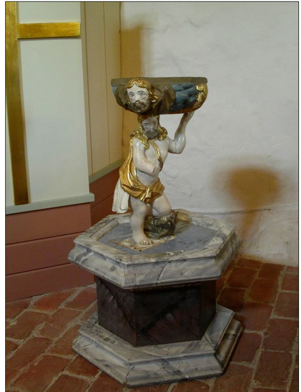
Dopfund vars skål bärs upp av äldre bemålad träfigur. Troligen är den från 1700-talets början och har stått inne i klosterkyrkan.