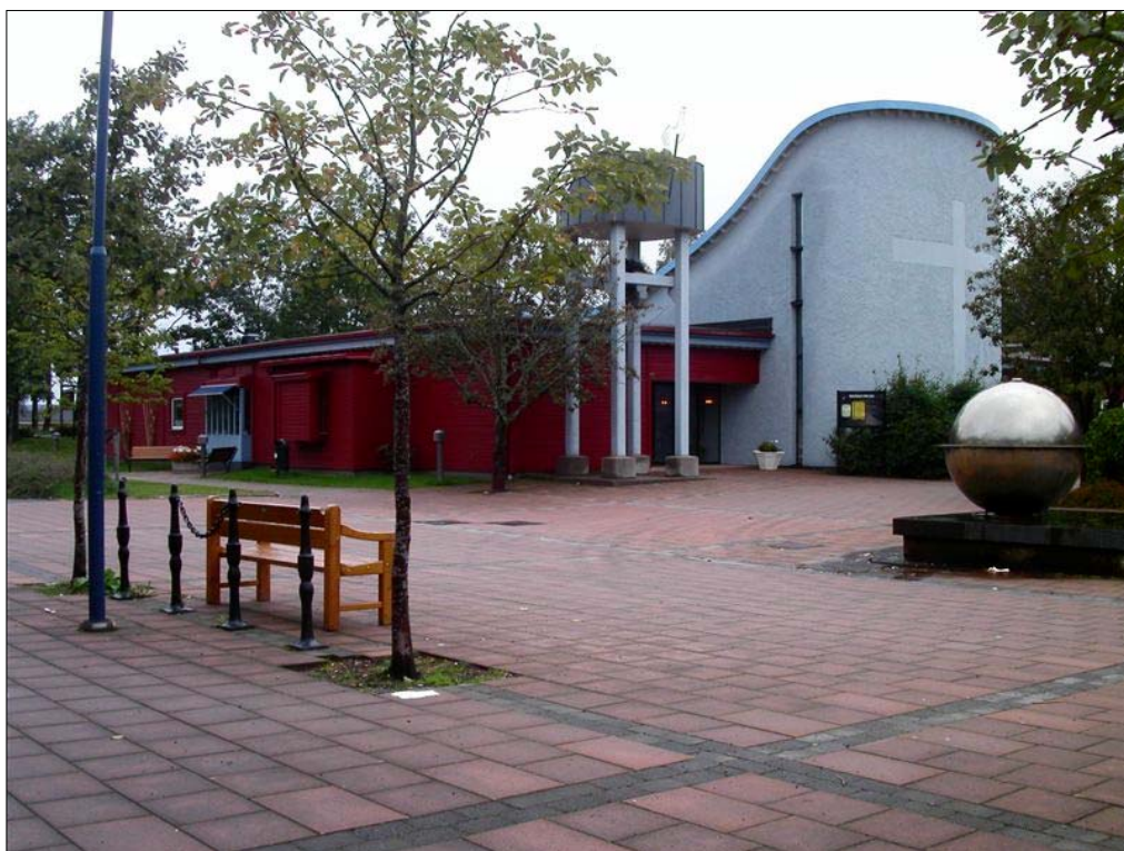
Mariakyrkans karaktäristiska östra parti vid Vråens stadsdelstorg.

Mariakyrkan är en stadsdelskyrka i Vrån, ett bostadsområde i östra Värnamo som uppfördes vid 1970-talets mitt med hyreshus och radhus. Stadsdelen angränsar till ett industriområde i norr, platsen ligger på en svag sluttning mot öster där skog tar vid. I sydväst binds stadsdelen samman med övriga Värnamo. Namnet Vrån härrör från en äldre gård som tidigare låg på platsen. 1975-76 uppfördes en centrumanläggning bestående av bibliotek, livsmedelsbutik, tandklinik, bank och post samt andra småbutiker. I de ursprungliga planerna ingick även ett församlingshem placerat vid torget. I det tidiga skissmaterialet försågs församlingshemmet med ett kapell och kallades ”kapellgård”, men detta utvidgades så småningom till ett invigt kyrkorum. Redan från början fanns önskemål om att hela stadsdelen skulle få en enhetlig och samlande gestaltning, vilket bland annat tog sig uttryck i den röda fasadpanelen. Idag har post, bank och livsmedelsbutik lagts ner och flyttat från centrumet. Istället har ett äldreboende med vårdcentral och apotek uppförts vid centrumet. Kyrkan och dess församlingsbyggnader har också nyligen utvidgats.