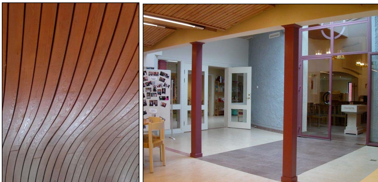
Takpanelen i kyrkorummet samt "kyrktorget" mot församlingsutrymmena.