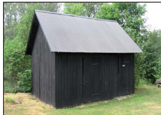
Kyrkogårdens byggnader förutom kyrkan är en klockstapel som uppfördes 1937 i samband med att kyrkan restaurerades och som ritades av Erik Lundberg. En redskapsbod med dass finns placerad vid kyrkogårdens nordvästra hörn.