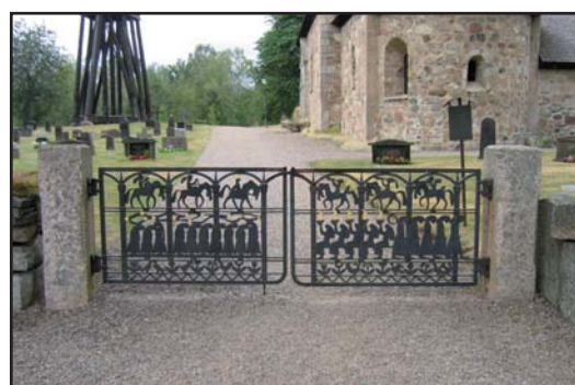
Två av ingångarna till kyrkogården har grindar, överst syns den rostiga anordningen i det nordvästra hörnet och underst grindparet från 1965 föreställande de tio jungfrurna.