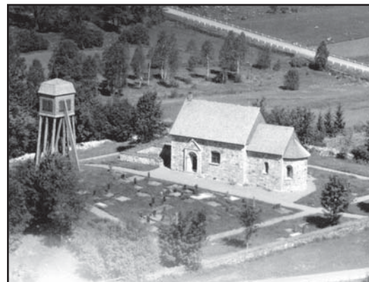
Ett äldre flygfoto visar en annorlunda kyrkogård jämfört med dagens. Den är inte använd i lika hög grad och grusgravarna dominerar. Idag finns ingen av dessa kvar.

Kyrkogården har tre ingångar varav den östra är huvudingång. Den består av en grind fastsatt i krysshamrade grindstolpar av granit. Stolparna är kvadratiska med platt avslutning upptill, alla kanter är avfasade. Grinden smiddes 1965 av smidesmästare Per Anders Henriksson efter ritningar av Maj Starck och föreställer liknelsen om de tio väntande jungfrurna, där de tio går för att möta en brudgum och hans följe. På den vänstra grinden har de tröttnat på att vänta och satt sig ned och somnat. Vid midnatt hörs ljudet från det nalkande brudföljet. På den högra grinden ses fem av flickorna med höjda brinnande lampor medan fem har fått slut på olja under väntan och går med böjda huvuden därifrån. I det nordvästra hörnet finns ytterligare en järngrind i betydligt enklare utförande. Grinden och dess gallerkonstruktion är mycket rostig. Från kyrkogården till prästgården finns i den norra muren en öppning utan grind.