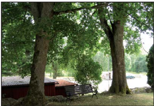
Två äldre lönnar vid kyrkogårdens östra sida.