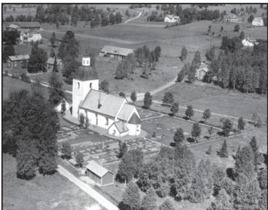
Flygfoto över kyrkogården från 1947-49.