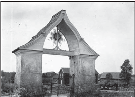
Stigluckan 1903 ovan och 2007 till höger.