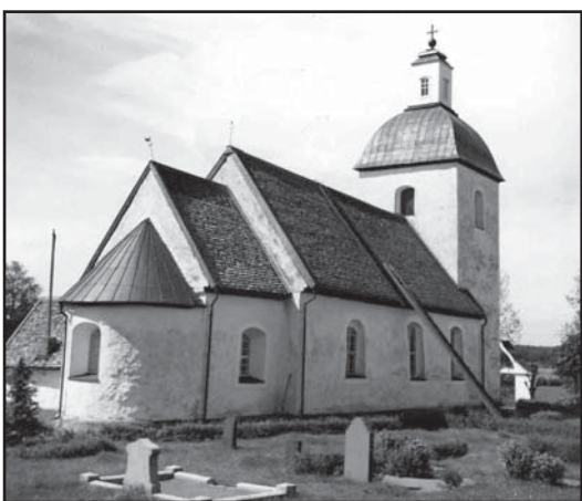
Hylletofta kyrka 1913 respektive 1946.