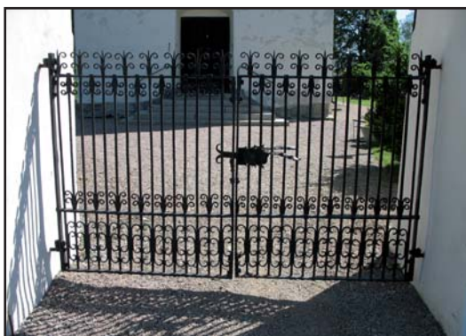
Stigluckans utsirade smidesgrind.