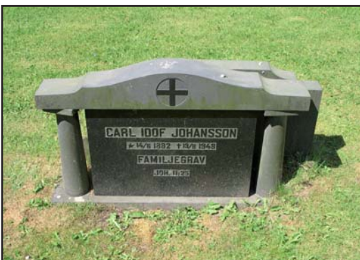
Raderna av gravvårdar kan se homogena ut men utformningen på vårdarna skiljer sig åt.