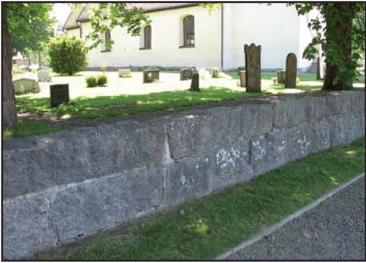
Den omgärdande stenmuren lades om 1903.