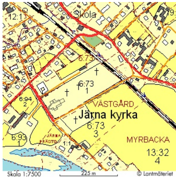
Järna kyrka, Västgård 6:73