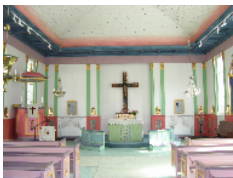
Kyrkorummet före och efter 1982-83 års ombyggnad