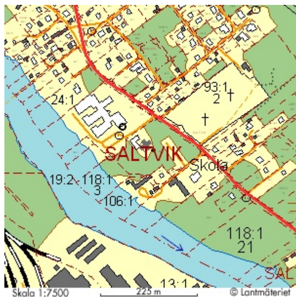
Vansbro kyrka, Saltvik 93:1