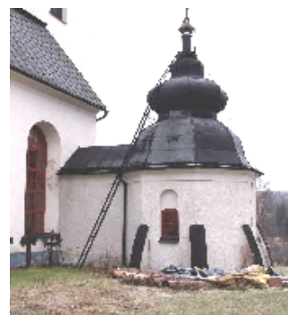
Pannhus och kolhus, från 1902-års restaurering. Ark. I. Wahlman