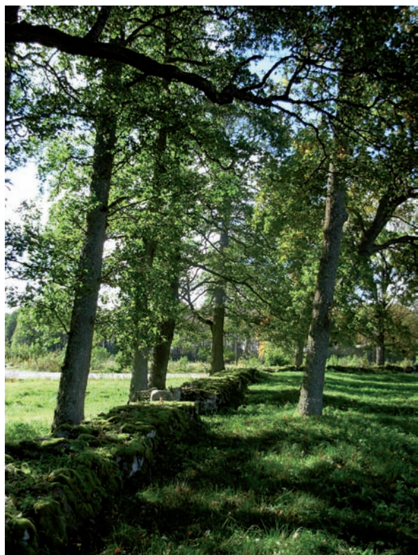
Överst: Ingång i söder Mitten: Högvuxna aspar på kyrkogårdens norra del. Nederst: Trädkrans invid södra kyrkogårdsmuren.