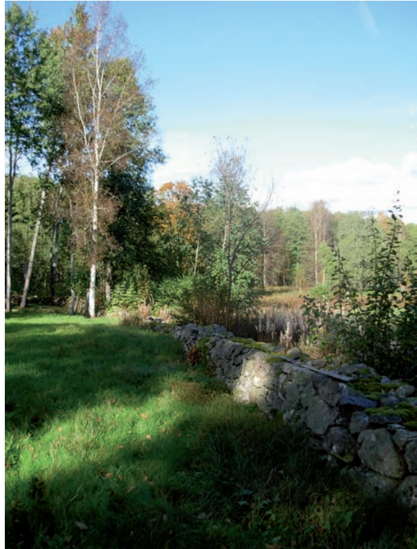
Östra muren med nära angränsande vegetation, sedd från söder.