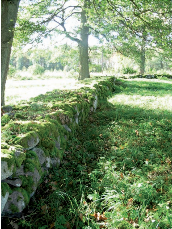
Södra muren sedd från öster.