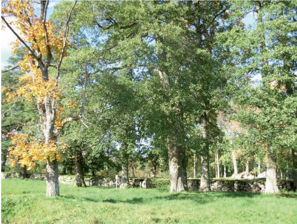
Kyrkogården sedd från söder.