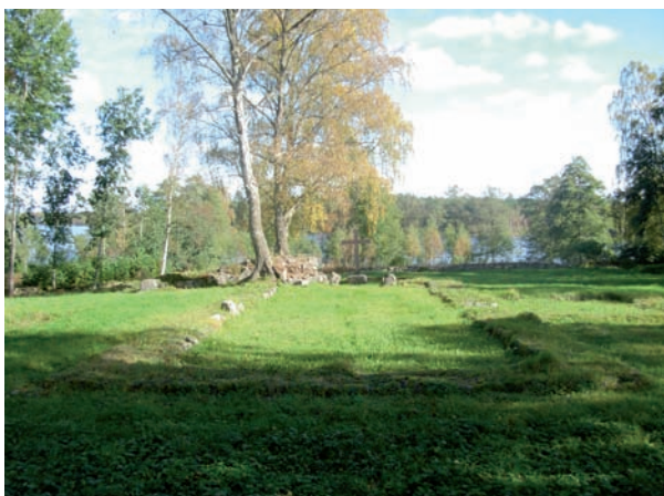
Den gamla kyrkans kvarvarande rester sett från väster.