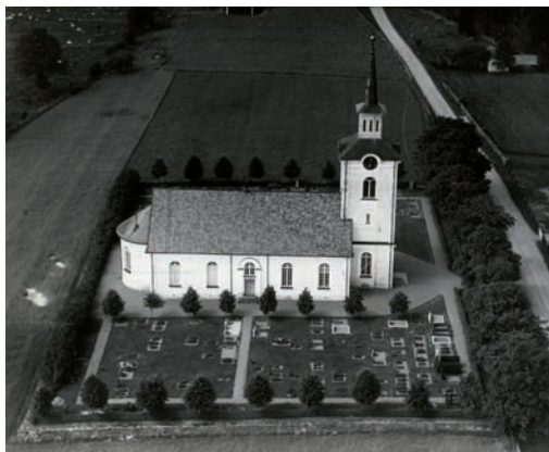
Flygfoto från 1941.

På andra sidan vägen ligger församlingshemmet som fram till 1960-talet var skola. På samma tomt ligger f d kyrkstallet som idag används som redskapsbod för skötseln av kyrkogården. Bostadshuset som ligger mitt emot kyrkan byggdes samtidigt som kyrkan som sockenstuga och övergick med tiden att användas som skola. När den nya skolan byggdes på 1920-talet användes byggnaden som kommunalhus. Samtidigt som sockenstugan uppfördes byggdes även magasin och stallar.