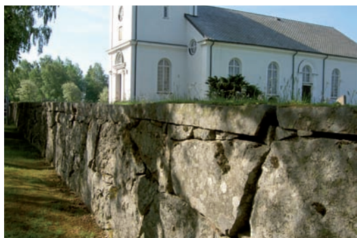
Kyrkogårdsmuren är kallmurad av huggen sten

Kyrkogården har en ingång som finns i öster. Den öppnas med fyra järngrindar, en dubbelgrind och två enkla. De tillverkades 1865 av smeden Sjögren i Hornaryd och skänktes av bruksägaren Isak Sjöbring på Thorsjö.