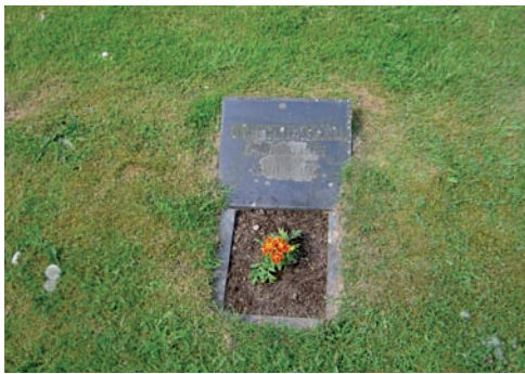
En av de gravvårdar som är ett exempel på grav inom allmänna linjen.