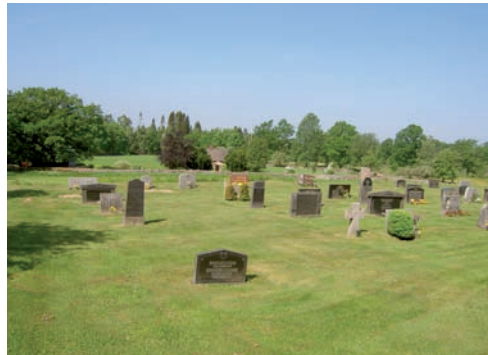
Kvarteret består av fem rader gravvårdar. Vissa rader är mer utspridda och glesa.