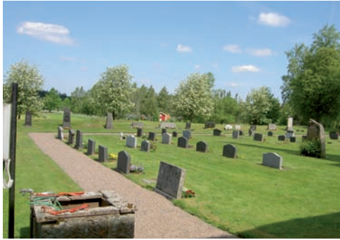
Kvarter D är beläget i kyrkogårdens nordöstra del och genom att gravvårdarna är huggna främst i diabas och grå granit ger det ett sammanhållet intryck.