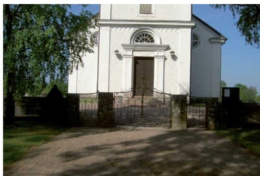
Ingången har fyra järngrindar, en dubbelgrind och två enkla tillverkade år 1865.