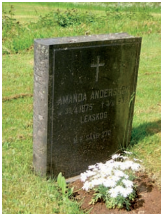
Gravvård formad som en hopslagen stående bok.