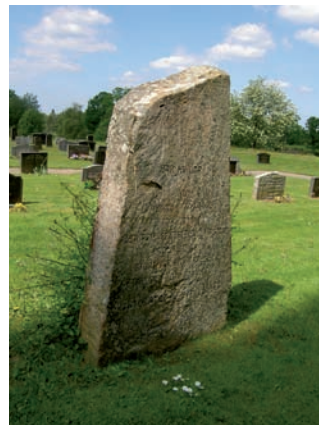
Gravvården som restes av församlingen över socknens skolmästare 1881.