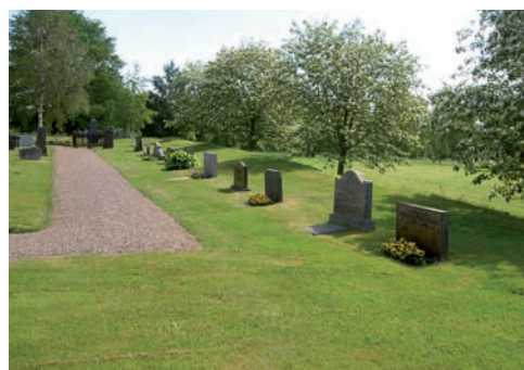
Kvarter C är placerad som ett L i söder och väster och gränsar till kvarter A och B och kyrkogårdsmuren.