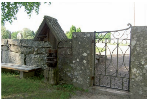
Fattigbössan står strax intill ingången.