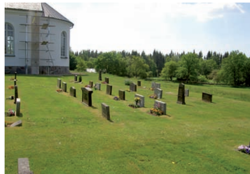
Kvarteret har en homogen karaktär genom att gravstenarna är av diabas och grå granit.