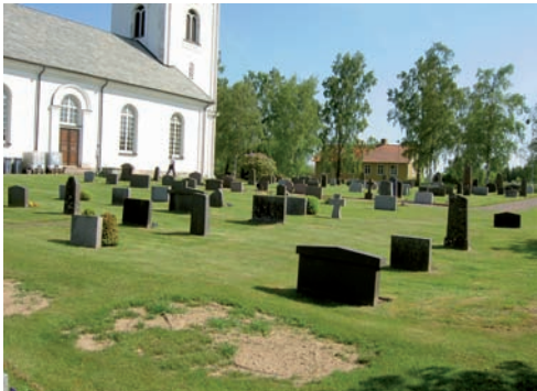
Kvarter B är beläget i sydöstra delen av kyrkogården.