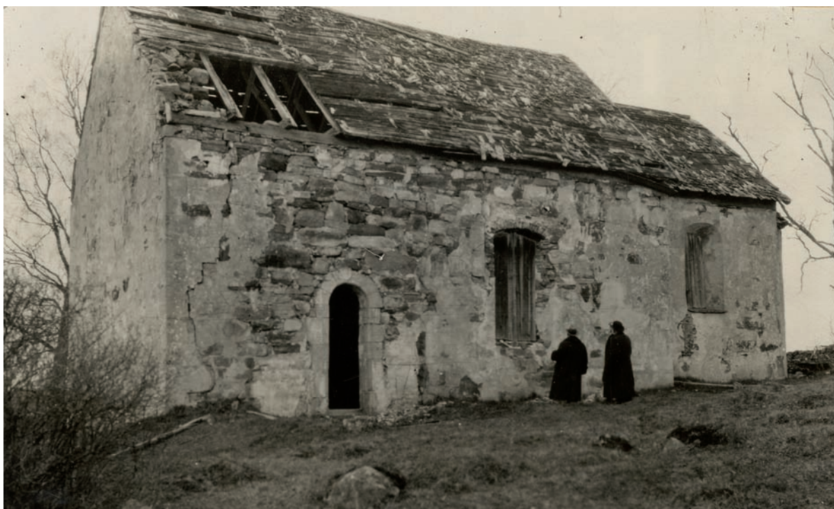
Hemmesjö gamla kyrka innan renoveringen 1921.