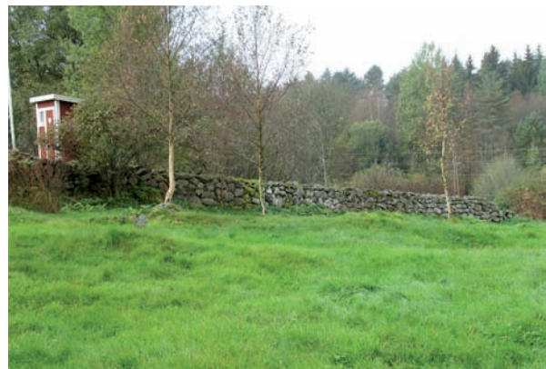
Överst. Grinden i öster är av järnsmide.