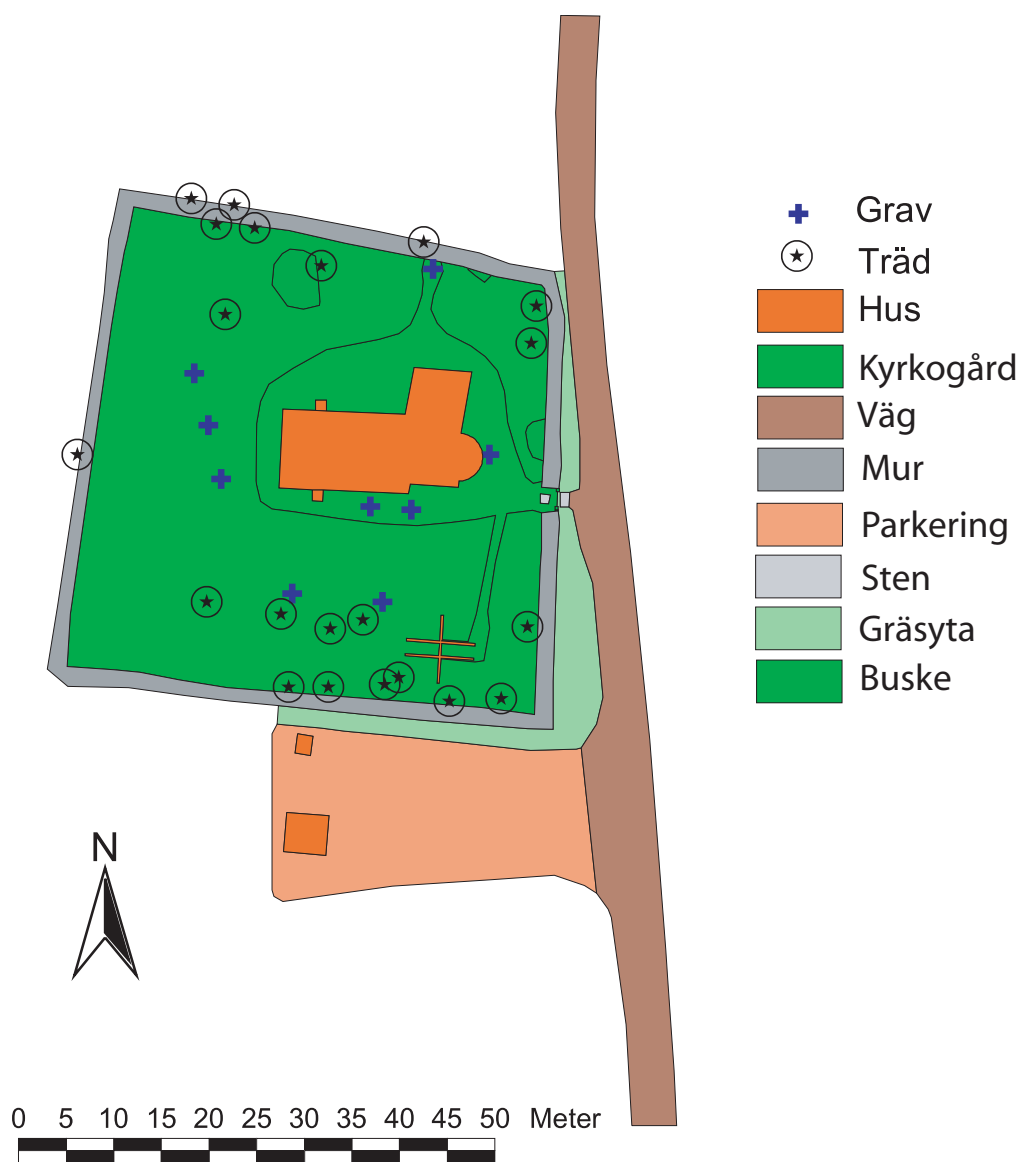
Gravkarta över Hemmesjö gamla kyrkogård.