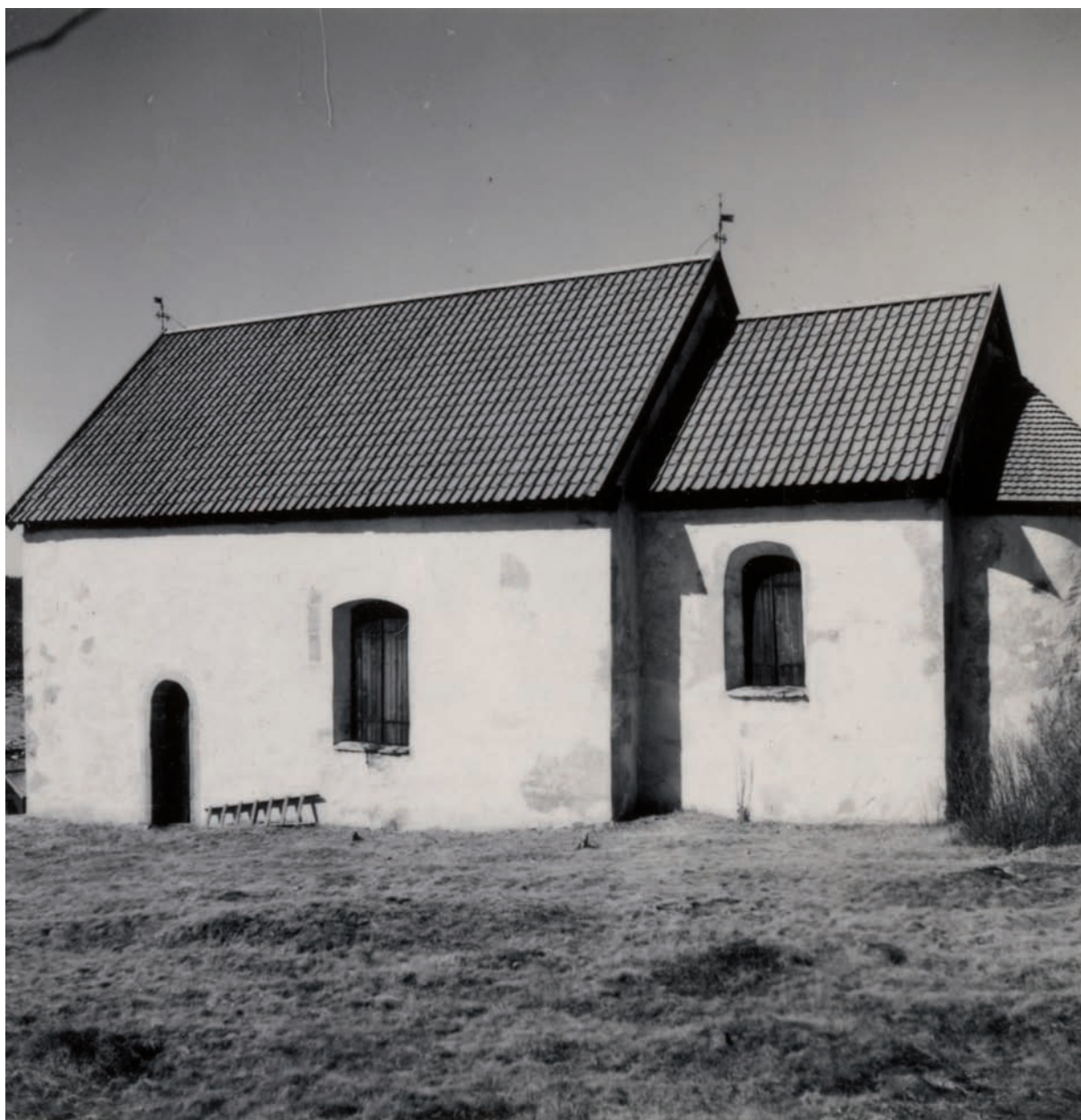
Hemmesjö gamla kyrka och kyrkogård 1940.

Då det inte förekommit några gravsättningar på Hemmesjö gamla kyrkogård sedan 1850-talet och de gravvårdar som finns är av ålderdomlig karaktär, har kyrkogården mycket stort kulturhistoriskt värde, är det viktigt att kyrkogården bevaras i nuvarande skick. Den ålderdomliga karaktären som kyrkogården har är unik och den enda i sitt slag i Kronobergs län.