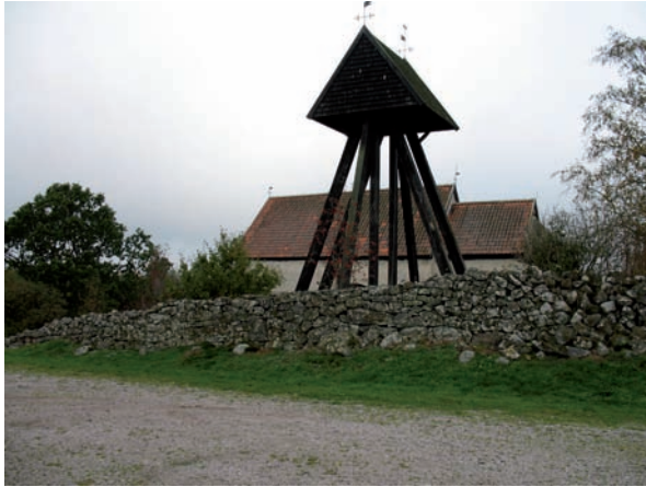
Klockstapel och södra kyrkogårdsmuren