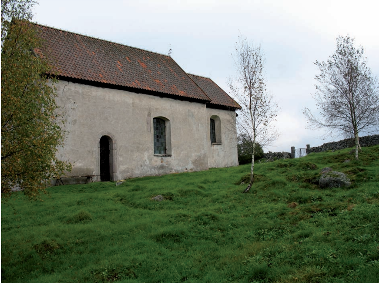
Södra sidan av Hemmesjö gamla kyrkogård. Notera den ojämna markytan.