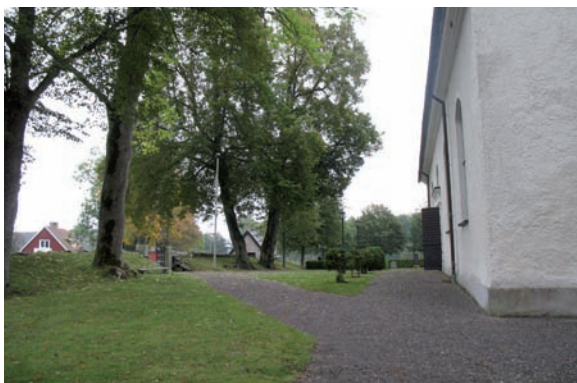
Grusgångar norr om kyrkan