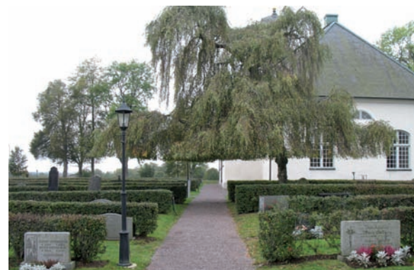
Hängbjörken i kvarter A