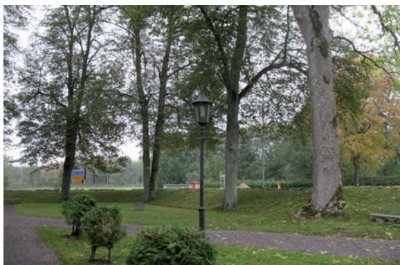
Ovan: Kvarteret nordväst om kyrkan Till höger: Fattigbössan

Kyrkogården omgärdas av en 1-1,5 m hög kallmur, vars yttre sida är plan medan den inre utgörs av en gräsklädd sluttning upp till murkrönet.