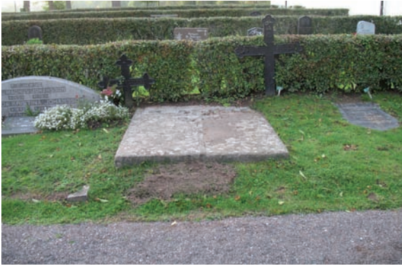
Den äldsta gravvården i kvarter C är en stor stenhäll från 1827. På var sida om den finns ett gjutjärnskors.