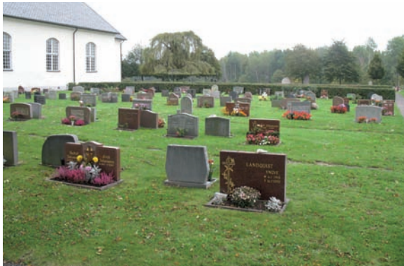
De nyaste gravvårdarna i kvarter D ligger i dess västra del.