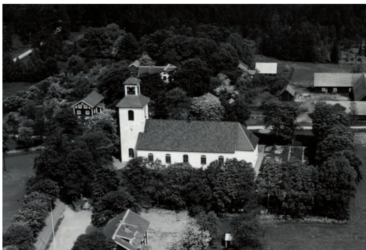
Nöbbele kyrka och kyrkogård sett från söder 1941.

På ett flygfotografi från 1941 kan vi se att det fanns några stenomramade grusgravar i nordöstra delen av kyrkogården (nuvarande kvarter A). Inuti kvarteret leder nord-sydliga grusgångar. Söder om kyrkan ser vi sockenstugans tak och i norr skimtar vi prästgårdens ljusa frontespis och taket på magasinet. Bårhuset är ännu inte byggt.