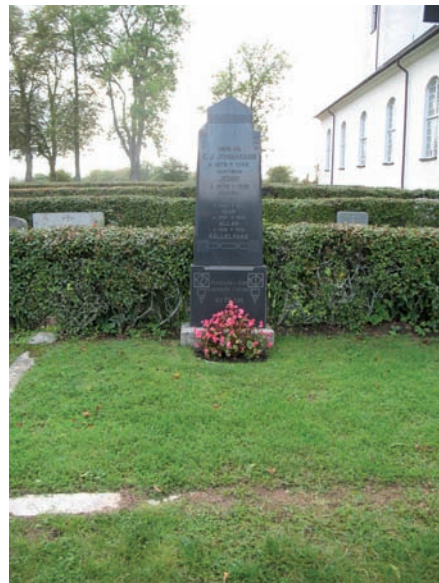
Till höger: En annan steninramad gravplats rymmer en högrest gravsten i diabas, som restes 1918.