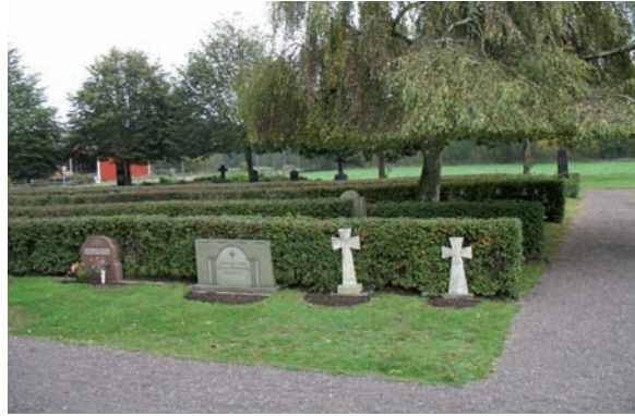
Två marmorkors tillhör de mer ovanliga gravvårdarna i kvarter A.