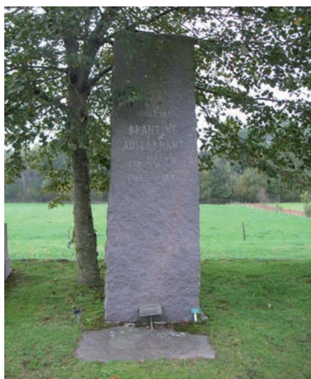
På denna högresta sten står: "Familierna Branting Adlerbrant von Rosen 1746-1849". På en skylt står: "På stenen angivna släkter härstammar från Orraryd. Här vilar även medlemmar av släkten von Boisman från Ulvsåkraholm – avlidna under åren 1726-1767".