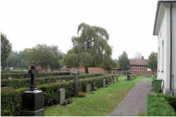
Kvarter A ligger öster om kyrkan och i dess södra del finns en hängbjörk.