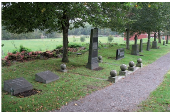
Kvarter E ligger längs med östra kyrkogårdsmuren.

Kvarteret är närmast oanvänt och framtiden får avgöra hur dess karaktär ska utvecklas.