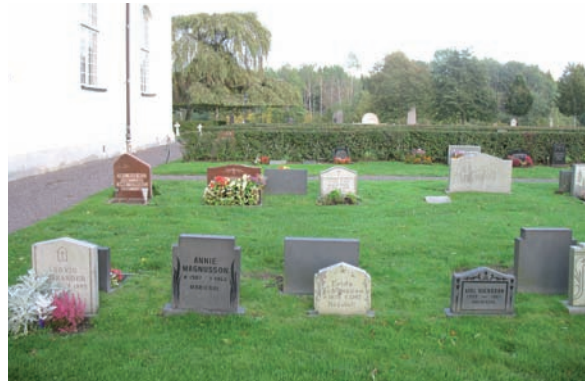
Det finns ovanligt många små gravvårdar i kvarter D.