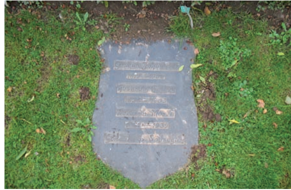
Till höger om den stora hällen ligger en liten häll med ovanlig form i diabas från 1900.