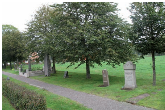
Olika typer av gravvårdar finns i detta kvarter men många är högresta eller påkostade genom omramningar.