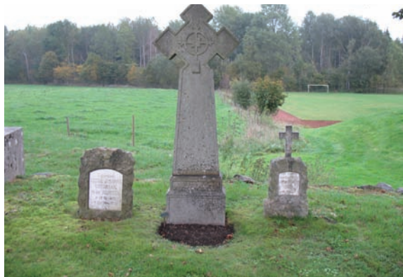
Även gravstenar av mindre storlek kan vara kulturhistoriskt värdefulla. T ex dessa två som har textplattor i marmor.