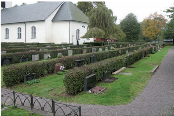
Ovan: Kvarter B är beläget sydost om kyrkan. Här kan vi se en gravplats med stenram.