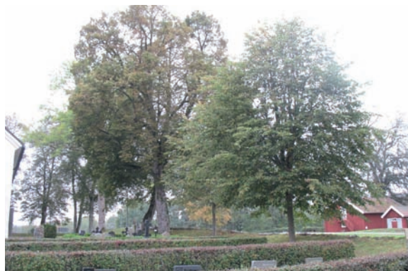
Trädkransen norr om kyrkan