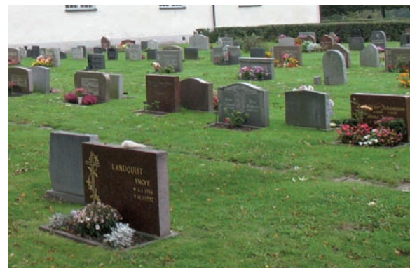
I kvarter finns två gånger med ölandskalksten