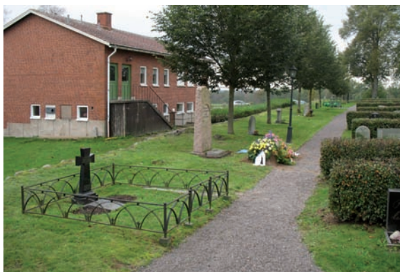
Längs med den södra kyrkogårdsmuren finner vi kvarter F.