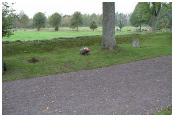
I kvarter G finns det endast en gravvård men det finns blommor planterade på två platser till.