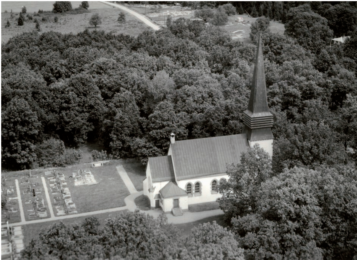
Flygfotografi taget från söder 1947.