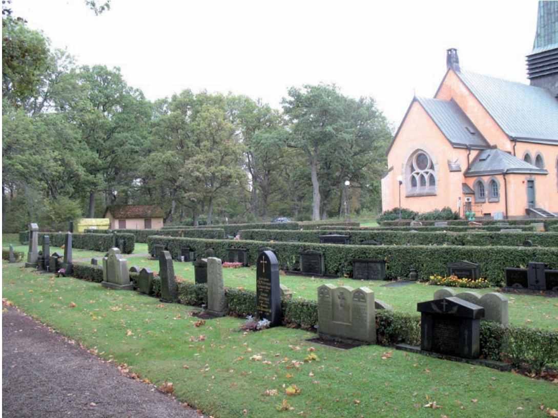
Kvarter C är beläget sydväst om kyrkan.