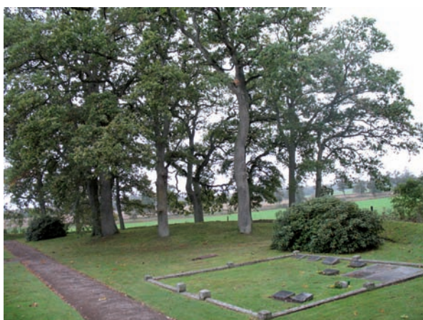
Ekarna i kvarter A spelar stor roll för dess karaktär.

Familjen Rappes gravplats bör bevaras för framtiden som en påminnelse om varför kyrkan lades på just denna plats och att det var friherreparet som skänkte marken till kyrkogården. Stenramen är av stor vikt och de fem gravvårdar som nämnts ovan bör likaså bevaras. Nya gravplatser bör ej placeras alltför nära inpå denna, då den bör framhävas som speciell.