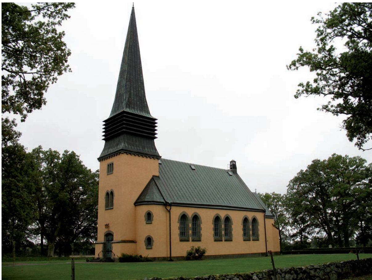
Jäts nya kyrka uppfördes 1908-1910.