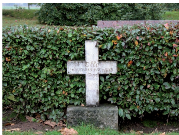
Detta marmorkors restes över Ella som levde från maj till juli 1915.