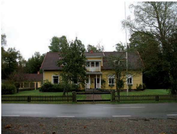
Tvärs över vägen ligger församlingshemmet.

Tvärs över vägen ligger en f d skolbyggnad som idag fungerar som församlingshem. Utanför norra kyrkogårdsmuren ligger en redskapsbod som uppfördes 1952.