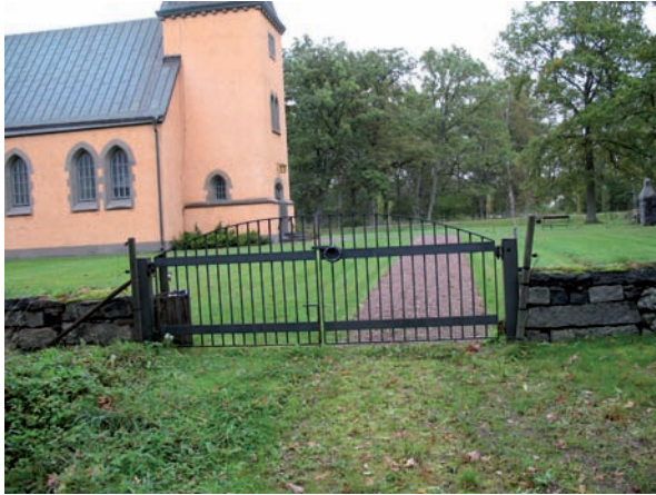
Dubbelgrindarna till den södra entrén är av ett modernare slag.