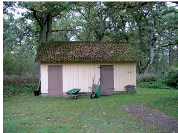
Norr om kyrkogården finns en redskapsbod.