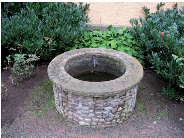
Denna brunn är placerad väster om kyrkan.

Kyrkogården inhägnas av en kallmur i gråsten, på insidan täckt av en grässlänt. Utanför muren är ekar planterade som en trädkrans.