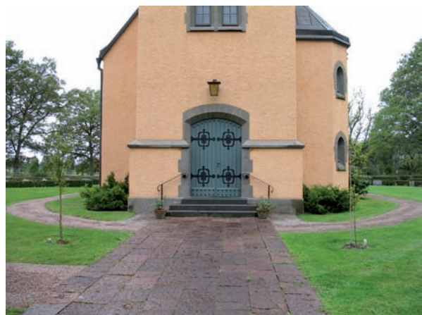
Gången som leder till kyrkan från huvudentrén är belagd med kalkstensplattor.