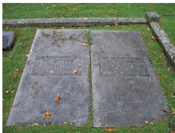
Friherreparet Rappe skänkte marken till Jäts nya kyrkogård.