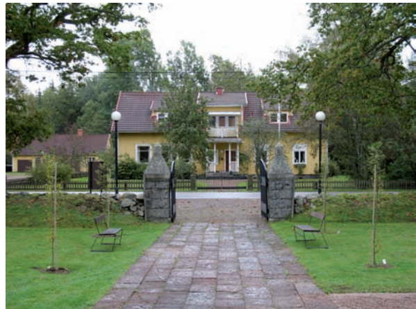
Längs gången som leder till kyrkan från huvudentrén i öster är avenbokar nyligen planterade.

Gången mellan kyrkogårdens huvudingång och kyrkans tornportal är belagd med kalkstensplattor, övriga gångar är grusade. En gång leder från denna gång till den södra ingången. Kring kyrkan leder en gång och där den rundar koret i väster förgrenar den sig mot söder, väster och norr. Gången mot norr leder till en av de öppningar som finns där. Längre västerut finns ytterligare en nord-sydlig gång vars norra ände ansluter till den andra öppningen i den norra muren. Gångarna fungerar som avskiljare mellan kyrkogårdens olika kvarter. Ett antal lyktstolpar är placerade längs gångarna.