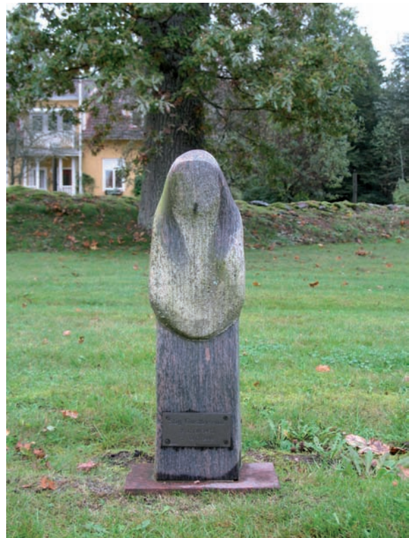
Än så länge finns det endast en gravvård i kvarter E, den är utformad som en madonnastaty.