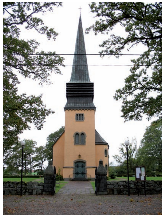
Grindstolparna till huvudentrén har en säregen utformning.