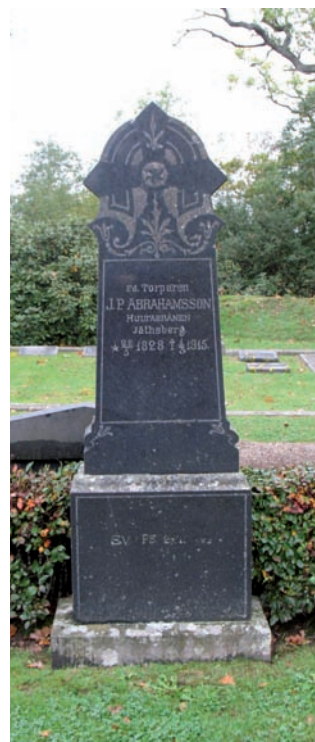
Även en torpare kunde få en högrest gravsten 1915.

Detta kvarter har använts sedan kyrkogården anlades. Åtminstone i den västra delen finns äldre gravvårdar från kyrkogårdens äldsta tid. Några rader längst åt väster bör bevaras för att även i framtiden visa hur gravskicket var vid den tid när kyrkogården anlades. Ett urval av gravvårdar från senare decennier bör också bevaras. De nord-sydliga gravraderna bör behållas. På flygfotografiet från 1947 verkar det dock inte som att det fanns några rygghäckar. Idag ses det som ett trevligt inslag men eftersom det inte verkar vara en ursprunglig företeelse är de inte viktiga ur kulturhistorisk synpunkt.