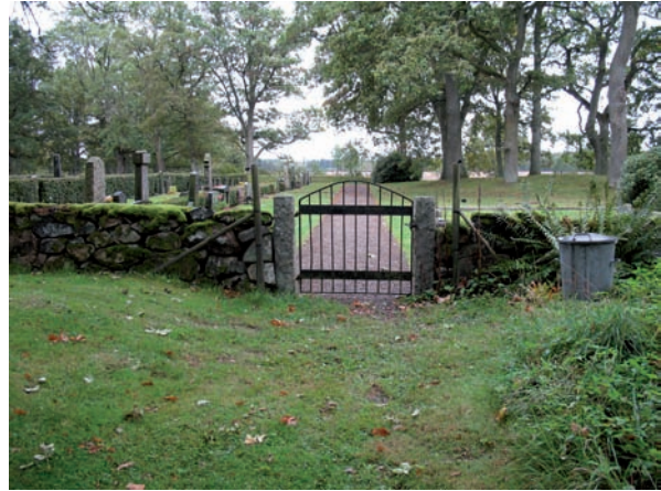
De norra entréerna har enkla grindar.