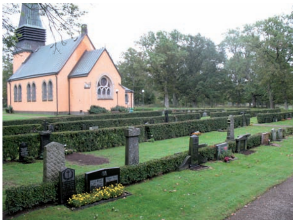
Kvarter B är beläget nordväst om kyrkan.