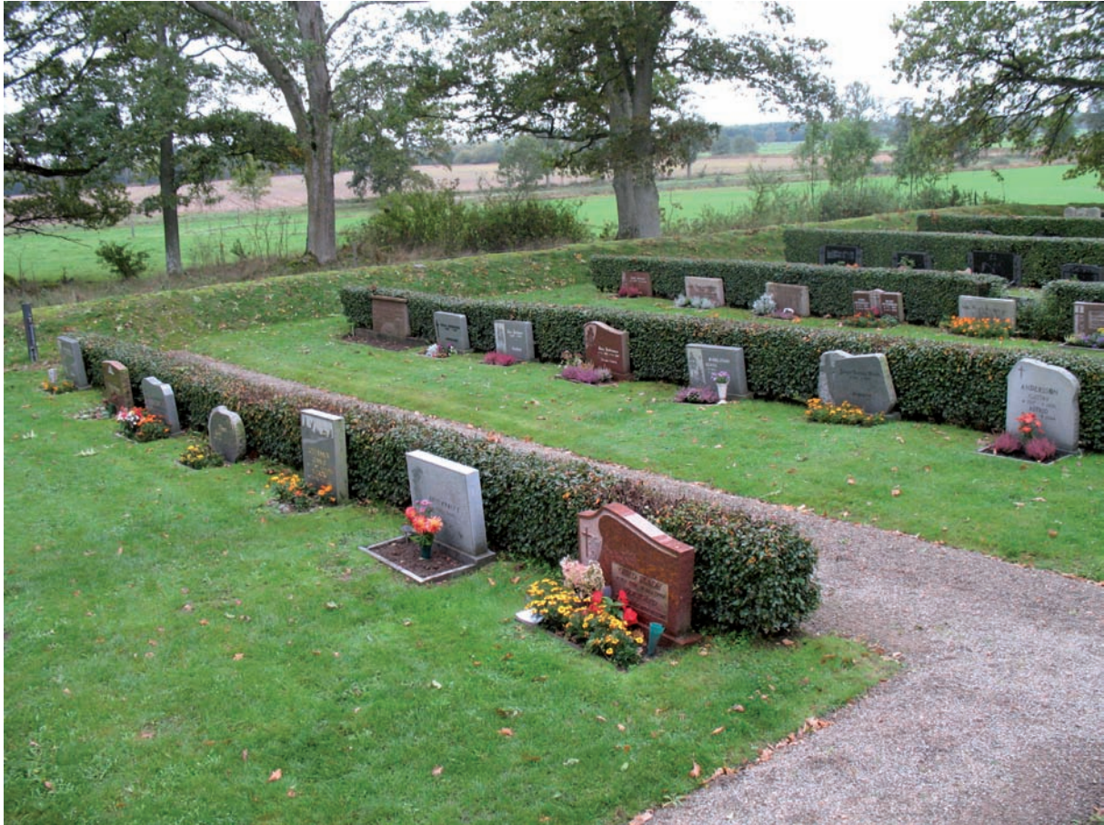
I kvarter D har ännu inte många gravplatser anlagts.