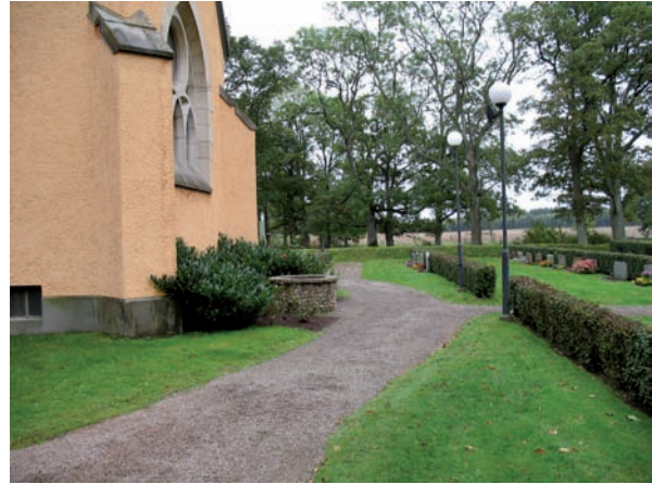
Väster om kyrkan möts alla gångvägar.

Det finns ingen samling av bortplockade gravvårdar.