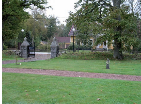
Kvarter E är beläget i kyrkogårdens sydöstra del.

På samma sätt som kvarter D bör framtiden få avgöra kvarterets karaktär.