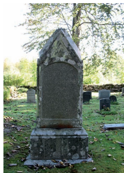
Denna vård är rest 1857.