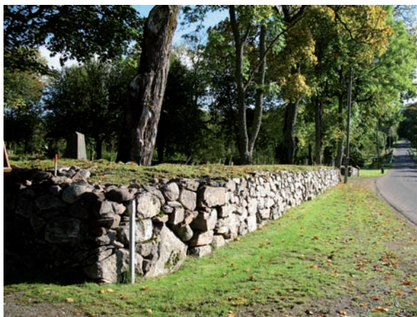
Kyrkogården omgärdas av en kallmurad stenmur.