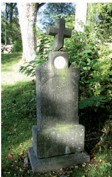
Högre gravvård dekorerad med Thorvaldsenmedaljong.