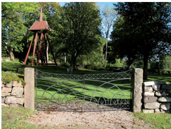
Kyrkogården har endast en ingång vilken är placerad i södra kyrkogårdsmuren.