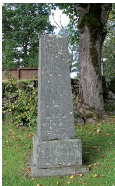
Monumental gravsten rest på 1870-talet.