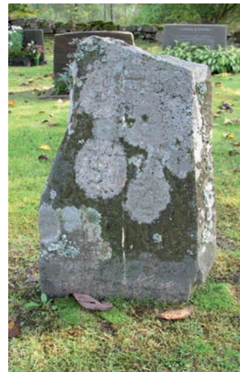
Ovan: Häll med tillhörande stenram och grusbelagda gravplats. Till vänster: Kyrkogårdens äldsta gravsten från 1763.