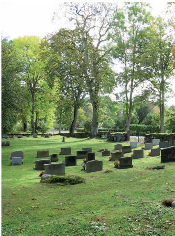
Kyrkogården används än idag och består till mesta delen av låga rektangulära stenar från 1940-talet och fram till vår tid.

Kyrkogården har endast en ingång vilken är placerad mitt på den södra kyrkogårdsmuren. Muren har precis intill ingången vinklats in mot kyrkogården. Öppningen har försetts med två sirligt smidda grindar vilka är upphängda på huggna granitstolpar.