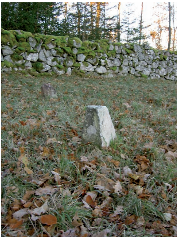
Två äldre gravminnen i form av resta naturstenar i anslutning till kyrkogårdens sydvästra hörn.