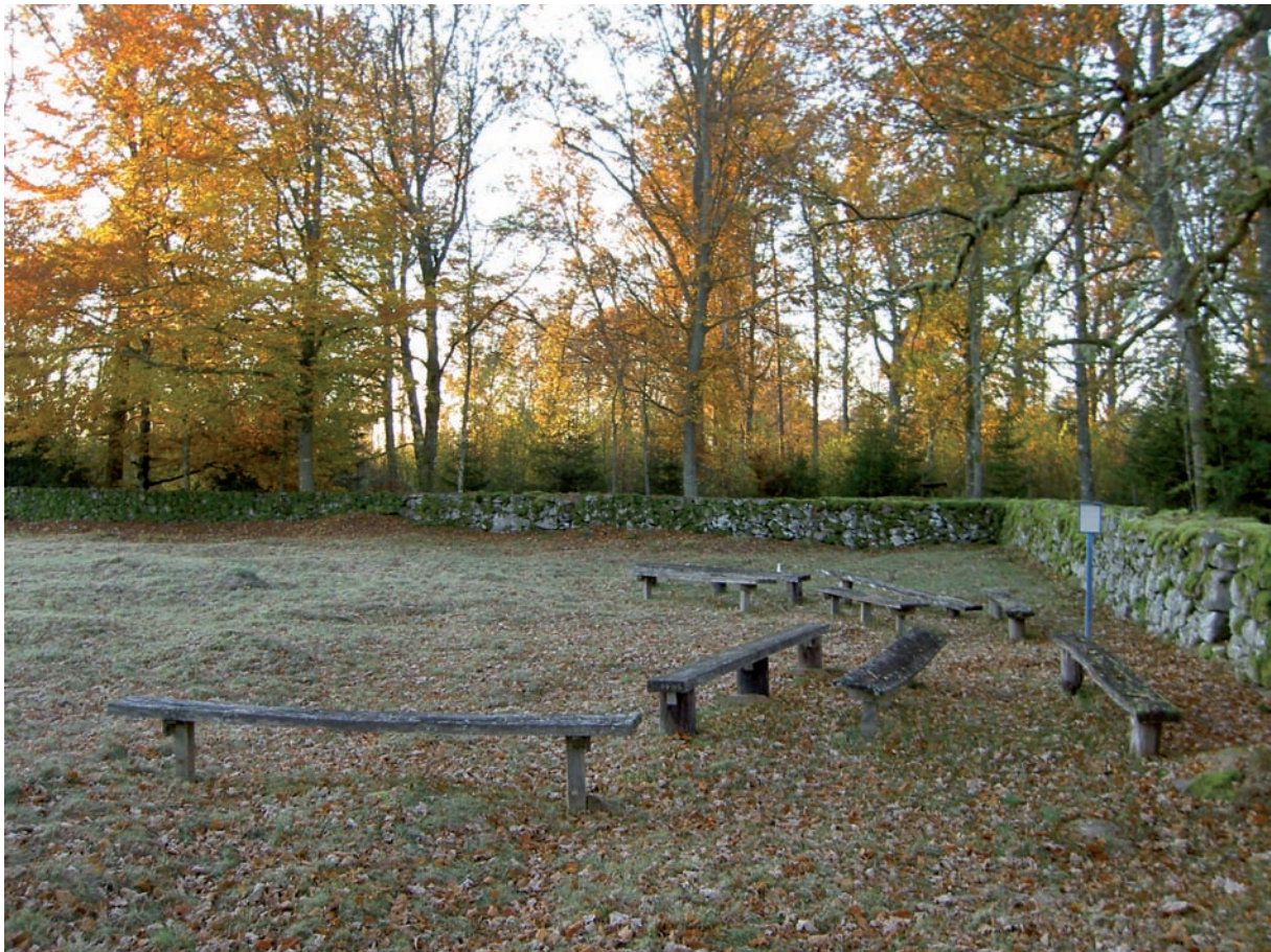
Fasta bänkar utav trä på kyrkogårdens västra del.