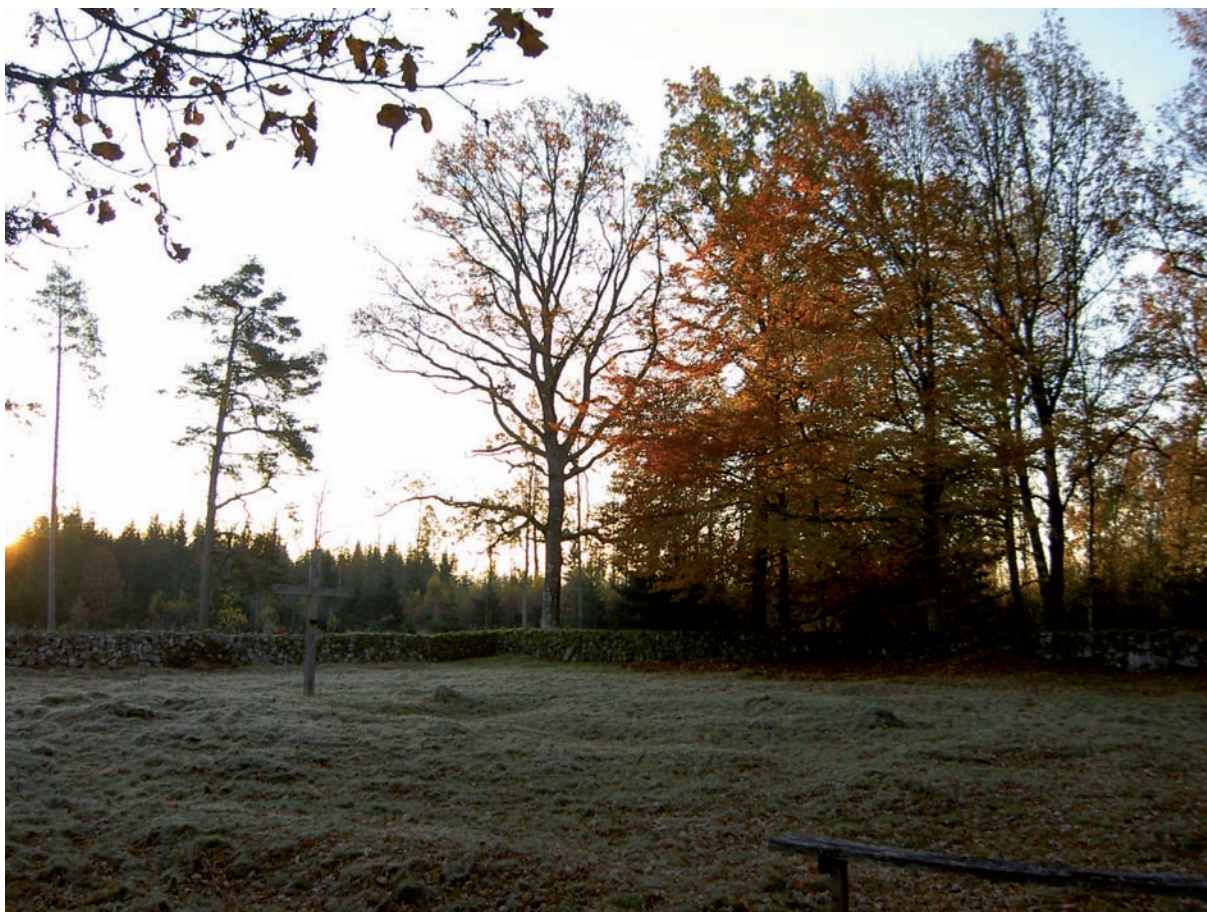
Kyrkogården sedd från nordväst.