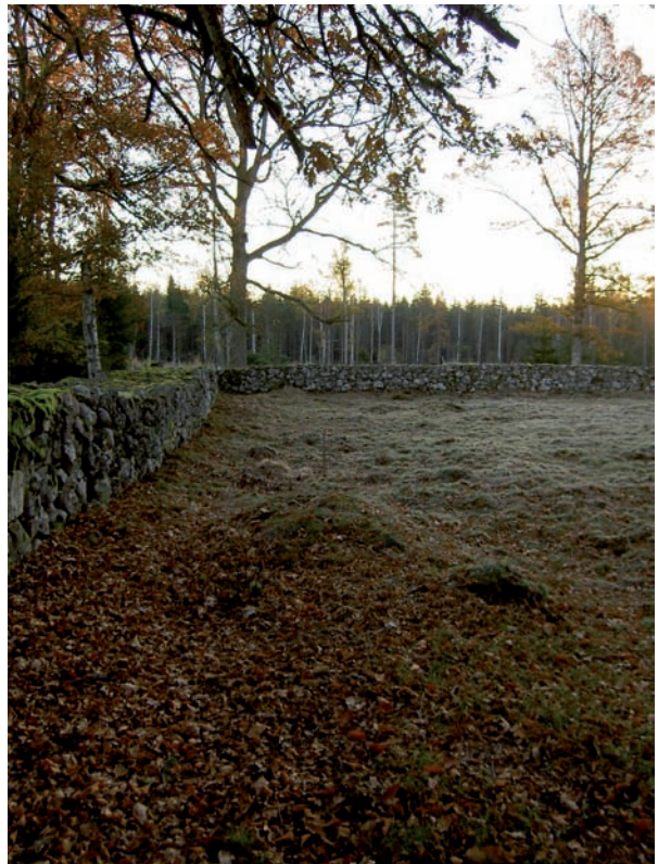
Kyrkogårdens norra sida, kuperad och med tydlig ängskaraktär.