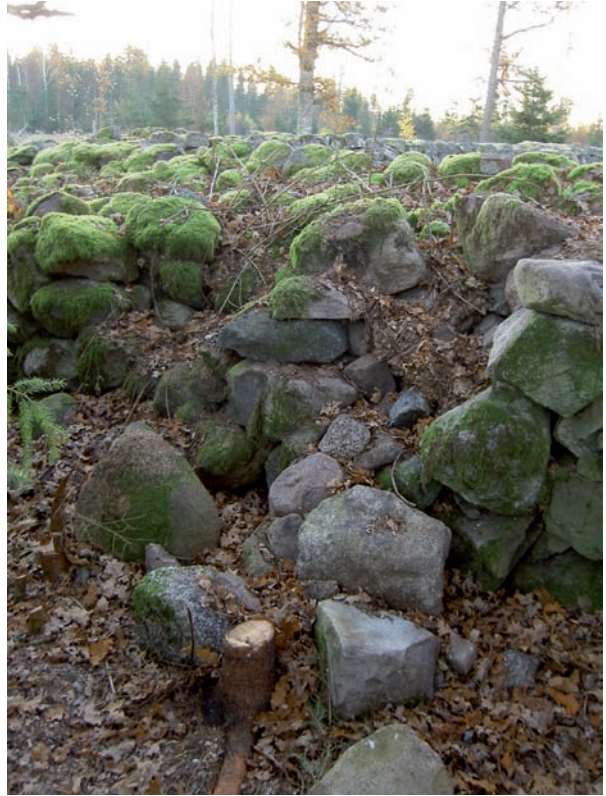
Skador uppkomna till följd av att trädrötter trängt in i murverket.