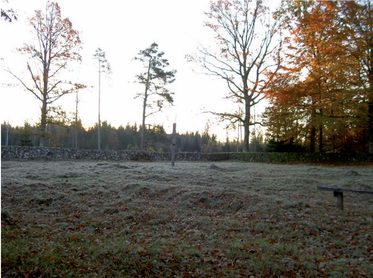
Kyrkogården sedd från nordväst. Kyrkans grund syns som upphöjningar i gräset.