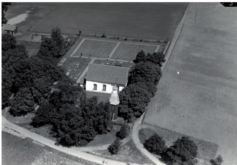
Flygfoto över Dörrarps kyrka år 1941.