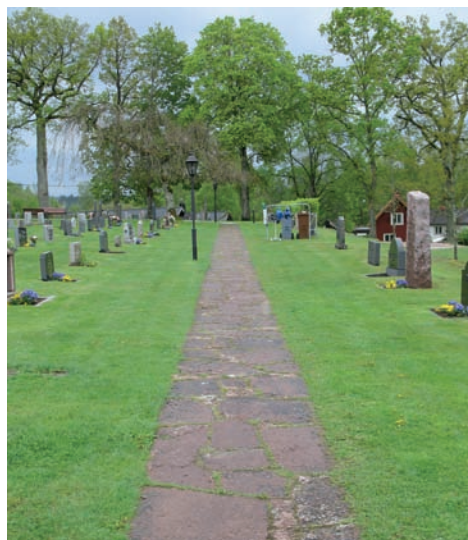
Den gång som går i nordsydlig riktning är belagd med röd Ölandssten.