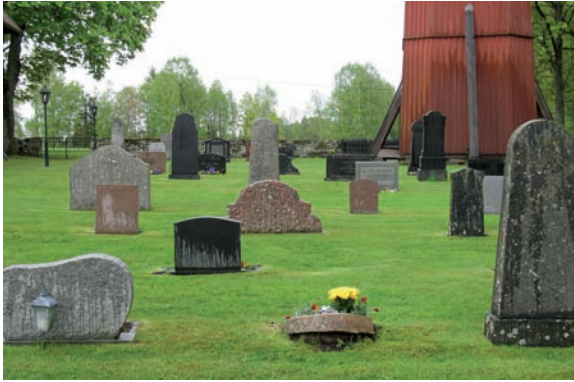
Kvarter A karaktäriseras utav ett större antal högresta och monumentala gravvårdar blandat med ett antal låga, långa samt låga rektangulära gravvårdar.