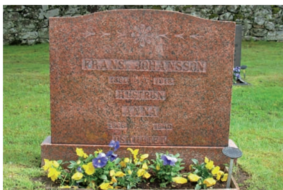
Gravstenar uppförda i röd granit är vanligt förekommande i kvarteret.