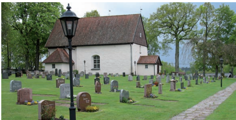
Kyrkan ligger på en höjdslutning i Dörrarps samhälle.

En liten rödmålad ekonomibyggnad av trä står i nordväst utanför kyrkogården.