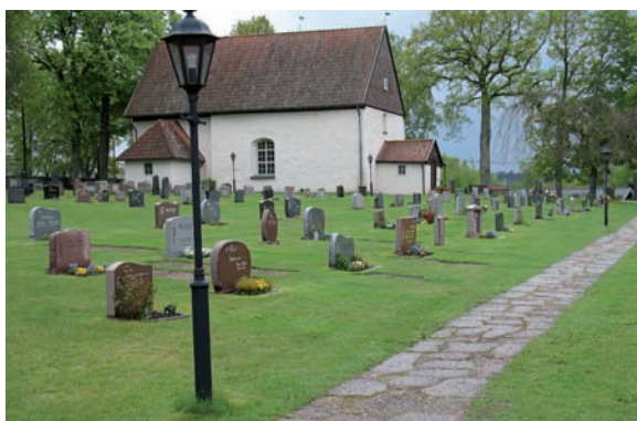
Kvarter B karaktäriseras av låga rektangulära gravvårdar uppförda i främst röd och grå granit, men med inslag utav smala, låga diabasvårdar.

På gjutjärnskorsen bör rostbeläggningsen tas bort, vilket görs med stålborste. Därefter grundas järnet med blymönja och slutstrykes med linoljefärg. De tre gjutjärnskorsen bör, om så inte redan är fallet, uppföras på kyrkans inventarieförteckning.