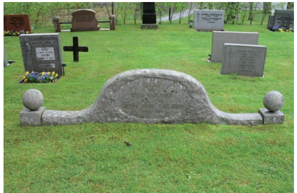
En utav de gravvårdar som tidigare haft tillhörande stenram. Av den finns idag inget kvar.