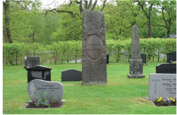
Mitt i kvarteret står en monumental familjegrav uppförd i grå granit som tidigare haft ett fint gjutjärnsstaket framför sig.