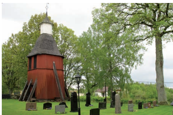
Klockstapeln uppfördes 1697 och är av typen klockbock.