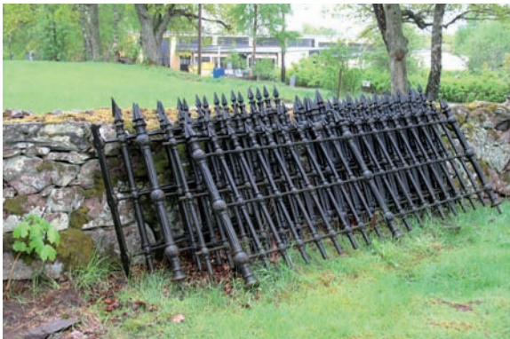
Bevarat gjutjärnsstaket uppställt längs den östra muren.