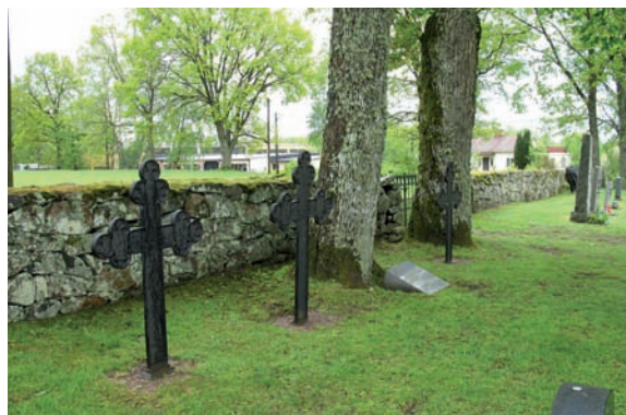
I kvarteret står två gjutjärnskors från slutet av 1800-talet.