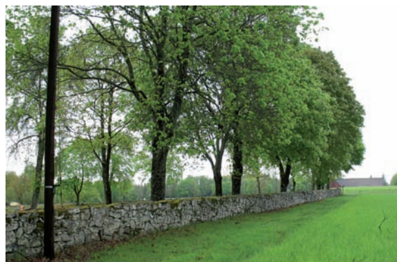
Innanför muren växer en trädkrans som till största delen består av lönn och ek.