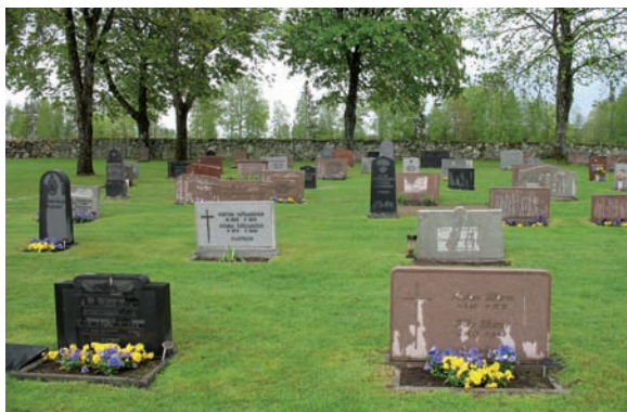
Kvarter C med sin lågt hållna skala.