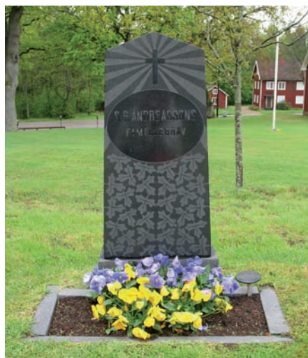
Flera utav gravvårdarna är vackert utsmyckade med blåstrade bladverk och dekorationer.