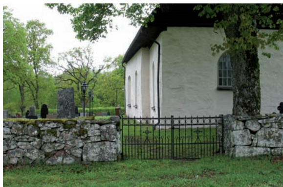
Den syd-östra ingången är försedd med sirliga smidesgrindar som bärs upp av huggna granitstolpar.

Klockstapeln uppfördes 1697 och är av typen klockbock. Den står i syd-östra hörnet utav kyrkogården på kvarter A. Den är inklädd med röd locklistpanel och taket är klätt med tjärat spån.