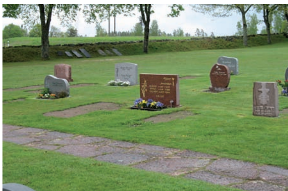
Kvarter D ligger längs den norra vallmuren och karaktäriseras utav det lilla bestånd av gravvårdar som det innehåller.

Då man inom en snar framtid planerar att göra en urnlund eller minneslund i kvarteret bör man ta hänsyn till karaktären på dels kvarteret och dels på hur kyrkogården i stort är utformad. Detta för att inte bryta alltför mycket med kyrkogårdens uttryck. Förslag till utformning lämnas till länsstyrelsen.