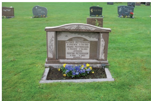
Kvarter D har gravvårdar utförda i röd och grå granit samt hallandia och labrador.