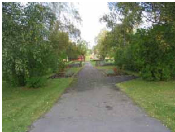
Parken och kyrkogårdens ingång i söder. (KI Kråksmåla nya kyg 003)