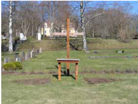
Ceremoniplatsen mitt på kyrkogården.