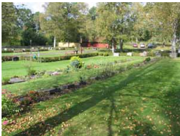
Vy över kyrkogården från sydost. I förgrunden kvarter 5 med urngravplatser. (KI Kråksmåla nya kyg 011)