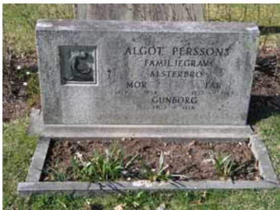
Gravstenen Algöt Perssons vid Algöt Perssons familjegrav är tidstypiskt låg och rektangulär. Dekoren av koppar är ovanlig. (KI Kråksmåla kyg 065)

Nya kyrkogården har brukats sedan 1951 då de första gravsättningarna gjordes. Framförallt dominerar perioden 1955-1979 vilket syns tydligt i gravvårdsmaterialet. Den vanligaste typen av gravvård är låga, breda, stående vårdar som var moderna vid den här tiden. Ett undantag är område 5 där liggande vårdar samlats i fyra rader. Här är majoriteten av vårdarna från 1950-talet men samtliga decennier fram till idag är representerade. Vårdarnas uppställning är anpassad efter gångsystemet och områdets ordning med rygghäckar. Det gör att flera vårdar är vända mot norr eller söder. I område 2 är majoritet av vårdarna vända mot öster och i område 5 mot öster eller väster. Gravvårdarna är främst av grå granit men också röd och svart förekommer. Ett järnkors och en natursten finns i område 5. På majoriteten av stenarna finns datering och den dödes hemort angiven. Ett fåtal titlar förekommer. Dessa är hemmansägare, lantbrukare, kapten, banvakt, glasmästare, kyrkoväktare, bygdeforskare, hyttmästare, kioskägare, urmakare, komminister och sjuksköterska.