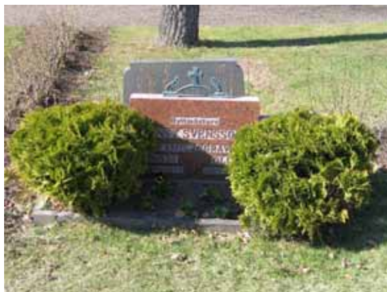
Hyttmästare är en av de titlar som förekommer på Kråksmåla nya kyrkogård. (KI Kråksmåla kyg 064)