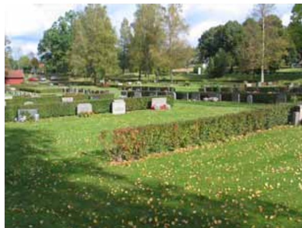
Vy över kyrkogården från sydväst. I förgrunden kvarter 1. (KI Kråksmåla kyg 005)