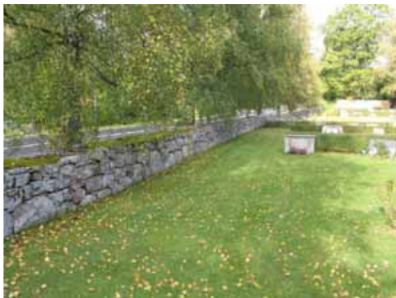
Kyrkogårdens mur i väster. (KI Kråksmåla nya kyg 004)

I norr och öster: Låg häck av liguster. I öster finns en brant slänt upp till den gamla landsvägen.