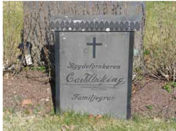
Bygdeforskaren Carl Vikings gravplats. (KI Kråksmåla kyg 078)