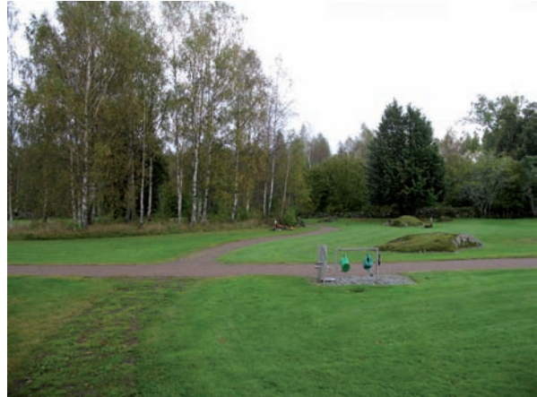
Blad 4 genomskärs av en liten gångväg.

Inom blad 4 finns att tiotal urngravar. Gravvårdarna består av naturstenar eller låga breda gravstenar i grå eller röd granit.