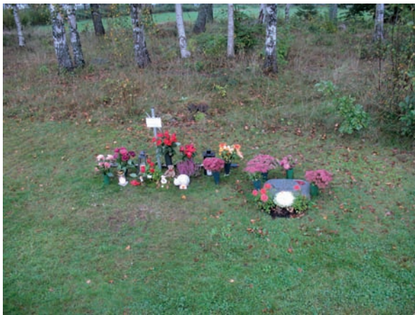
Blad 4 innehåller urngravar.