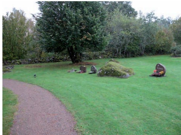
Mitt bland gravarna finns stora naturstenar.