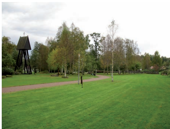
Till höger ser vi blad 2.

Det finns ännu inga gravar i detta kvarter.