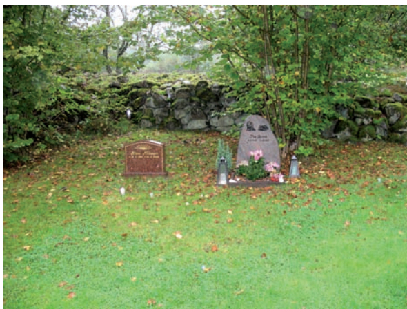
Gravstenarna har olika former.