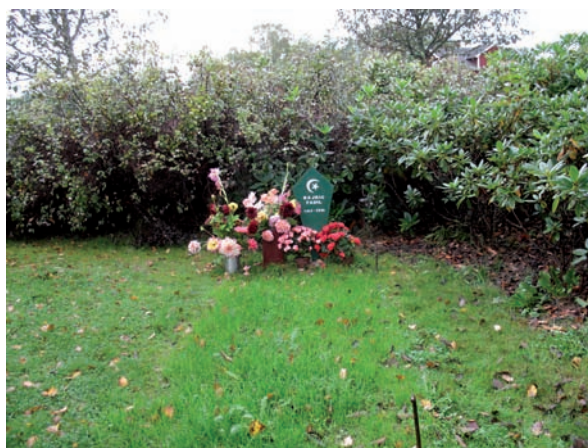
I blad 3 finns en muslimsk grav.

Endast en grav finns ännu i kvarteret. Det är en muslimsk grav och gravvården bestod år 2006 av en grönmålad träbräda. 2007 har denna ersatts av en gravsten.