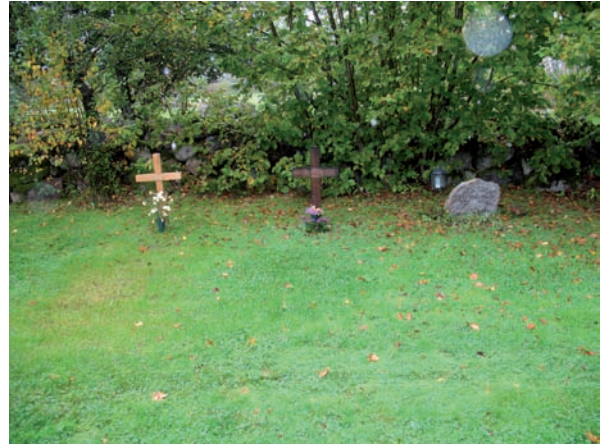
Inom blad 6 finns två träkors.