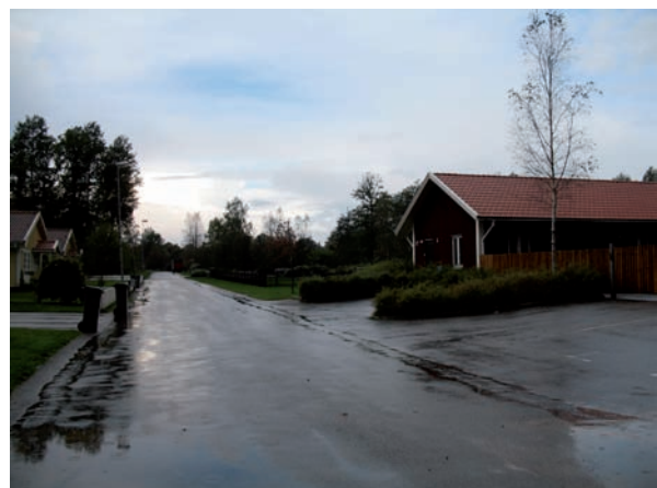
I ekonomibygnaden har vaktmästarna lokaler.