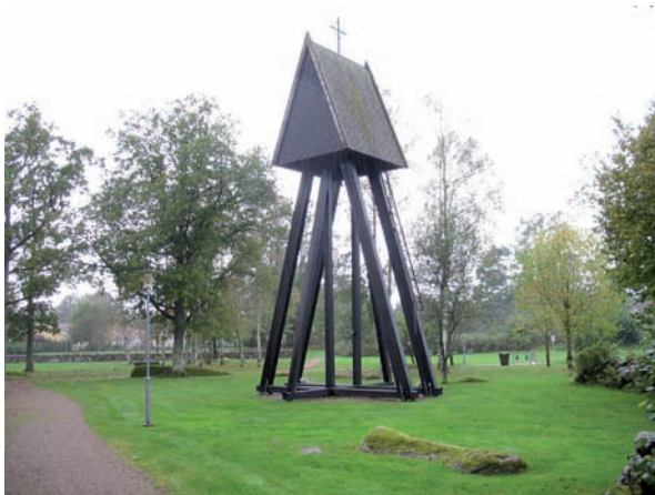
Klockstapeln är det centrala byggnadsverket på Ebbalycke begravningsplats.