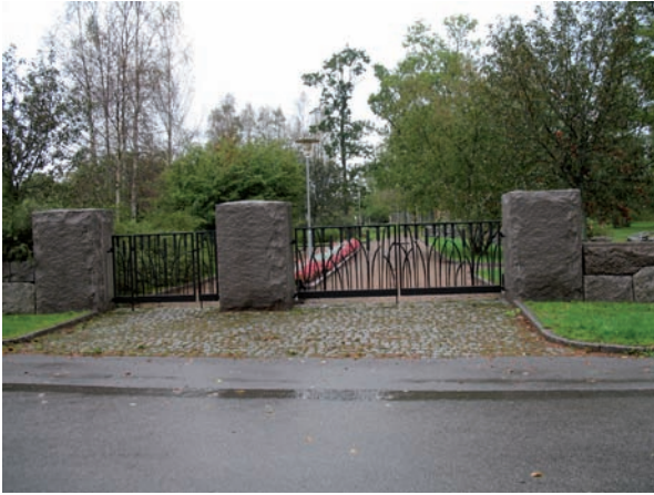
Smidesgrindarna vid huvudentrén i söder.

Bitvis är oxlar planterade innanför staketet, som en trädkrans.