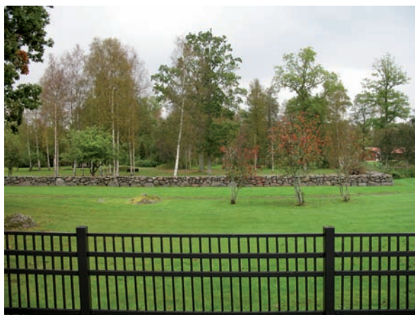
Stenmurar har anlagts för att förstärka rumskänslan inom begravningsplatsen.