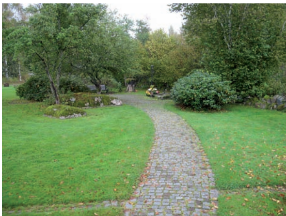
Minneslunden omgärdas av träd och buskar.

Området kring minneslunden är relativt öppet. Från den stora grusgången väster om kvarteret leder en stenlagd gång in till minneslundens centrala del. Buskar och träd omskrävar minneslunden så att en rumskänsla uppstår. Bl a finns här ett äppelträd och det har tidigare funnits en stor ek men den dog och på stubben har en urna placerats. I centrum av meditationsplatsen ligger en stor natursten med porlande vatten. Stenen har bearbetats av Staffan Lind, Ryd.