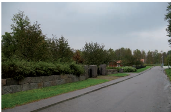
Söder om begravningsplatsen omgärdas fastigheten av en nyanlagd stenmur.