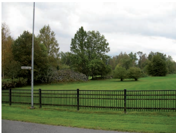
Inom Ebbalycke begravningsplats finns ett gammalt stenröse.

Till största delen består begravningsplatsen av stora öppna gräsytor. Olika landskapselement styckar upp dessa ytor och skapar rumskänsla. På begravningsplatsen finns ett gammalt röse och även de gamla träden från herrgårdens hagmark har behållits. Nya träd och buskar har planterats och nya stenmurar har anlagts för att förstärka rumskänslan inom området.