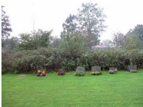
I blad 1 finns en liggande stenhäll.

Ett tiotal jordgravar finns i kvarteret. De är placerade i en nord-sydlig linje öster om buskarna och alla gravvårdar är vända mot öster. Det finns en liggande håll men de övriga gravvårdarna består av låga breda gravstenar i grå eller röd granit.