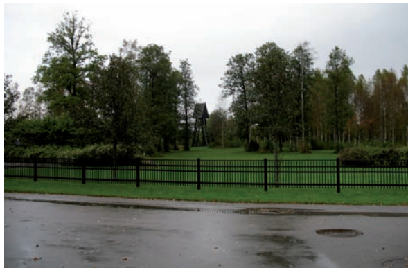
Öster om stenmuren finns ett järnstaket.