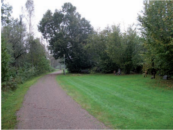
Öster om blad 6 leder en grusgång.