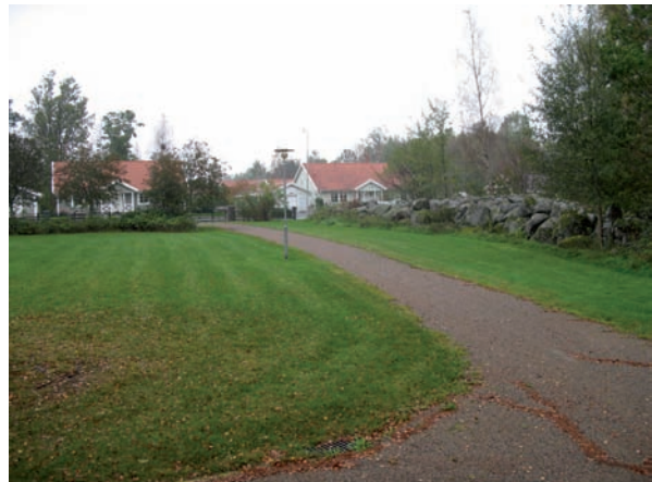
I blad 5 finns ännu inga gravar.

Det finns ännu inga gravar inom kvarteret.