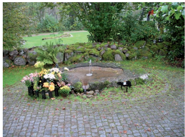
I centrum av minneslunden finns ett stenblock med porlande vatten.