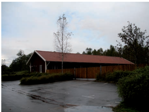
Ekonomiområdet avskämmas av ett plank.