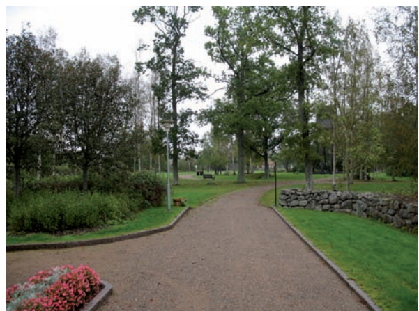
Från huvudentrén leder en bred grusgång genom begravningsplatsen till den norra entrén.