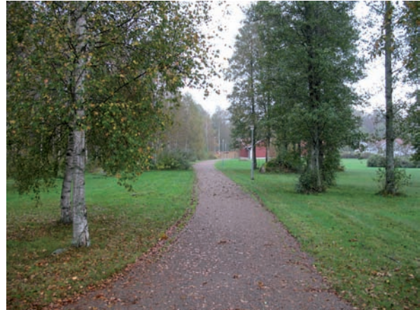
En annan grusgång leder från den norra entrén till ekonomiområdet i sydost.

I sydvästra delen finns en ekonomibygnad med lokaler för vaktmästarna.