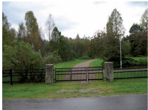
Grindarna vid den norra entrén.