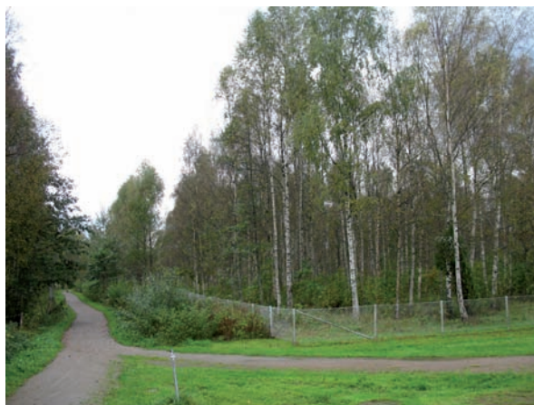
I nordost avgränsas fastigheten av ett Gunnebstängsel.