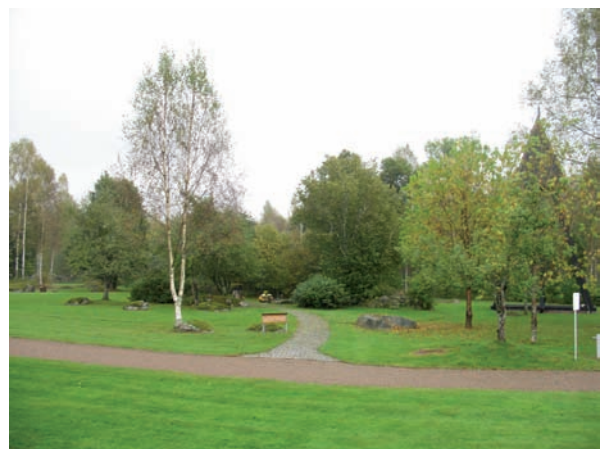
En stenlagd gång leder in till minneslunden.