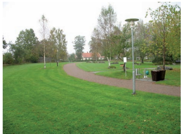
Gräsmattor, träd och buskar är viktiga inslag på Ebbalycke begravningsplats.

Mellan begravningsplatsens södra och norra entréer leder en bred grusgång. En annan grusgång leder från den norra entrén till ekonomiområdet i sydost. Denna slingrar sig genom begravningsplatsen och korsar den nord-sydliga grusgången. Mellan dessa två finns även en smalare grusgång. Lyktstolpar flankerar grusgångarna.