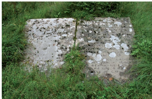
Överst: Storvuxna träd i trädkransen invid västra kyrkogårdsmuren. Nederst: Två kraftigt moss- och algbelupna gravhällar.