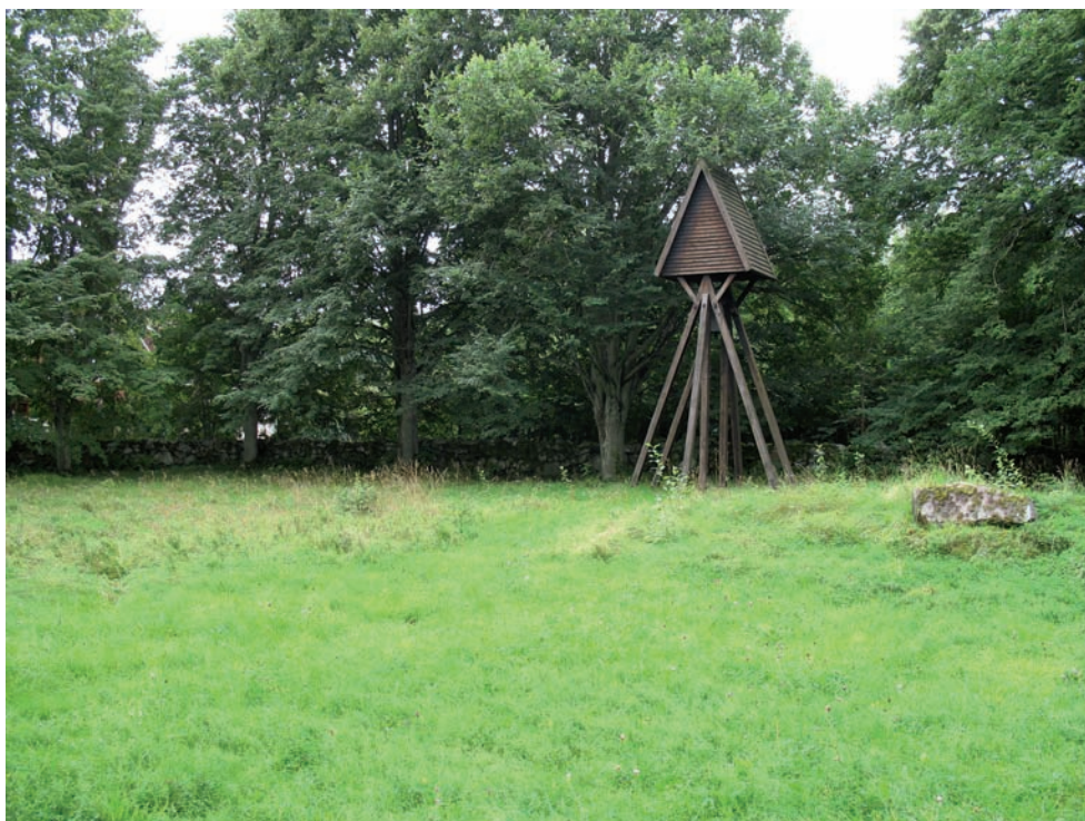
Vy över kyrkogården och klockstapeln från nordost.