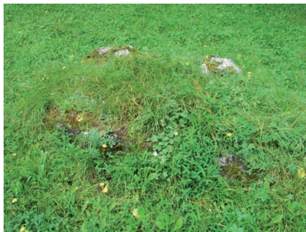
Ängsväxter på kyrkogården.

Kyrkogården har endast en ingång vilken är belägen mitt i den norra muren. Ingången är försedd