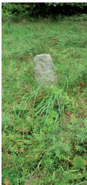
Rest natursten på kyrkogårdens södra del.