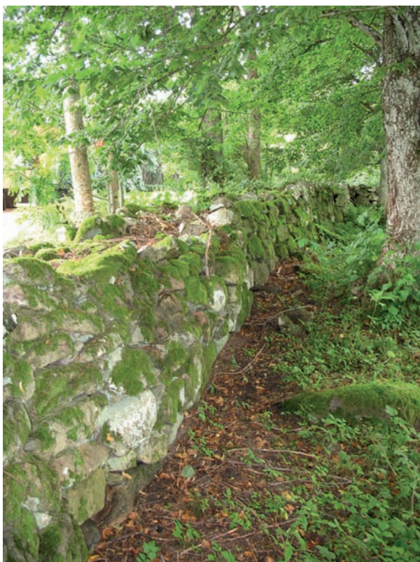
Södra kyrkogårdsmuren fotograferad från öster.