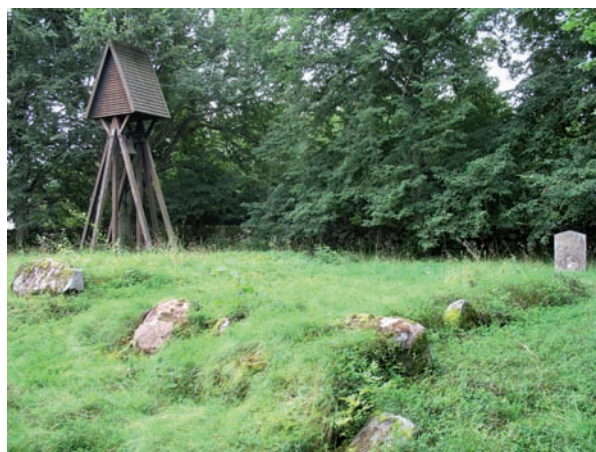
Överst: Familjen Stockes stenomramade grav. Mitten: Klockstapel av klockbockstyp. Nederst: Bevarade grundstenar från gamla kyrkans västgavel.