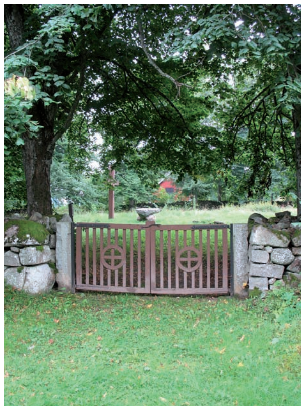
Ingången i norr med dubbla trägrindar.