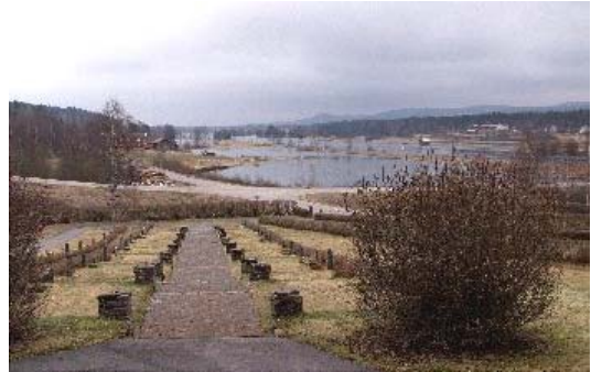
Västra kyrkogården

Karakteristiskt för kyrkotomten är de axiala alléerna som delar kyrkogården i östra och västra kvarter. Alléernas axel är anlagd i nordsydlig riktning, och ansluter dels till kyrkans södra portal och dels till sakristian på norra sidan. Alléer löper även kring kyrkotomtens yttre gränser, innanför de yttre häckarna.