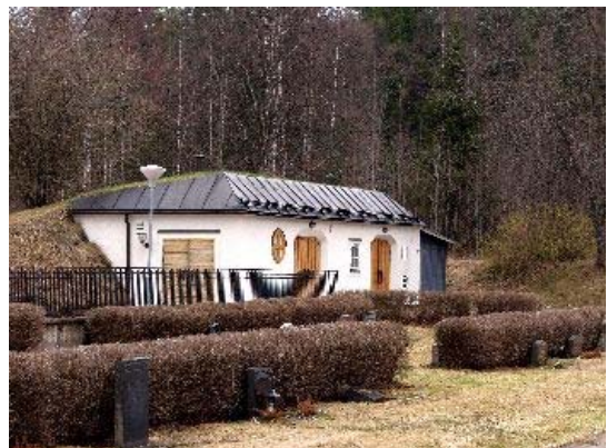
Bårhuset används numera mest som ekonomibygnad för kyrkogårdsförvaltningen.

Nordost om kyrkan, vid tomtgränsen, ligger ett bårhus med redskapsbod uppförd 1957 efter ritningar av arkitekt Tore Virke. Byggnaden är uppförd av lättbetong med vitputs, under brutet svart plåttak, som delvis täcks av torv.