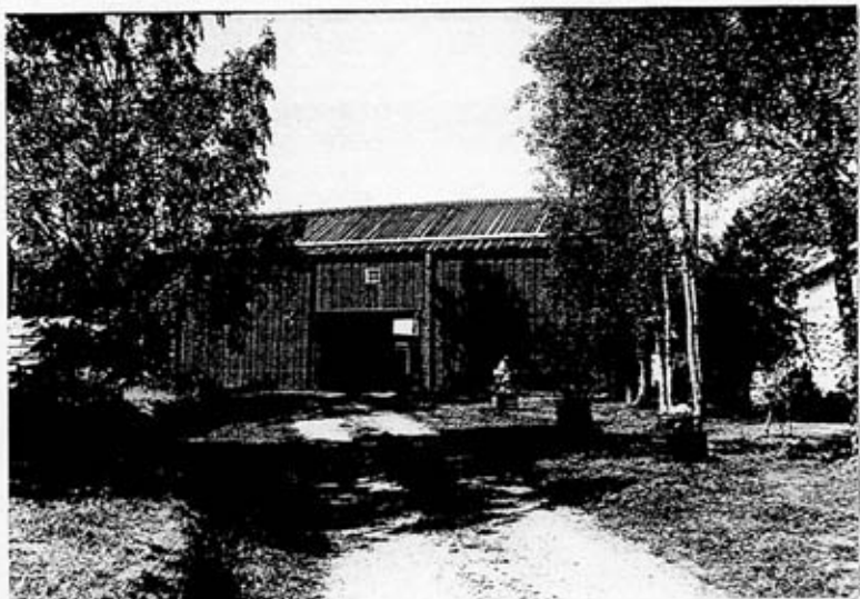
Sydfasad (K 5349:2)

Foto: Robert Mullins Tid: Augusti 1991 Filmsnr: K 5349:2-19. Förvaras i Västerbottens museum