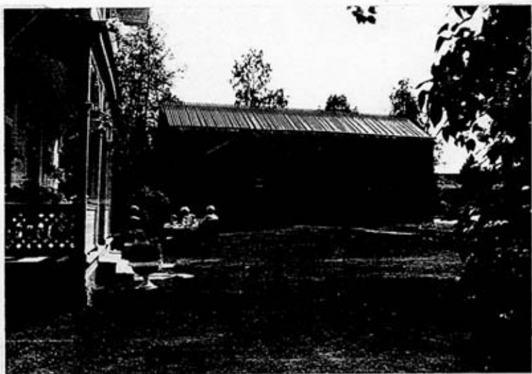
Nordfasad med boningshusets veranda (K 5349:17)