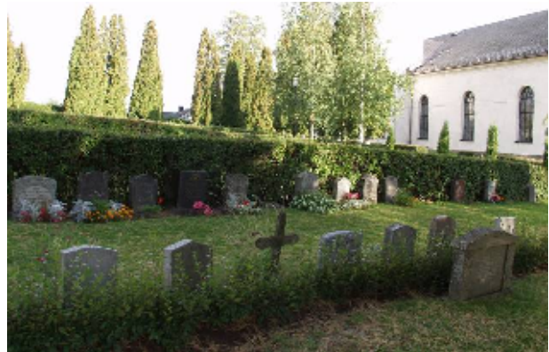
Gravkvarteren norr om kyrkan – Digitalfoto Rolf Hammarskiöld

Kyrkogården närmast runt kyrkan ligger med sin stensatta terrass upphöjd över förbipasserande väg. På södra och östra sidan har björkar planterats i rader, på den västra och norra växer höga tujor. Gravarna ligger i nord-sydliga rader, med rygghäckar, omgivna av gräsbevuxna ytor.