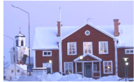
Den före detta Kyrkskolan upprustades 1995-96.

Bjursås är en stor by, utsträckt på Dössbergets västra sluttning. Orten räknar sitt ursprung till medeltida fäbodplatser, vilka under 1500-talet omvandlades till fast bebyggelse. Bjursås skildes från Gagnef och bildade egen församling 1607. Sockenkyrkan ligger på en terrasserad tomt med vidsträckt utsikt över det starkt kuperade, skogbevuxna landskapet. Nedanför kyrkan, närmare samhällets centrum, ligger den före detta kyrkskolan med ursprunglig exteriör bevarad. Prästgården ett stycke längre upp på berget bebyggdes med en modern villa 1967. Två äldre, timrade sidobyggnader finns kvar.