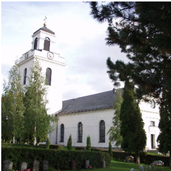
Bjursås kyrka uppfördes åren 1793-1803. Arkitekten C F Adelcrantz hade ritat ett påkostat yttre: många listdragningar och omfattningar, samt ett valmat tak med vinklar för att ge gavlarna frontoner.

Kyrkobyggnaden som uppfördes 1793-1803 har ett brett långhus med flackt valmat och skiffertäckt tak, torn utbyggt mitt på norra långsidan. Murarna består av gråsten, samt tegel och kalksten i muröppningar och avjämnande skikt. Fasaderna i nyklassicistisk stil är slätputsade, gulvitt kalkade och avdelade med en gördelgesims. Gavelpetsarna har utformats som frontoner. Mitt på södra långsidan pryder en gavelkrönt mittrisalit. Norrsidans torn har en markant konsolfris, murad lanternin med hörnpilastrar och koppartak. Fönstren är rundbågiga, med svartmålade bågar av trä och blyinfattade rutor av delvis grönfärgat antikglas. I söder, väster och i norr genom tornet finns stickbågiga portaler, stängda med dubbeldörrar av svartmålade plank. Över södra och västra ingångarna kröner entablement på konsoler, samt överljusfönster.