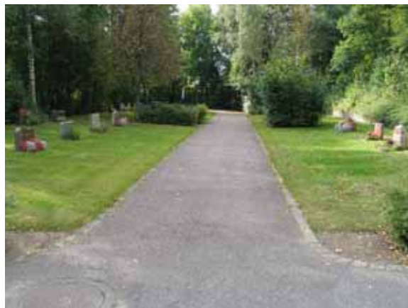
Den asfalterade gången mellan kvarter 1 och 2. Bilden är tagen mot sydväst. (KI Örsjö nya kyrkog 002)