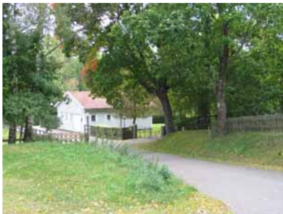
Till kyrkogården leder en asfalterad väg från församlingshemmet's parkering. (KI Örsjö nya kyrkog 001)

Runt omkring och inne på kyrkogården växer träd och buskar av olika slag. Här finns bl a tall, björk, ek, lönn, hassel, ölandstok, måbär och rosor. En låg häck av häckoxbär ramar in kvarter 6. En häck av idegran avskärmar mot vaktmästeribyggnaden i norr.