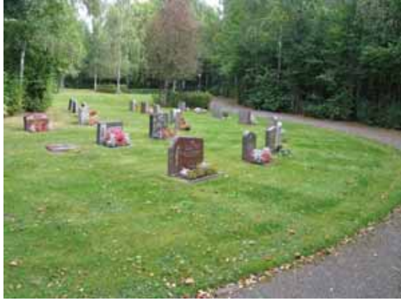
Södra delen av kyrkogården. I förgrunden kvarter 4. (KI Örsjö kyrkog 008)