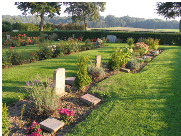
Del av den inre delen av kvarter M med ett stort antal bevarade linjegravar, varav flera barngravar samlade i en rad. (KI Söderåkra kyrkog 178)