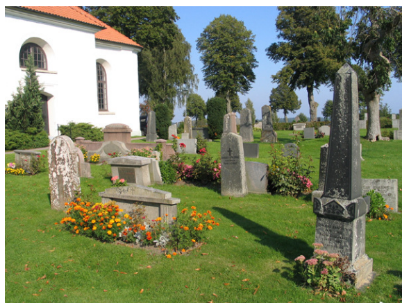
Del av kvarter C mot nordöst. (KI Söderåkra kyrkog 111)