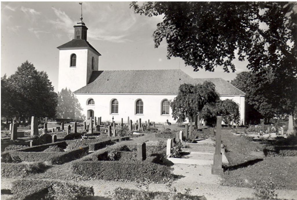
Kyrkogårdens södra sida 1952 efter uppordnandet. Notera den stora mängden höga vårdar av sten och de välklippta låga häckarna.

ordnande och plantering av kyrkogården. Till kyrkogården lades ett stort område i öster, nuvarande kvarter J, K, L, M, N, U samt halva F och H. Det nya området anlades på tidstypiskt sätt med raka rader, häckar som avgränsade ytan i mindre områden samt rygghäckar. Man skiljde tydligt på gravplatser för samhällets olika sociala skikt. På en ritning från tiden visas att familjegravar skulle placeras längs flera av kvarterens ytterkanter med täta rader av linjegravar i kvarterens mitt. I den nya kyrkogårdens centrum skulle en oval ceremoniplats anordnas med sk hedersplatser intill. I stora drag genomfördes förslaget med grusade familjegravplatser och linjegravar i gräsmatta. Ceremoniplatsen verkar dock aldrig ha ställts i ordning. Vid områdets östra gräns byggdes mur och planterades lindar. Marken som togs i anspråk vid 1920-talets utvidgning köptes från Kollinge gård. Hela området ska ha djupgrävts för hand.