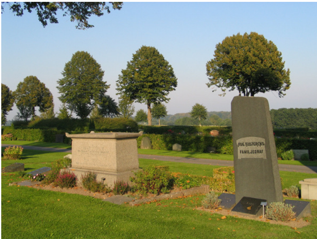
Ett parti av kvarter I. Kistan av ljus granit – en ovalig gravvård- tillhör stadsrådet Alfred Pettersson från Påboda, d 1920. Notera att det finns liggande, senare tillkomna vårdar, vid båda gravplatserna som syns i bild. (KI Söderåkra kyrkog 159)