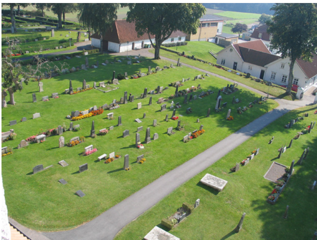
Kvarter B och C mot söder – det område på kyrkogården som inrymmer de gamla gårdsvisa gravplanerna. (KI Söderåkra kyrkog 092)

Området består mestadels av familjegravar som hör till socknens större gårdar. Det finns dock även andra familjegravar. I kvarter B finns en yta längst i norr som reserverats för prästernas gravar. De gårdsuppdelade gravplatserna finns i kvarter B samt främst i den västra delen av kvarter C. Vilka platser som hör till samma gård kan oftast utläsas genom att gårdens namn finns angivet på vårderna.