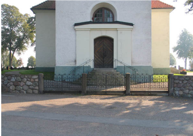
Ingång till kyrkogården i väster med tre pargrindar. (KI Söderåkra kyrkog 042)

Mot norr: Ingång från Ekbacken till kyrkogården via pargrind med smidda detaljer på grindar som i övrigt består av järnrör, allt målat i svart. Portstolpar av granit.