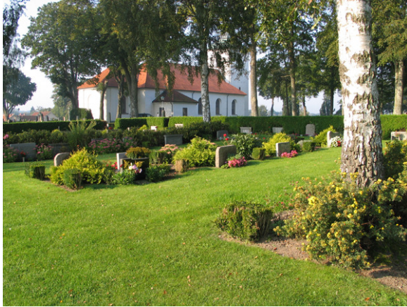
Del av området som tillkom genom utvidgning på 1960-talet. (KI Söderåkra kyrkog 117)