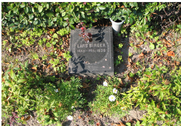
En av de typiska små linjegravvårdarna, här över den lille pojken Lars Birger som föddes och avled hösten 1936. (KI Söderåkra kyrkog 071)