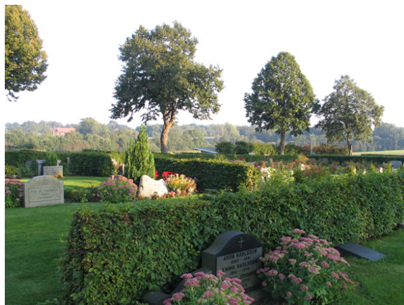
Ett parti av området med familjegravvårdar mot rygghäckar. Notera trädraden i bakgrunden, en del av trädkransen. (KI Söderåkra kyrkog 173)

Området utgör en stor rektangulär yta öster om den äldre kyrkogården. Mot öster och söder finns muren som omgärdar kyrkogården och i öster även lindar som ingår i trädkransen. I utkanten av området, mot öster, väster och norr, löper en asfalterad gång. Ett par korta gångar är lagda med kalkstensplattor i gräsmattan. I det sydöstra hörnet finns ett urngravsområde i ett nedsänkt parti omgivet av en kalkstensmur. I området mitt finns sedan 1990-talet en minneslund i vad som tidigare var en ceremoniplats. I kvarter L, N och O finns familjegravplatser eller köpta gravplatser. Kvarteren K och M är organiserade med familjegravar eller köpta gravplatser längs med gångarna i kvarterens ytterkanter och med flera rader av linjegravar i kvarterens inre. I kvarteren finns rygghäckar av oxbär och avenbok samt i linjegravsområdet planteringar av rosor och andra perenna växter. I kvarter O finns små korta häckar av buxbom mellan gravplatserna.