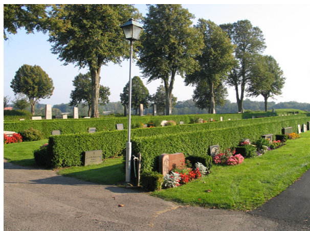
Översikt över kvarter G med vårdar längs tujahäck. Notera trädraderna i bakgrunden, den första som utgör del av den gamla trädkransen och den bakre som utgör en del av den nuvarande. (KI Söderåkra kyrkog 143)

Kvarter G ligger sydost om kyrkan och tillkom i samband med utvidgningen 1901. Strukturen liknar den i kvarter A, med familjegravar längs kvarterets ytterkanter och längs gångar samt ett något uppluckrat linjegravsområde i mitten. Linjegravarna är placerade längs rygghäckar av tuja.