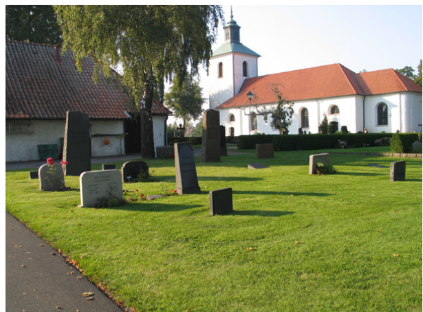
Kvarter I med oreglebundet placerade vårdar av olika typer, i gräsmatta. (KI Söderåkra kyrkog 158)

På vårdarna finns i många fall information om den dödes yrkestitel. Vanligt är titlar med anknytning till det kustnära läget såsom, sjökapten, sjöman, mästrelots, generallotsdirektör och tullinspektör. Andra som förekommer bl a hemmansägare, lantbrukare, lärarinna, möbelsnickare och apotekare. By- eller gårdnamn anges på många vårdar.