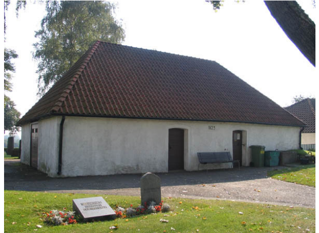
Bårhuset uppförts 1832. (KI Söderåkra kyrkog 051)