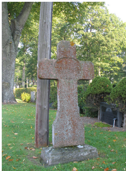
Kors av kalksten, rest över tullinspektör C A Appert 1862. En av kyrkogårdens äldsta vårdar. (KI Söderåkra kyrkog 070)