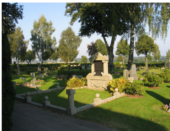
Del av kv F öster om kyrkans kor. Här syns framförallt den monumentala platsen i klassicistisk stil över familjen J Wideberg från 1920-talet. (KI Söderåkra kyrkog 131)