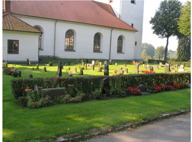
Kv A mot sydväst. Familjegravar av olika typer längs med rygghäcken. (KI Söderåkra kyrkog 057)