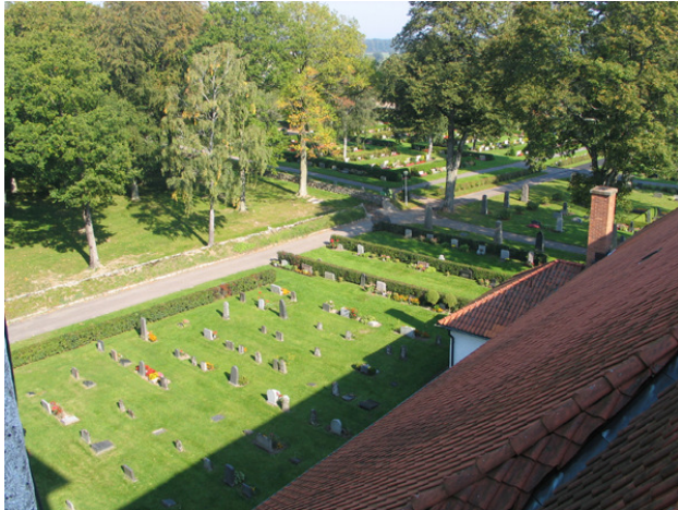
Kv A mot nordost. Strukturen är här synlig. I mitten syns delar av ett äldre linjegravsområde i gräsmattan. I kanterna och i den östra och västra delen finns familjegravar mot rygghäcken. (KI Söderåkra kyrkog 093)