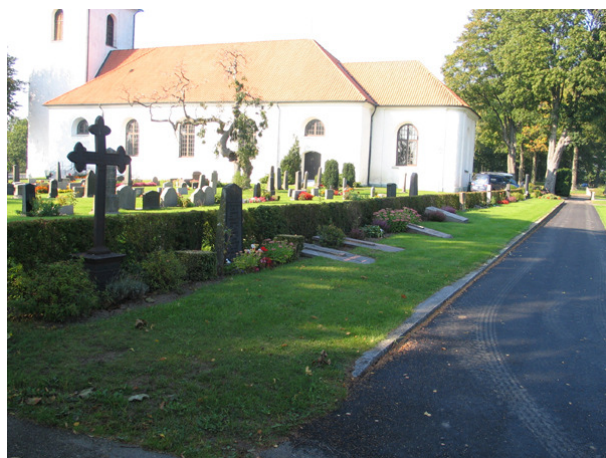
Kv E mot norr – ett litet kvarter med vårdar placerade längs med berberishäck. Här finns en del liggande större vårdar från 1900-talets mitt samt enstaka äldre vårdar. (KI Söderåkra kyrkog 124)

Kvarteren, som ligger öster om kyrkan och kvarter C samt söder om kvarter C, har olika tillkomsthistorier. Kvarter D och E samt möjligen delar av kvarter F hörde till kyrkogården redan på 1800-talet. Vissa delar av kvarter F, H, I och J (samt G, se beskrivning nedan) tillkom genom utvidgning 1901 medan ytterligare en liten del i öster tillkom på 1920-talet. Kyrkogårdens gräns före 1920-talets utvidgning är ännu synlig genom att en rad ståtliga lindar är placerade där. Samtliga kvarter används mestadels för familjegravar. Kvarter F, öster om kyrkans kor, skiljer ut sig då det innehåller flera mycket påkostade gravplatser med stora gravvårdar. Strukturen är här lite oordnad och där finns olika typer av vegetation, bl a tuja, rhododendron och björk. I kvarter E finns också ett mindre antal äldre, höga vårdar liksom enstaka exempel i kvarter H och I. Vårdarna är i vissa fall placerade längs med rygghäckar, i andra fall lite mer oregelbundet placerade utan ordnad vegetation. Rygghäckarna som förekommer är av tuja och berberis. I något fall är rosor placerade som ”häck”, mellan raderna av vårdar. Det finns i området en stor variationsrikedom vad gäller vårdarnas utseende. Samtliga gravplatser är gräsbesädda.