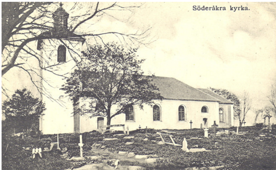
Kyrkogårdens södra sida någon gång vid 1900-talets början. Stora delar av marken täcks av murgröna. Vårdarna är relativt få.

den nya kyrkogårdsgränsen i norr, och sannolikt byggdes också en mur. Träden står än idag kvar och markerar kyrkogårdens utsträckning anno 1901. Vid utvidgningen 1901 (eller möjligen vid 1928 års utvidgning) fann man resterna efter vad som beskrivits som ett gilleshus och ett fattighus i den gamla kyrkogårdens sydöstra hörn.