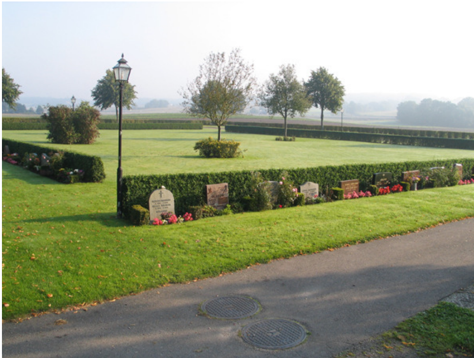
Nya kyrkogården mot sydost. (KI Söderåkra kyrkog 007)

Områdes struktur liksom gravvårdarnas utseende är tidstypiska för slutet av 1900-talet. De strikta raderna av vårdar mjukas upp av vegetationen. En utveckling mot mer individualiserad syn på gravvårdarnas utformning kan skönjas, vilket är typiskt för 1900-talets slut.