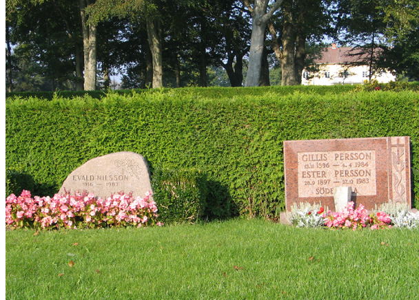
Två vårdar från 1980-talet. (KI Söderåkra kyrkog 020)