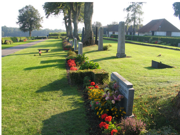
Den östligaste delen av kv H mot söder. Trädraden mitt i bild markerar kyrkogårdens gräns före 1920-talets utvidgning. (KI Söderåkra kyrkog 151)