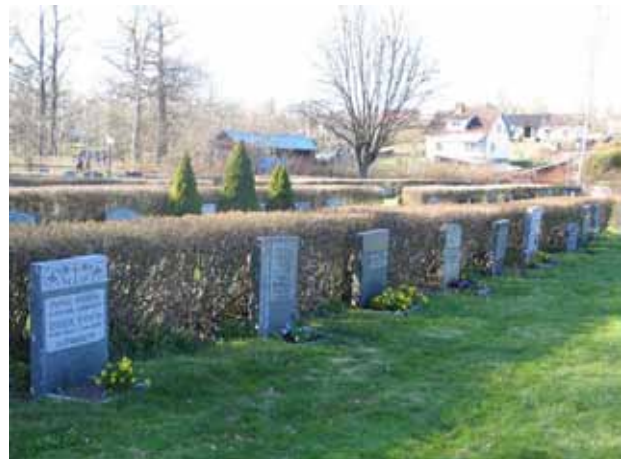
Kv. F KI Kristdala 0281