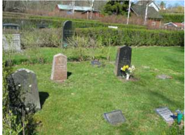
Området med barngravar i norra delen av kv. B. (KI Kristdala 0243)