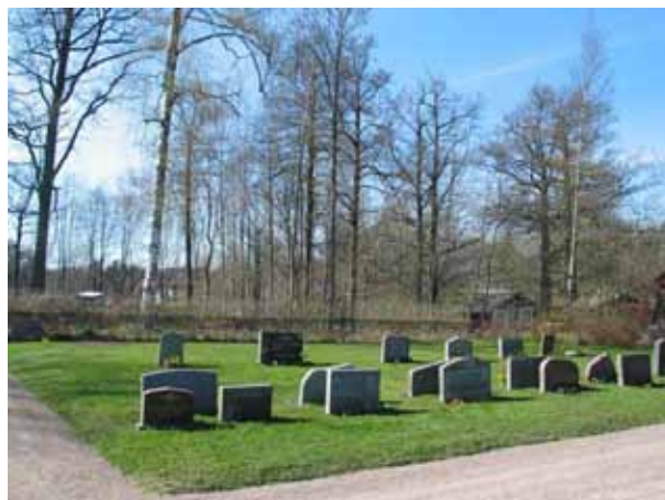
Kv. H mot väster. (KI Kristdala 0225)