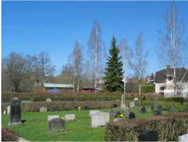
Kv. B mot nordväst. (KI Kristdala 0245)