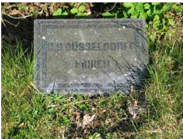
Kv. B, vårdan över den lokalthistoriskt kände "Düsseldorfaren".