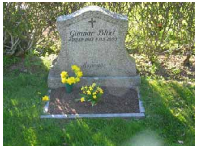
Kv. B, vård förfärdigad efter modell av lokal stenhuggare vid namn Walfred Ottosson. (KI Kristdala 0195)