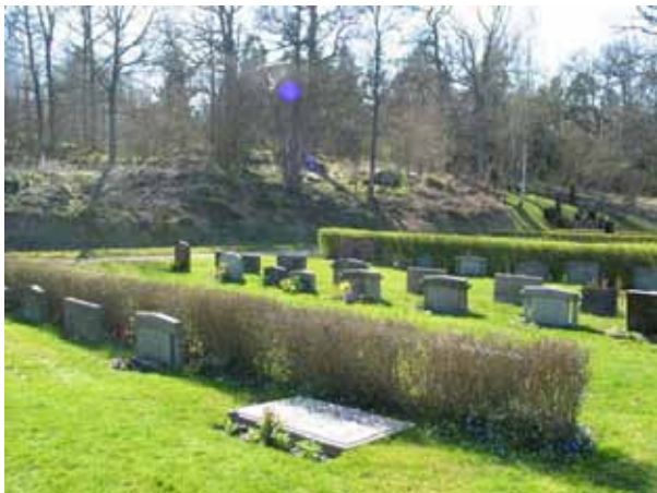
Kv D KI Kristdala 0233

Kvarteren anlades i samband med kyrkogårdsutvidningen 1956-57 som också sammanföll med kapellets uppförande. Tillsammans rymmer kvarteren omkring 500 gravplatser. Området är planlagt enligt klassicistiska principer med rätvinkliga gångar i öst-västlig respektive nord-sydlig riktning, regelbundna kvarter och rygghäckar. Ursprungligen var delar av eller hela området belagt med grus, men isåning med gräs utfördes på 1960-talet. Några av grusgångarna mellan och inne i kvarteren har genom åren såtts igen. På gravkartan från 1957 finns markeringar för större gravplatser längs mittgången mellan kvarter E och F med vårdar vända mot gången och bakomliggande rygghäckar. Det är oklart om detta utfördes. I kvarter D planerades gravplatser längs med gången längst i sydost. Dessa blev aldrig verklighet. Kvarter D ligger söder om kvarter C, medan E och F ligger på var sida mittgången i väster. Kvarteren består av norr-söder löpande rader med gravvårdar växelvis vända mot öster och väster. Med något undantag står vårdarna mot rygghäckar. Häckmaterialet består av häckoxbär, liguster och måbär.