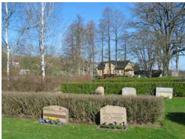
Kv. J och K mot öster. (KI Kristdala 0221)

Kvarteren har inga specifika kulturhistoriska värden förutom sådana som omfattar alla delar av en kyrkogård och dess gravvårdar. Kvarter J och K har i planläggning anpassats till de intilliggande B och F. Kvarter H är en representant för det sena 1900-talets stil.