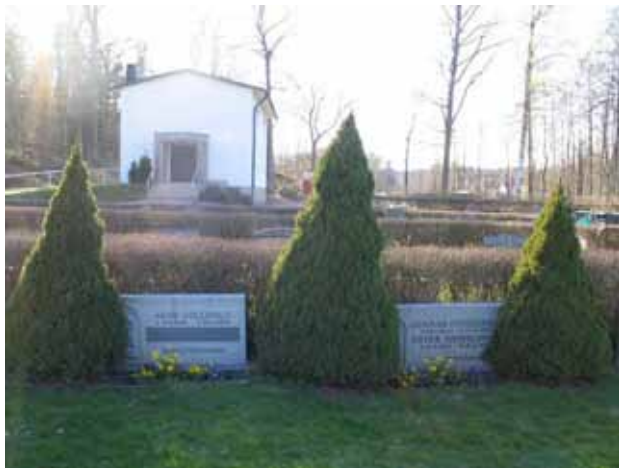
Kv. E KI (Kristdala 0279)

70-tal med enstaka senare vårdar, och är bitvis samlade i grupper av samma typ. Endast på några få vårdar förekommer titel exempelvis lägenhetsägaren, f.d mjölnaren , lassarettsläkaren, kyrkoherden och lantbrukaren. På många av vårdarna anges ortnamn. En vård skiljer ut sig, nämligen kyrkoherde Sven Jivegårds kors av ljusröd granit.