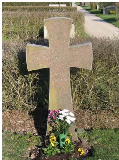
Kv. F, vårdan över kyrkoherde Sven Jivegård som var mycket aktiv i omdaning av kyrkogården under 1950-70-talen. (KI Kristdala 0273)