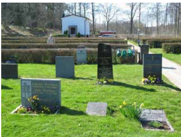
Kv. C mot sydväst. (KI Kristdala 0237)

Blandad gravvårdskaraktär. Ett 10-tal äldre vårdar (1900-talets första decennier) varav några tydligt sticker upp ovan de ca 70 cm höga rygghäckarna. Många medelbreda och medelhöga stående vårdar. Grå och svart granit dominerar, men även röd granit förekommer. Relativt många mindre vårdar, speciellt bland linjegravarna, flera av dem liggande eller halvliggande. Linjegravarna dateras till främst till 1940-50-tal. Gravvårdar från 1910-tal och fram till 2003, med dominans för 1900-talets senare hälft. Många vårdar med klassicerande stildrag. Titlar som förekommer är hemmansägaren (ett flertal) och den långa titeln Föreståndaren för Kungl. Kalmar reg. Bageri (1923). Ortnamn är vanligt förekommande på gravvårdarna.