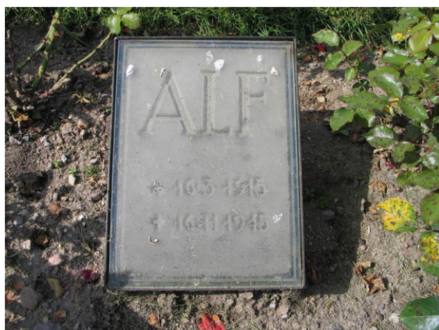
Närheten till flera glasbruk märks på kyrkogården. Här en av de tre gravvårdarna i form av en graverad glasskiva på en lutande ställning av smide. Denna vård återfinns i kvarter B. (KI Hälleberga kyrkog 094)