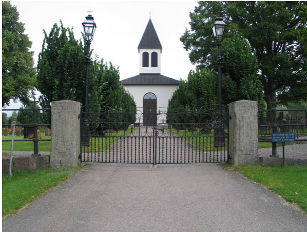
Ingång till kyrkogården i söder. (KI Hälleberga kyrkog 059)

I öster: Enkel, svartmålad smidesgrind och granitstolpar. Trappa som leder upp till kyrkans södra ingång. Stegen av granit och avsatserna belagda med kalkstensplattor. Svartmålat smidesräcke.