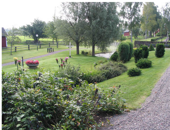
Minneslundan från norr. (KI Hälleberga kyrkog 070)