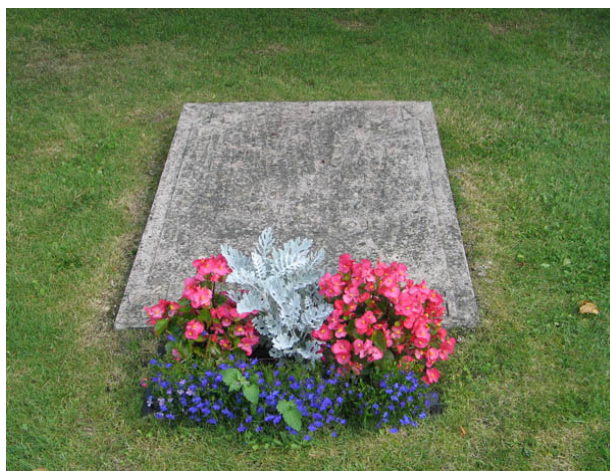
Gravvård över glaskonstnären Simon Gate. (KI Hälleberga kyrkog 084)