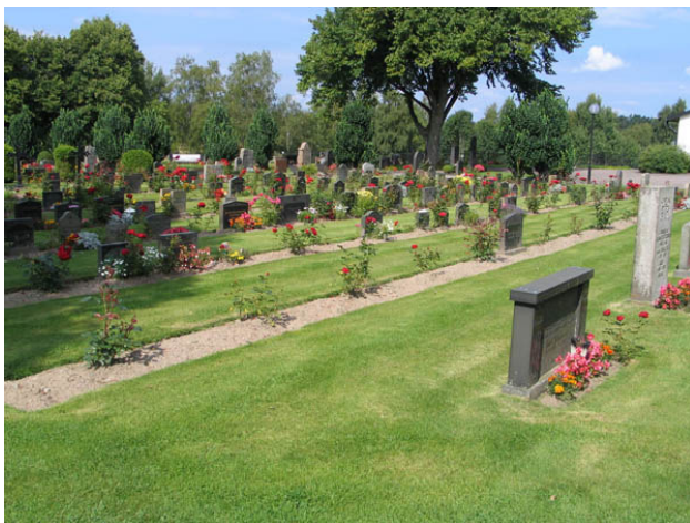
Linjegravsområde i kvarter B från sydost. (KI Hälleberga kyrkog 095)

De fyra kvartererna är placerade i kyrkogårdens sydvästra hörn. Samtliga kvarter rymmer eller har rymt kyrkogårdens linjegravsområden. Kvarter B, C och D har alla tre varit utformade med köpta gravplatser i kvarterens ytterkanter och linjegravsområden i mitten. I kvarter C kan man idag bara ana resterna av denna struktur medan den i kvarter B och D ännu är klart utläsbar. Ett mindre antal köpta gravplatser mitt i västra delen av kvarter B bryter mönstret i detta kvarter. Kvarter E saknar ramen av köpta gravplatser. Här har istället iordningställt ett antal köpta gravplatser i västra delen av kvarteret. Kronologiskt går det att följa linjen från spridda rester i kvarter C, vidare till kvarter D, B, och slutligen E. Bland köpta gravplatserna i de tre äldre kvartererna finns rester av omgärdningar och grusbeläggningar kvar som berättar om kvarterets historia.