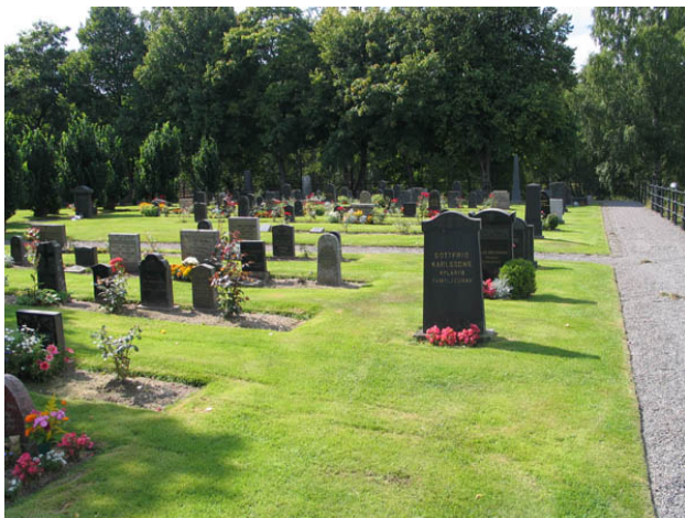
Köpta gravplatser i kvarterets ytterkant och innanför dessa linjegravsområde. Kvarter D från nordost. (KI Hälleberga kyrkog 098)