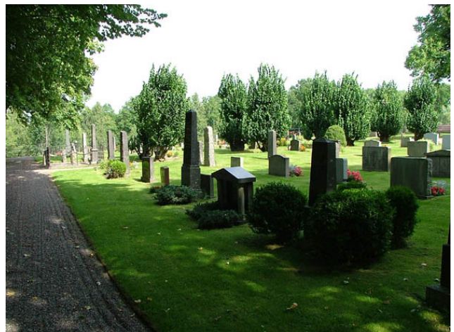
Gravvårdar på köpta gravplatser. Kvarter C från sydväst. (KI Hälleberga kyrkog 008)

Linjegravvårdarna i kvarter B, D och E är placerade i rader med öppen jord. Mellan gravvårdarna har röda rosor planterats. Majoriteten av gravvårdarna är vända mot öster. Ett mindre antal gravvårdar har vänts mot väster p.g.a. gångsystemet. Mellan kvarter B och C på ena sida och kvarter D på den andra går en av de gångar som markeras av knuthamlade almar. I kvarter D står en stor lind.