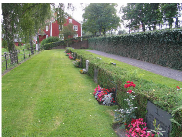
Kvarter L från norr. (KI Hälleberga kyrkog 110)