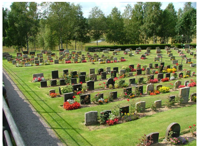
Linjegravsområdet i kvarter E från sydost. (KI Hälleberga kyrkog 023)