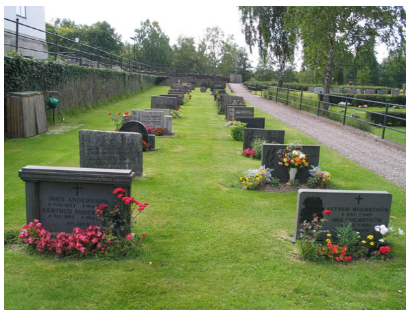
Kvarter I från öster. (KI Hälleberga kyrkog 108)