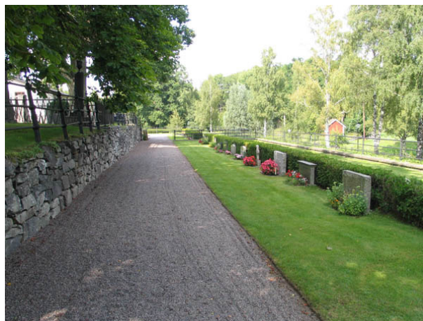
Kvarter H från söder. (KI Hälleberga kyrkog 106)