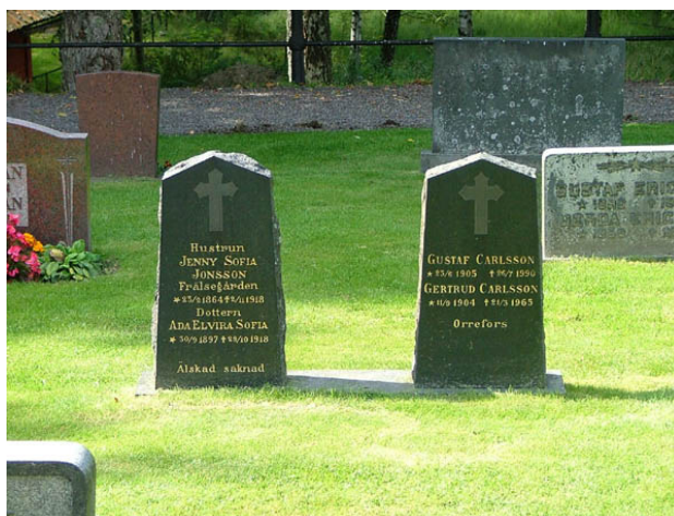
Gravvårdar i kvarter C. Den västra stenen har rest över mor och dotter som troligen dog i spanska sjukan 1918 med några få dagars mellanrum. Den gravvården utgör idag en rest av linjegravsområdet i kvarter C. (KI Hälleberga kyrkog 010)