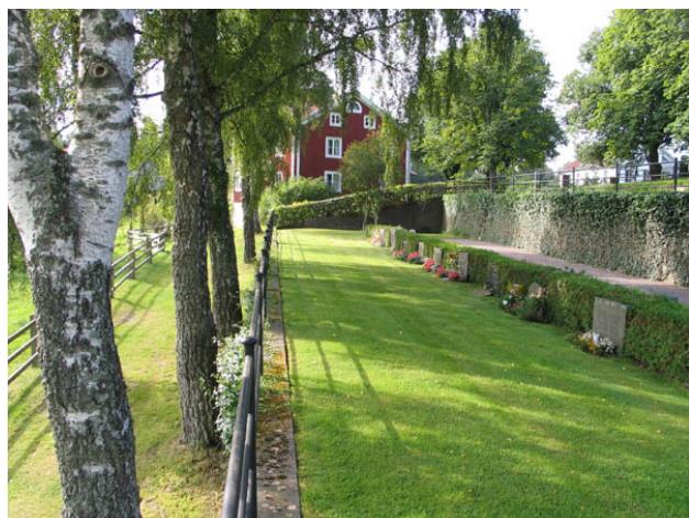
Kyrkogårdens gräns i öster. ( KI Hälleberga kyrkog 074)

antiken. Det kan t.ex. handla om symmetriskt uppställda vårdar med kolonner eller pilastrar. Denna typ av gravvårdar var vanlig på 1930- och 40-talen. Dekor i form av lagerkransar och urnor hör också till typiska klassicistiska stildrag. Ett mindre antal av dessa gravplatser är belagda med grus och försedda med omgärdningar. På de nya delarna av kyrkogården dominerar låga, rektangulära gravvårdar som varit vanliga sedan 1930-talet. Urngravsområdet i kvarter violen utmärker sig. Här finns endast liggande gravvårdar och flera av dem är av natursten.