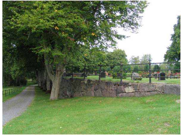
Stödmur, gjutjärnsstaket och trädkrans i söder. (KI Hälleberga kyrkog 060)