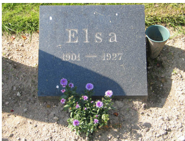
Linjegravvård i kvarter D. På flera gravvårdar anges endast förnamn och årtal eller den dödes ålder. (KI Hälleberga kyrkog 102)