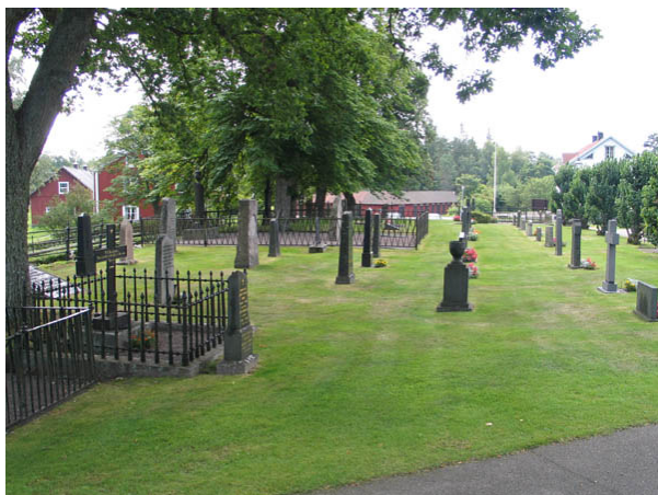
Kvarter A från norr. (KI Hälleberga kyrkog 079)