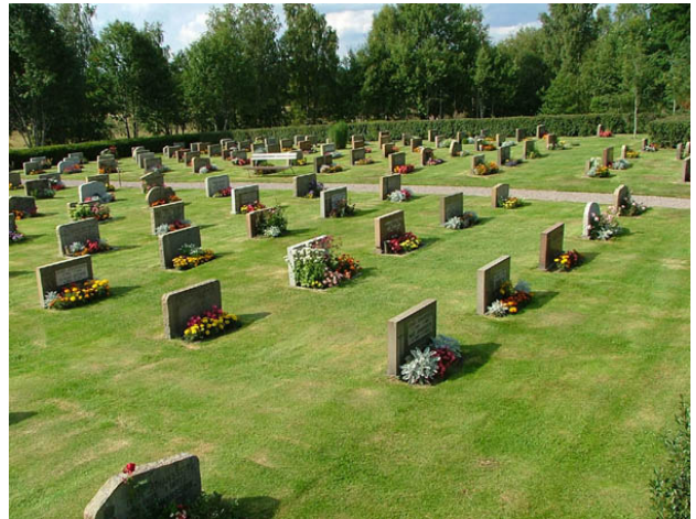
Kvarteren konvaljen och blåsippan från sydost. (KI Hälleberga kyrkog 029)