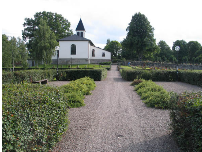
Grusgången som delar blomsterkvarteren i en östlig och en västlig del. (KI Hälleberga kyrkog 117)