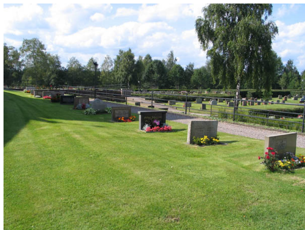
Kvarter F från öster. (KI Hälleberga kyrkog 104)

Kvarteren tillhör de områden som tillfördes kyrkogården i samband med utvidgningen på 1940-talet. De är anlagda på långsmala terrasser som stöds av murar av cement. Antalet gravplatser är begränsat. Det största kvarteret är kvarter I som rymmer 72 gravplatser. Kvarter F och I är belägna norr om kyrkan och övriga fyra öster om kyrkan. I kvarter F och I är samtliga gravvårdar vända mot öster. De övriga kvarteren har ryggställda gravvårdar vända mot öster eller väster. Mellan raderna av gravvårdar är häckar av tuja planterade. Från kyrkans östra sida leder en trappa i flera avsatser ner till kyrkogården östra gräns. Utmed varje kvarter finns en grusad gång. Vid stödmurarna av cement är murgröna planterad. I södra delen av kvarter L finns en mindre oxelhäck i kyrkogårdens omgärdning och i södra delen av kvarter H står två träd av sorten benved.