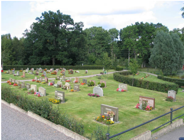
Kvarteren violen och blålockan från sydväst. Till höger i bilden syns urlunden. (KI Hälleberga kyrkog 115)

glasmålare, gravvör. Utöver dessa finns titeln kyrkoherde i kvarteret blåsippan. Den dödes hemort anges på majoriteten av gravvårdarna.