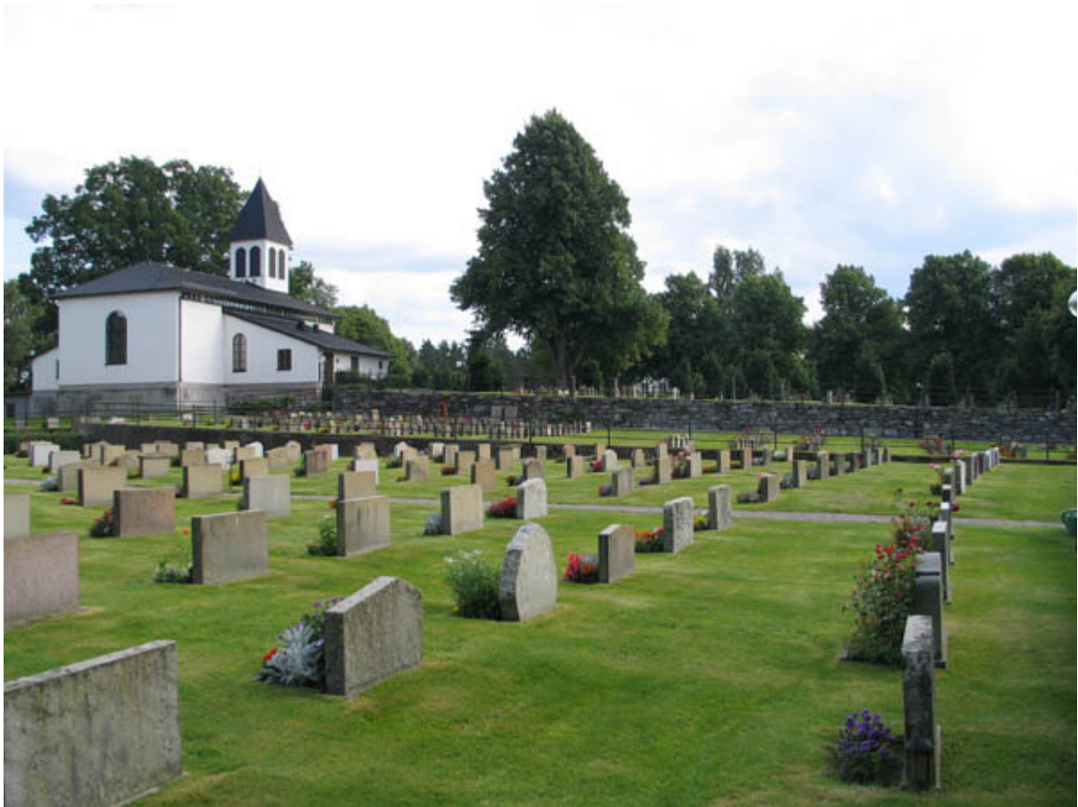
KI Hälleberga kyrkog 119

Kulturhistorisk inventering av kyrkogårdar/ begravningsplatser i Växjö stift 2005