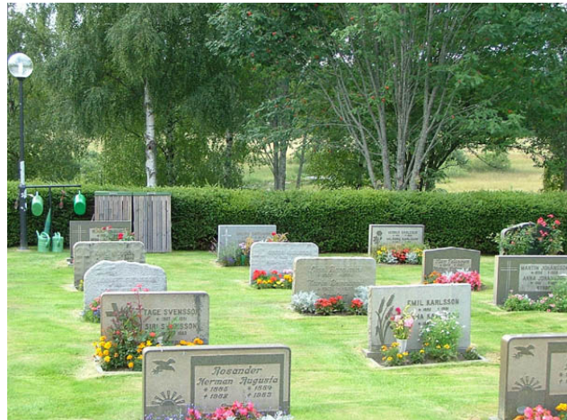
Låga, rektangulära gravvårdar i kvarteret blåsippan. Bakom träden kan man ana Maden som breder ut sig nedanför kyrkogården i anslutning till Vapenbäckån. (KI Hälleberga kyrkog 049)