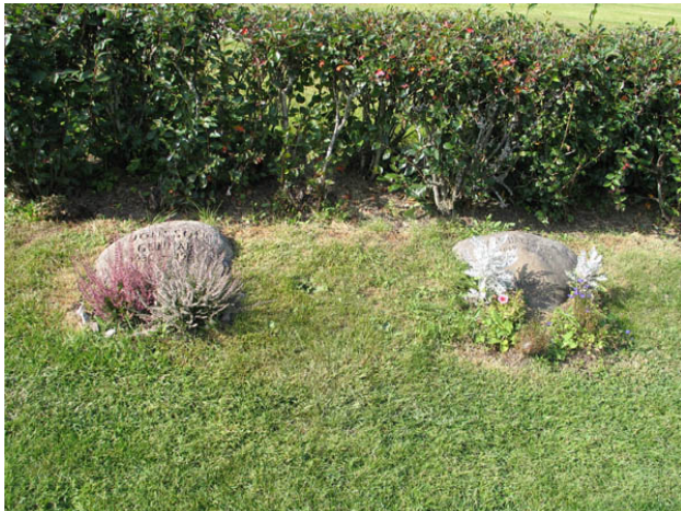
Gravvårdar i urlunden, kvarteret violen. (KI Hälleberga kyrkog 114)