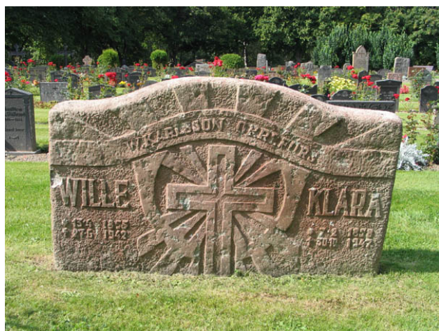
Gravvård av kalksten i kvarter B. (KI Hälleberga kyrkog 096)

I de västra delarna av kvarter C ska flera av de sockenbor som avled i spanska sjukan ha begravts. Flertalet av dessa stenar har tagits bort men enstaka finns kvar. Gravvårdar från denna tid kan också återfinnas bland köpegravarna i västra delen av kvarter D.