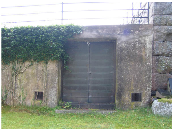
Bisättningskällare i gränsen mellan den gamla stödmuren av kanthuggen natursten och den nya stödmuren av cement. (KI Hälleberga kyrkog 064)