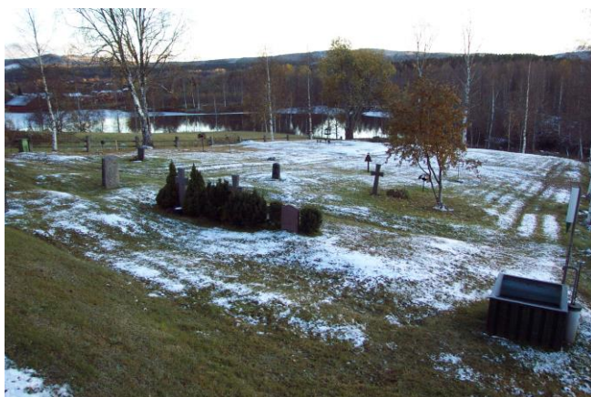
Utsikt över kyrkogården invid Bunges kapell och det omgivande landskapet.

Kyrkogården invid Bunges kapell är äldst och kom troligtvis till i samband med att kapellet byggdes i slutet av 1700-talet. På 1850-talet fyllde man, p.g.a. luktproblem, upp kyrkogården med grus. Uppfyllnaden syns tydligt genom att kyrkogården höjer sig över omgivande mark. 1991 anlades här en minneslund med smyckningsyta i ett av de äldre kvarteren. Till formen är kyrkogården rektangulär och ligger i slutningen väster om Bunges kapell. Den omges av ett staket med granitstolpar och en trädkrans av björk. Den branta slänten precis väster om Bunges kapell är terrasserad efter de individuella gravarna. Väster om denna ligger ett plant område med flack lutning, vagt indelat med en numera helt gräsbevuxen korsgång. Mycket karakteristiskt för kyrkogården är gravvårdarna av järn i speciella former och ett par smidda järnstaket från 1800-talet.