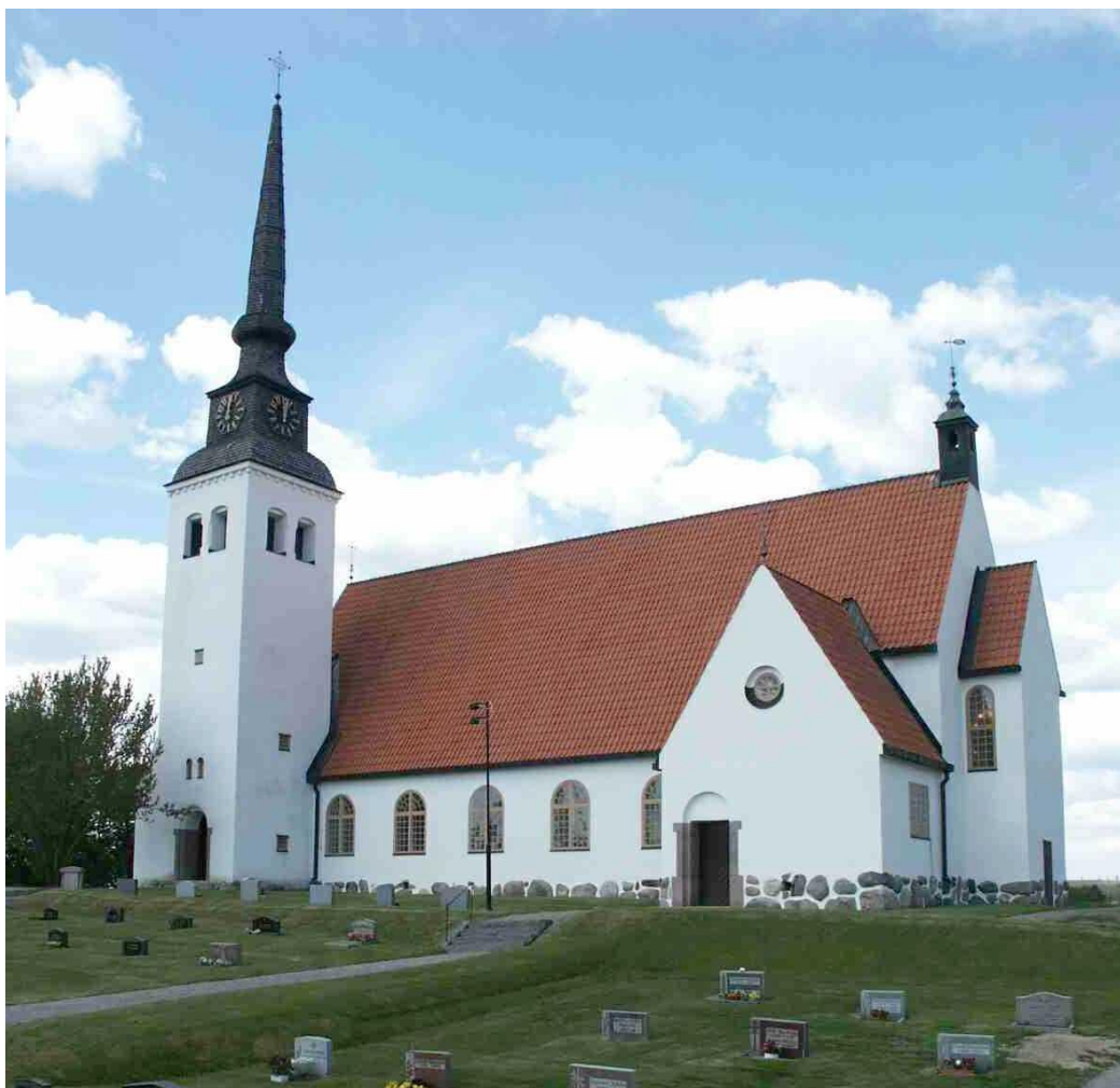
Åmots kyrka från söder. Foto: Henrik Lindblad, Länsmuseet Gävleborg 2002.