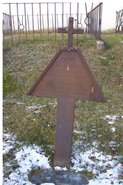
Bruksbokhandlarens gravvård från 1836 är ett typexempel på de speciella järngravvårdar som pryder kyrkogården.

Skogskyrkogården kom till på 1870-talet och ligger i tallskogen strax utanför samhället 3 km sydväst om kyrkan. Dess karaktär är mycket säregen och starkt präglad av sandgravkvarteren med mönsterkrattade sandgravkullar och den omgivande tallskogen. Kyrkogården har en kvadratisk planform och avgränsas av ett nätstaket med granitstolpar samt en trädkrans av björk. Den är uppdelad i två nästan lika stora delar av en mittgång som leder mellan klockstapeln i västra entrén och bårhuset på motsatt sida av kyrkogården. Mittaxeln förstärks av en decimerad björkrad längs med gången. En korsande mittgång delar upp kyrkogården i fyra kvarter, varav två fortfarande är helt sandbelagda medan två är mer igenvuxna med