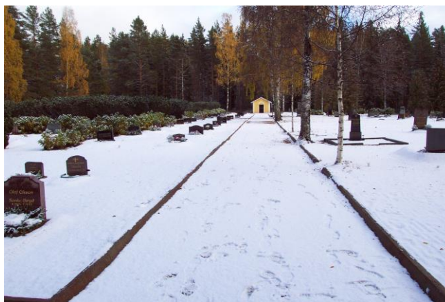
Mittgången på skogskyrkogården i Åmot.

Nya kyrkogården som omger Åmot kyrka planlades 1934 och togs i bruk vid 1940-talets början. Den utvidgades 1995 mot sydost. 1940-talsdelen omger kyrkan på toppen av Fröberget. Den är på tre sidor kringgårdad av en kraftfull kyrkogårdsmur, som liksom markytan terrasserats för att ta upp höjdskillnader. Kyrkogården är till största delen grästäckt med raka grusgångar runt kyrka, mur och de terrasserade rektangulära gravkvarteren. Mellan terrasserna finns trappor av granit med anslutande smidesräcken. I väster och norr omges kyrkan av en vitkalkad låg mur, där ett stramt utformat bisättningsrum är vidbyggt mot sluttningen i nordväst.