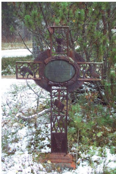
Rikt ornamenterat gjutjärnskors från 1800-talet på skogskyrkogården i Åmot.

ljung och ris. De södra gravkvarteren är tydliga exempel på den gravplatsindelning som var typisk för kyrkogårdar anlagda på 1800-talet och 1900-talets första halva, med en krans av större familjegravar i kvarterens ytterkant och allmänna gravvarv med mindre gravvårdar i mitten. De norra kvarteren är mer präglade av omläggning på 1960-talet med sina kraftiga friväxande bergtall och vresroshäckar. Här finns dock flera rikt ornamenterade järnkors med från 1800-talets senare del.