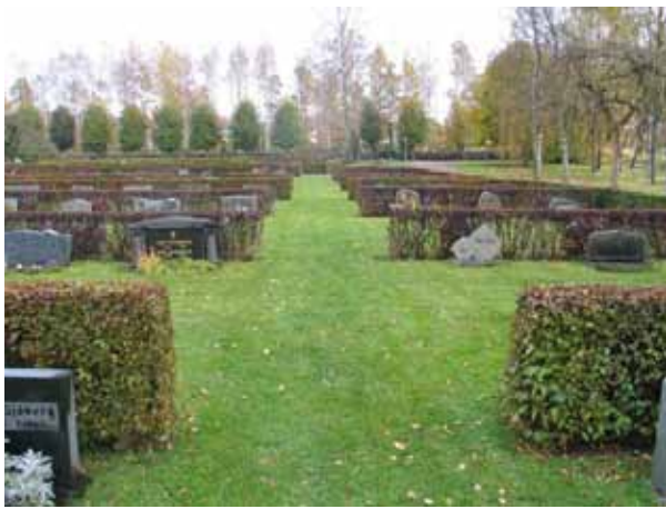
I södra delarna av kvarter E har en av grusgångarna såtts in med gräs. (KI Emmaboda kyrkog 046)

Den äldsta gravvården i kvarteret är från 1964 och området har efter det tagits i bruk efter hand. Majoriteten av vårdarna är från 1970-90-talen. De är låga och rektangulära till sin utformning. De allra flesta är stående men enstaka vårdar är också liggande. Ortsnamn är här vanligare än i de äldre kvarteren medan titlar förekommer i ungefär samma utsträckning. För den här tidsperioden finns det ovanligt många titlar. Till skillnad från kvarter D märks här bland titlarna en övervikt för mera akademiska yrken som redaktör, sjöingenjör och länsskogvaktmästare.