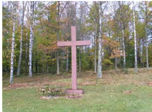
Ceremoniplatsen med korset av röd granit. (KI Emmaboda kyrkog 049)