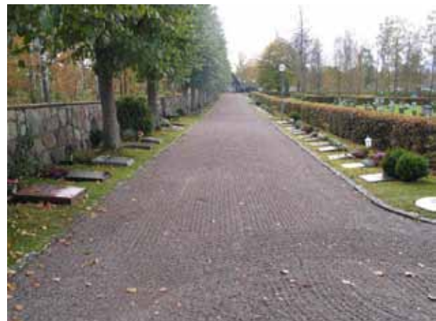
Till vänster urnområdena G och F. Till höger syns linjegravvårdar i kvarteren C, B och A. Bilden är tagen från norr. (KI Emmaboda kyrkog 054)