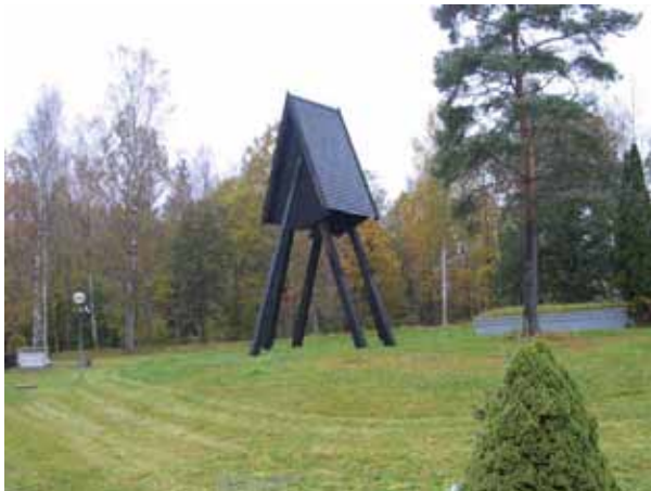
Klockstapeln och tillhöger om den bisättningskällaren. (KI Emmaboda kyrkog 014)

En ny byggnad för vaktmästeri och förråd uppfördes ?. Byggnaden har stående mörkgrön träpanel och ett sadeltak belagt med svartmålad korrugerad plåt. Dörrar och fönster karmar är svarta medan foderna är vita. Byggnaden rymmer garage, verkstad, personalrum och kontor.