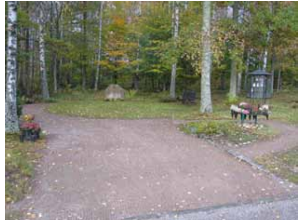
En av kyrkogårdens grusgångar. Till vänster kv B och A, tillhöger kv E. (KI Emmaboda kyrkog 050) Minneslundan från söder. (KI Emmaboda kyrkog 048)