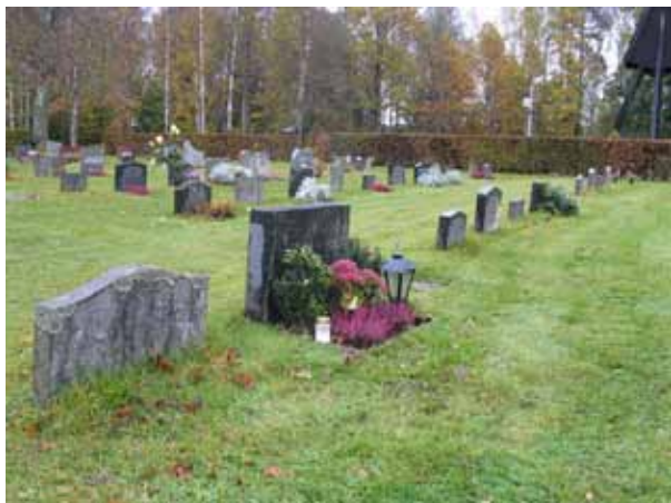
Typiska linjegravvårdar i de äldre delarna av kvarter D. (KI Emmaboda kyrkog 037)

De tre gravplatserna norr om det egentliga kvarter D har alla mycket breda och påkostade gravvårdar. På två av vårdarna finns porträttmedaljoner av sten eller brons. Alla tre omgärdas av stenram och är belagda med grus.