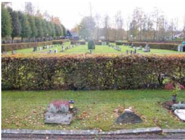
I förgrunden kvarter C. Bilden är tagen från norr. (KI Emmaboda kyrkog 053)

Kvarteren F-H är anlagda för urngravplatser. Kvarteren är ordnade mot kyrkogårdens mur i öster och nordost. Gravvårdarna är därför alla vända ut emot gången. Mellan gravplatserna är lindar planterade. Bland de äldre gravplatserna i kvarter F och G har man kunnat välja vilken gravplats man ville ha. Flera av gravplatserna i dessa båda kvarter är anlagda med en sk urnkammare. Under marken finns en kammare gjuten i betong i vilken man placerar urnorna. Kammaren täcks sedan av gravvården i form av en gravhäll.