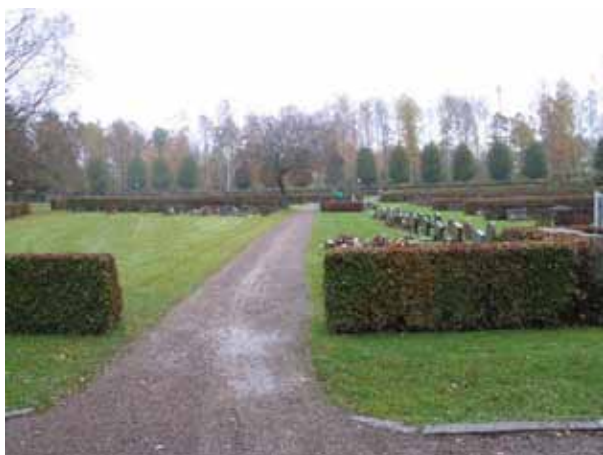
Kvarter D till vänster i bild och till höger kvarter E. Bilden är tagen från väster. (KI Emmaboda kyrkog 018)

Till kvarter D hör också tre större familjegravplatser mellan ceremoniplatsen och klockstapeln. Det är påkostade gravplatser omgärdade av stenramar och belagda med grus.