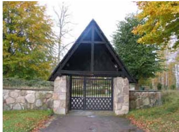
Kyrkogårdens mur i söder. (KI Emmaboda kyrkog 059) Stigluckan i sydost. (KI Emmaboda kyrkog 058)