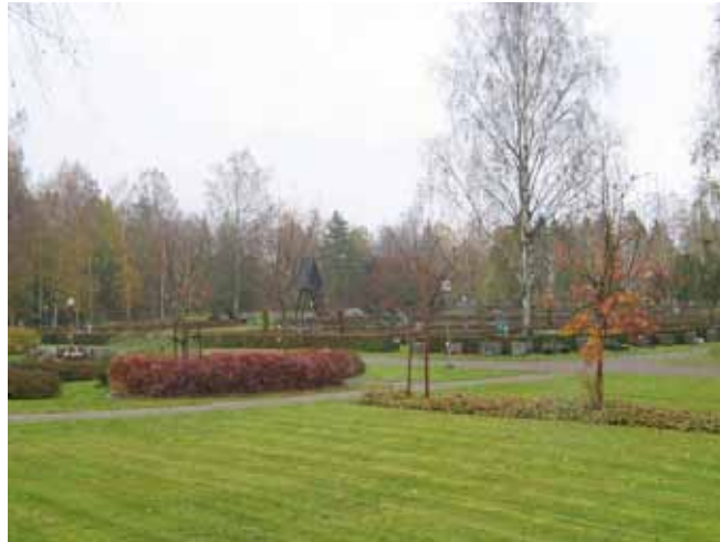
Kvarter J från sydväst. (KI Emmaboda kyrkog 021)

Kvarter J är det senast anlagda området på kyrkogården. Området skiljer sig från den övriga kyrkogården genom att ett mer varierat växtmaterial använts.