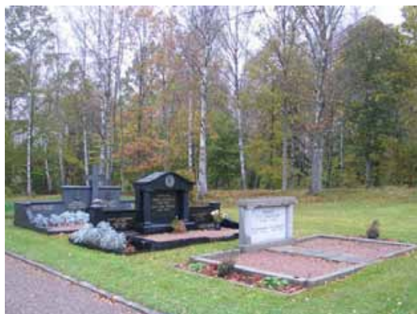
De tre påkostade gravplatserna i norra delen av kvarter D. (KI Emmaboda kyrkog 015)