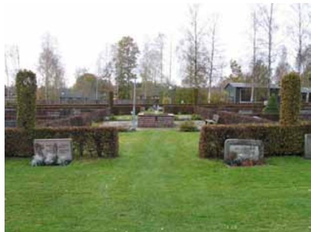
Brunnskaret med fontän i mitten av kvarter E samt de fyra formklippta pelarna av avenbok som ska symbolisera Jesu sår. (KI Emmaboda kyrkog 061)