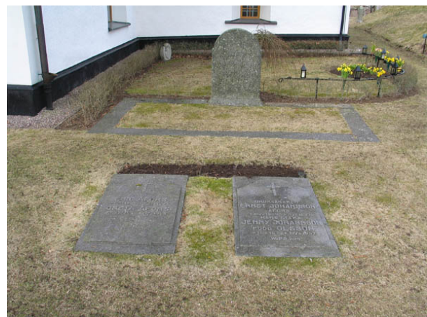
Till vänster Eric Åfors gravvård. (KI Algutsboda kyrkog 023)