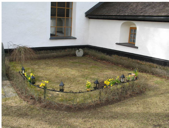
Minneslund i vinkeln mellan sakristian och koret. (KI Algutsboda kyrkog 021)