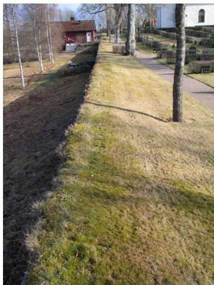
Kyrkogårdens omgärdning i väster. Den röda byggnaden är vaktmästeriet. (KI Algutsboda kyrkog 003)

I kyrkans torn förvaras ett mindre antal trävårdar. En av dessa är daterad 1936.