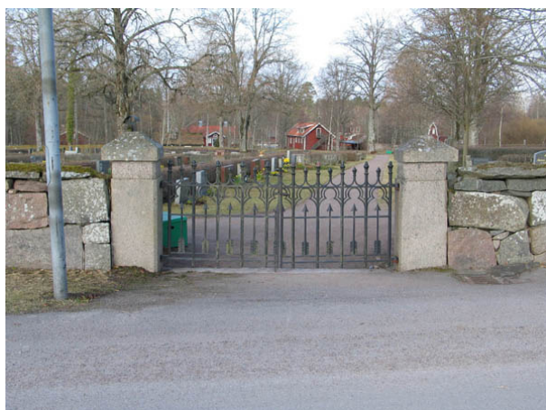
En av kyrkogårdens ingångar i öster. (KI Algutsboda 011)