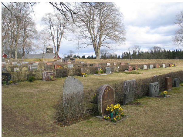
Kvarter G från väster. (KI Algutsboda kyrkog 044)