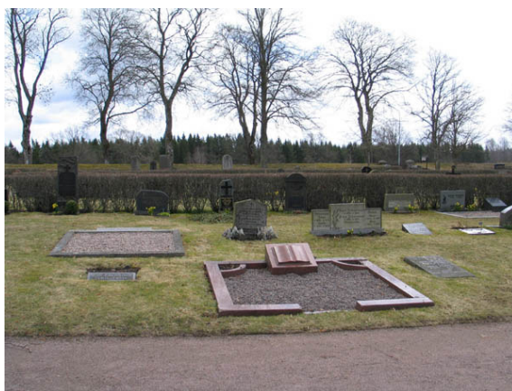
Gravplatser i västra delen av kvarter D vars stenramar har tagits fram och gravplatserna har åter belagts med grus. (KI Algutsboda kyrkog 033)

Området utgörs dels av de allra äldsta delarna av kyrkogården samt av den del som tillkom 1875. De fyra kvarteren har under 1900-talet genomgått en omläggning då gravvårdarna placerades i ryggställda rader med häckar emellan. Trots detta kan man än idag se rester av den äldre strukturen med köpta gravplatser i kvarterens ytterkanter och linjegravsområden i dess mitt. De köpta gravplatserna har tidigare varit belagda med grus och omgärdade. Ett litet antal gravplatser har idag den här utformningen. Sammantaget rymmer de fyra kvarteren flera spår av äldre anläggningsformer som varit vanliga på våra kyrkogårdar. Hos enskilda gravvårdar finns person- och lokalhistoriska värden. Gravvårdar från mitten av 1800-talet samt gravvårdar av gjutjärn och smide skall införas på församlingens inventarieförteckning.