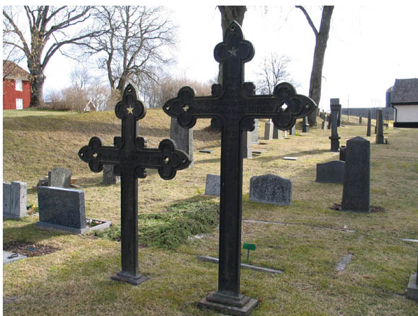
Två gjutjärnskors med ovanlig utformning. Båda korsen är från 1854. (KI Algutsboda kyrkog 016)

Intrycket av gravvårdarna i de båda kvarteren domineras av de höga stående gravvårdarna från tiden omkring sekelskiftet 1900. Eftersom kvarteren brukats kontinuerligt fram till idag finns här också låga, rektangulära gravvårdar som varit vanliga från 1930-talet fram till idag. Majoriteten av gravvårdarna är stående men det finns också ett antal liggande gravvårdar. Typiskt klassicistiska stildrag dominerar med inslag av nationalromantik. Materialet är främst grå och svart granit. Ett mindre antal vårdar är av andra material. I kvarter A finns fem gjutjärnskors. Det finns även en gravvård av kalksten och en av marmor i kvarter A. Två gravvårdar i kvarter A har en granitvård som kröns av marmorkors. Fyra gravplatser i kvarter A omgärdas av stenram. I kvarter B omgärdas en gravplats av stenram. Det finns också rester av en stenram i anslutning till en av gravplatserna. En gravplats i kvarter B omgärdas av ett smidesstaket på en stensockel.