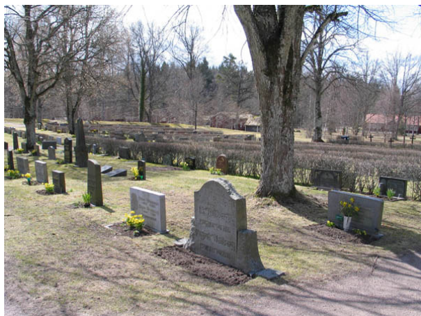
Kvarter F från öster. Även detta kvarter har haft samma struktur som kvarter D men det syns inte riktigt lika tydligt idag. (KI Algutsboda kyrkog 040)

Utmed kyrkogårdens vallmur står ett antal äldre gravvårdar uppställda. Här återfinns några av de äldsta gravvårdarna i kvarteret. Den äldsta gravvården i kvarteren som troligen står på sin