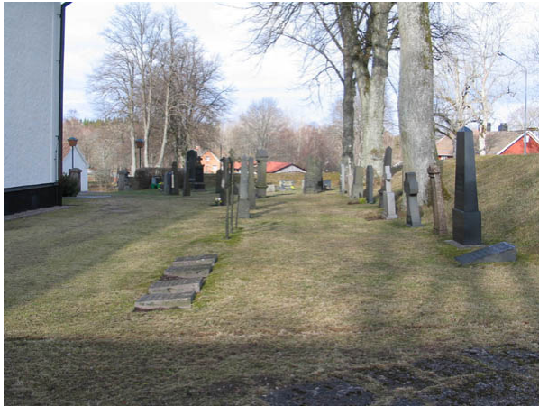
Kvarter A från öster. (KI Algutsboda kyrkog 015)

arrendator och trotjänarinna. Det är också vanligt att man anger varifrån i socknen den döde kommer.