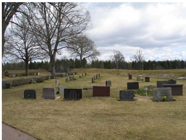
Kvarter H från väster. Till höger i bilden syns gravvårdar som plockats bort från kyrkogården och lagts i vallmuren som omger kyrkogården. (KI Algutsboda kyrkog 045)