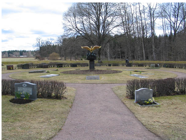
Kvarter K från norr med skulpturen Fågel Fenix i kvarterets mitt. Runt om skulpturen liggande gravhällar. (KI Algutsboda kyrkog 049)

I kvarteren finns gravvårdar typiska för 1900-talets andra hälft. De är låga, stående och rektangulära till sin utformning. Dekoren är ofta enkel. Vanliga motiv är ett kors eller en skogsdunge. Stående gravvårdar dominerar men även liggande förekommer. Det gäller i synnerhet kvarter K och urngravplatserna i kvarter J. Materialet är främst grå granit men även svart och röd förekommer. Ett mindre antal vårdar är av andra material. Fyra är av smide, två av trä och en av marmor.