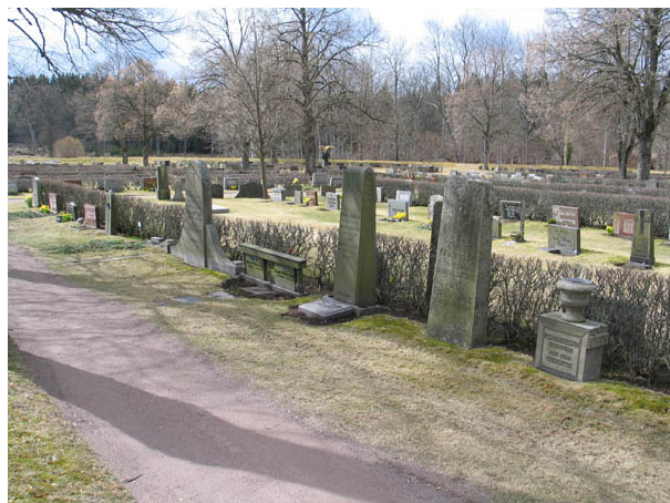
Kvarter D från öster. Längst fram i bilden syns några av kvarterets mer påkostade gravvårdar. Dessa gravplatser utgjorde en del av den ram av köpta gravplatser som tidigare fanns i kvarterets ytterkant. I mitten fanns ett linjegravsområde. (KI Algutsboda kyrkog 034)

Kvarteren är belägna söder om kyrkan och i stort sett rektangulära till formen. De fyra kvarteren bildar tillsammans ett enhetligt område som delas in i fyra kvarter med hjälp av raka grusgångar. Den gång som går från kyrkans långhus och söderut genom området delar området i en östlig och en västlig del. Utmed denna gång är lindar planterade. Ursprungligen förefaller området ha varit planlagt med köpta gravplatser i kvarterens ytterkanter och linjegravsområden i dess mitt. Äldre fotografier visar att samtliga linjegravar varit vända mot öster. Idag är gravvårdarna placerade i ryggställda rader vända mot öster eller väster och med häckar av cortoneaster emellan. De köpta gravplatserna kan urskiljas genom att de är vända mot gångsystemet. I kvarteren finns såväl linjegravvårdar som en del äldre gravvårdar som tillhör de köpta gravplatserna bevarade. Kvarteren präglas dock av den omläggning av kyrkogården som gjordes under 1950-60 talen.