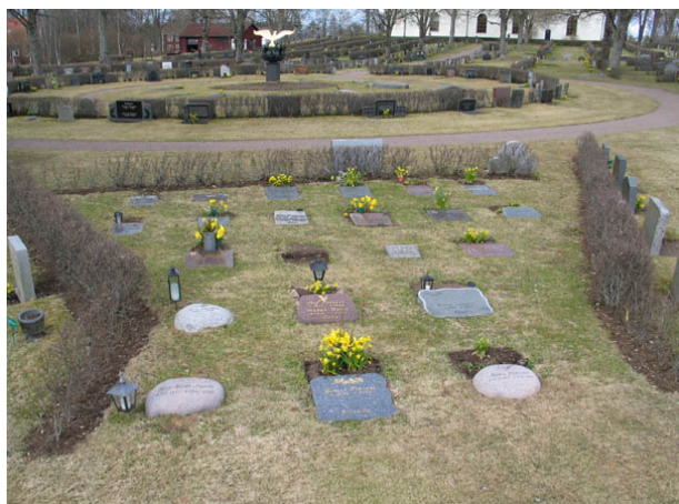
Urngavsområdet kvarter J. (KI Algutsboda kyrkog 050)