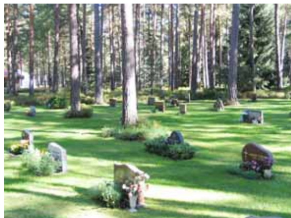
Glänta G från söder. (KI Mönsterås Skogskyg 017)