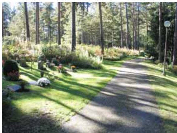
Norra delen av urnområdet med glänta UA närmast i bild. (KI Mönsterås Skogskyg 004)

Gläntorna för urngravar är ordnade på sluttningarna av en höjdsträckning i kyrkogårdens nordvästra del. Förbi gläntorna går den gångslinga som går runt hela urngravsområdet. Här ligger också kyrkogårdens minneslund. Gläntorna för urngravar är betydligt mindre än de för kistgravar, men ordnade på samma sätt med insådda gräsmattor. Gravvårdarna är placerade i rader vända mot gången. Längst fram ligger vårdarna ner medan flera av vårdarna i den bakre delen av gläntorna är stående. I glänta UH och UG finns flera lediga platser.