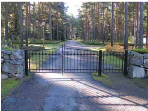
Kyrkogårdens ingång i nordost. (KI Mönsterås Skogskyg 060)