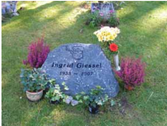
Liggande urnvård med personlig dekor. (KI Mönsterås Skogskyg 009)

Urnområdet på Skogskyrkogården i Mönsterås är på flera sätt typiskt för sin tid. Det är förlagt till ett område på kyrkogården som lämpar sig mindre bra för kistgravar. Därmed utnyttjar man marken på ett bra sätt. Hela området har en medveten plan och gestaltning. Den enkla och väl sammanhållna karaktären är viktig att bevara.