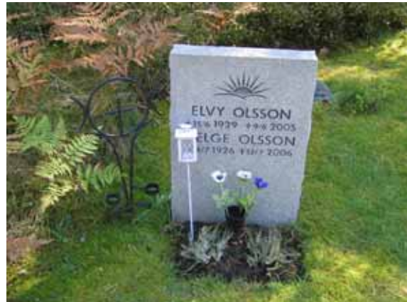
Urgravplats med stående gravvård och ställ i smide för ljus. (KI Mönsterås Skogskyg 010)