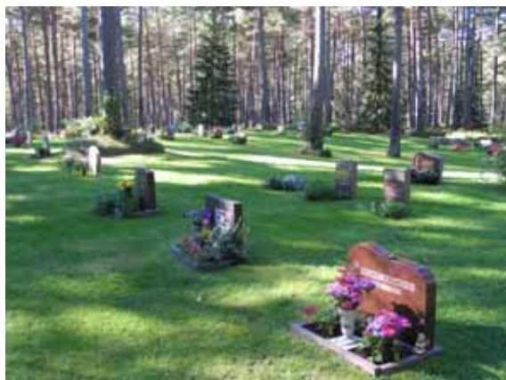
Glänta E från norr. (KI Mönsterås Skogskyg 030)

Gravvårdarna är låga och enkla för att smälta in i miljön. Även dekoren är ofta enkel. Vanliga typer av dekor är blommor, kors och på de lite äldre vårdarna talldungar och uppgående solar. De äldsta gravvårdarna är från 1977 och de finns i glänta A och D. Den senast i bruk tagna gläntan är avsedd för muslimska trosbekännare. Området började användas 2002 och idag finns tre gravsättningar. Även här är vårdarna små och enkla. Vid en vård finns de typiska brädor kvar som markerar gravplatsens huvudända och fotända. För samtliga kvarter gäller att majoriteten av gravvårdarna är stående, men det finns också enstaka liggande vårdar. De allra flesta vårdarna är av grå eller röd granit. Även svart granit förekommer och i glänta E finns ett smideskors och en vård av kalksten. Titlar är ovanliga. Totalt finns fem stycken i samtliga gläntor. De är postiljon, bildhuggare, glasmästare, överingenjör och jägmästare. På några stenar finns bilder eller inskriptioner som berättar om den dödes yrke eller intresse t.ex. en dalmatiner och inskriptionen "Älskade djur och natur, konst och poesi". På en av vårdarna i kvarter E finns en porträttbild på den döda. Att ange varifrån den döde kommer är ovanligt på stadskyrkogårdar och så också på Skogskyrkogården i Mönsterås. Någon vård där ortsnamnet anges finns i varje glänta och flest på vårdarna i glänta E.