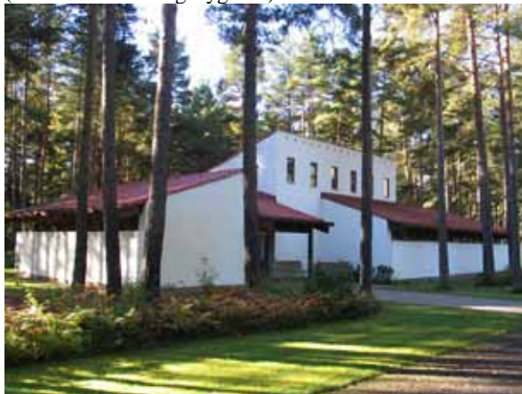
Skogskapellet från nordost. (KI Mönsterås Skogskyg 056)