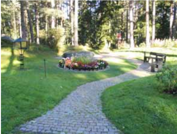
Minneslunden från söder. (KI Mönsterås Skogskyg 047)

I kyrkogårdens nordöstra hörn står en klockstapel av trä. Fyra kraftiga pelare bär upp en kvadratisk huv. Den har ett tak av svartmålad plåt och dess sidor är täckta med glasskivor. I stapeln hänger en klocka gjuten av ?