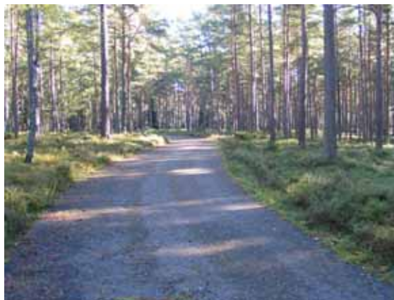
Runt hela kyrkogården går den asfalterad gången. (KI Mönsterås Skogskyg 050)