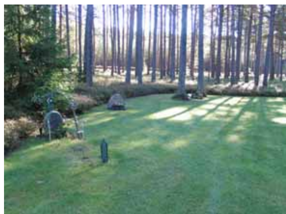
Glänta för muslimska begravningar. (KI Mönsterås Skogskyg 054)