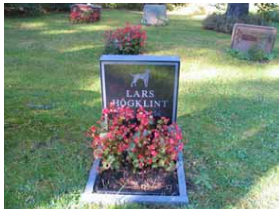
Personlig dekor på gravvårdarna blir allt vanligare. Här en fiskebåt... (KI Mönsterås skogskyg 020) ... och här en dalmatiner. (KI Mönsterås Skogskyg 031)