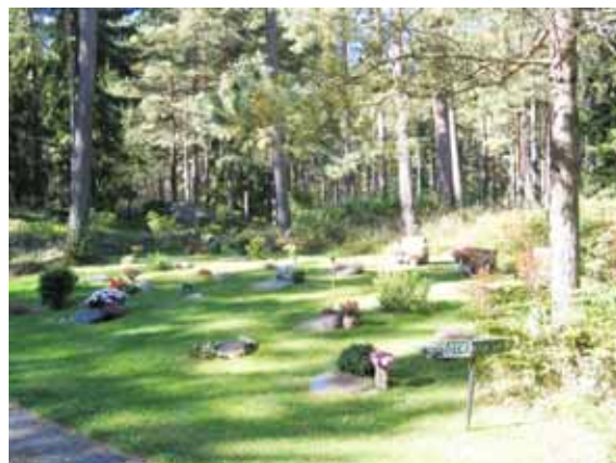
Glänta UF från öster. (KI Mönsterås Skogskyg 014)