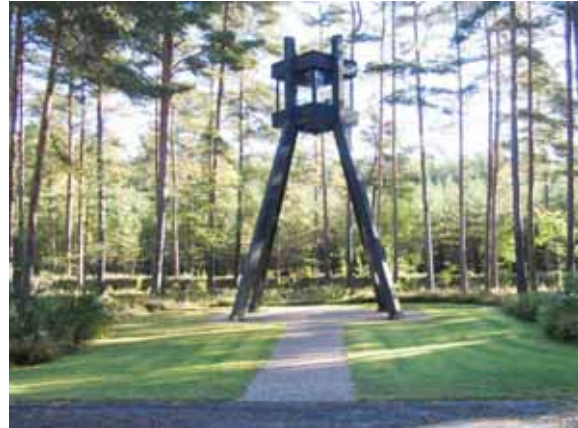
Klockstapeln i kyrkogårdens nordöstra hörn. (KI Mönsterås Skogskyg 061)