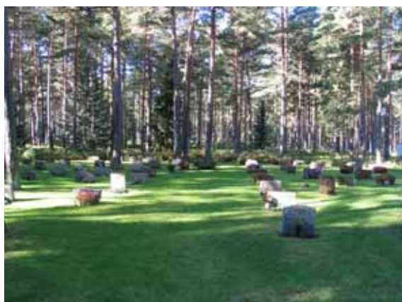
Glänta D från öster. (KI Mönsterås Skogskyg 035)