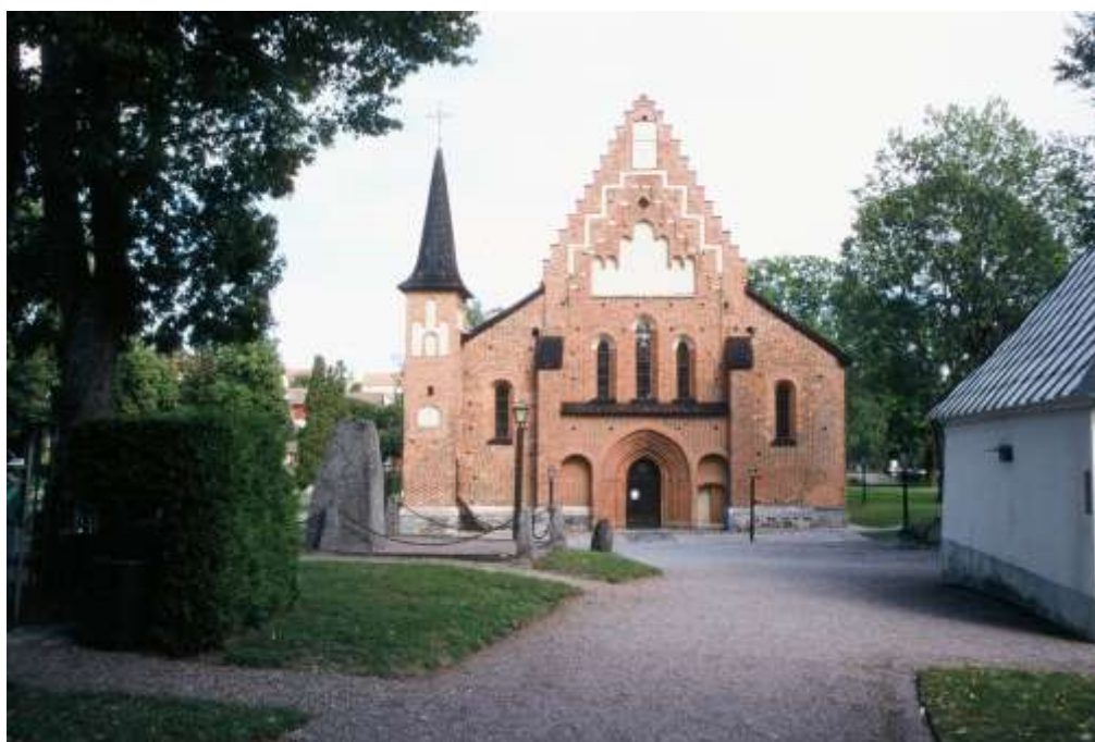
Mariakyrkans västgavel med trappgavel, vitmålade blindingar, trefönstergrupp, rundbågsnischer och flersprångig portal. Turnellen är förhöjd och försedd med tornhuv år 1904-05. Foto: Gunilla Nilsson, 2003.