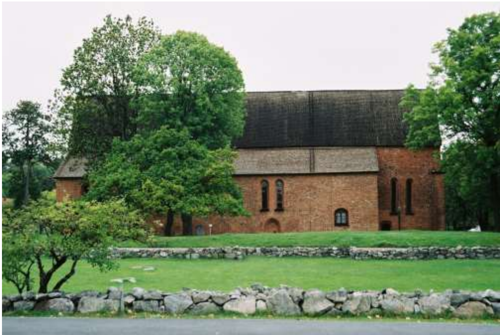
Mariakyrkans södra gavel med valvbågar, en rest av klostrets korsgång som tidigare var ihopbyggd med kyrkoväggen. Söder om kyrkan ligger en gräsbeväxt plan, delvis muromgärdad. Delar av klostrets grundmurar har här markerats med stenväggar i marken.