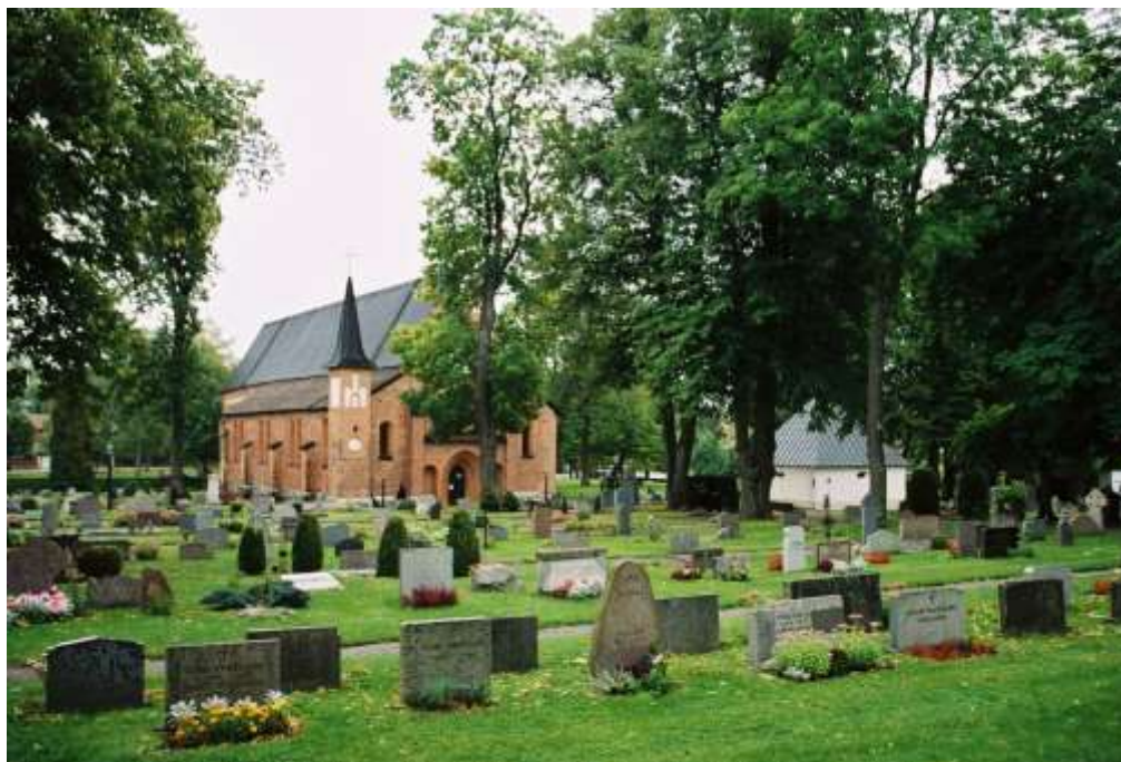
Mariakyrkan och gravkapellet mot sydväst. Den norra delen av kyrkogården närmast kyrkan är gräsbeväxt med grusade raka gångsystem och gravvårdar i rader.