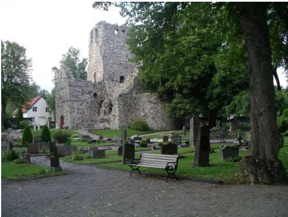
S:t Olofs kyrkoruin belägen på kyrkogården vid Olofsgatan. På den syd-västra delen av kyrkogården märks fler äldre kulturhistoriskt värdefulla gravvårdar. Foto: Lisa Sundström, 2003.