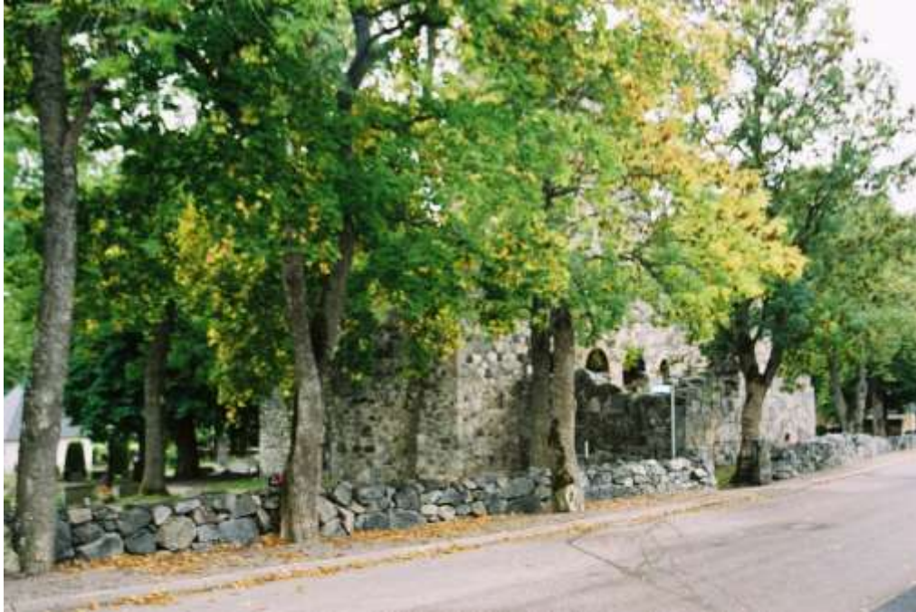
S:t Olofs kyrkoruin, bogårdsmur med grindstolpar och trädräm vid Olofsgatan. Foto: Lisa Sundström, 2003.