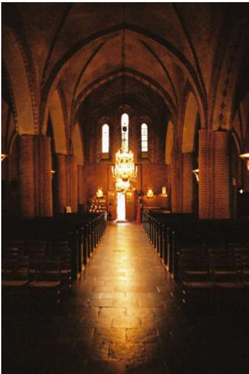
Mariakyrkan åt väst.