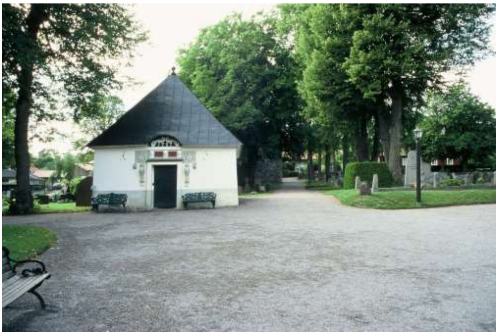
Gravkapellet väster om kyrkan uppfört år 1757. En grusad gång leder från kyrkans västra ingång till en entré genom kyrkogårdsmuren från Olofsgatan. Längst med den grusade gången är flera träd planterade.