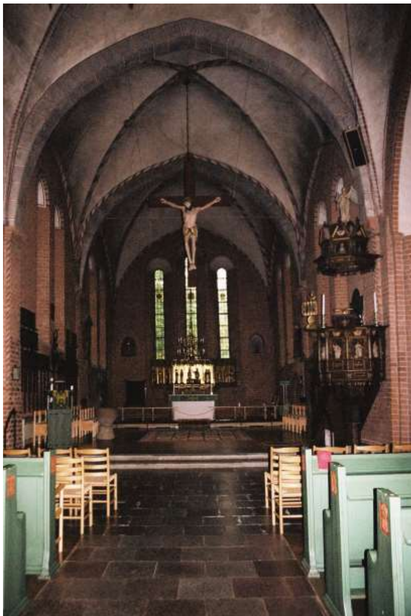
Mariakyrkan åt öst. Foto: Lisa Sundström, 2003.