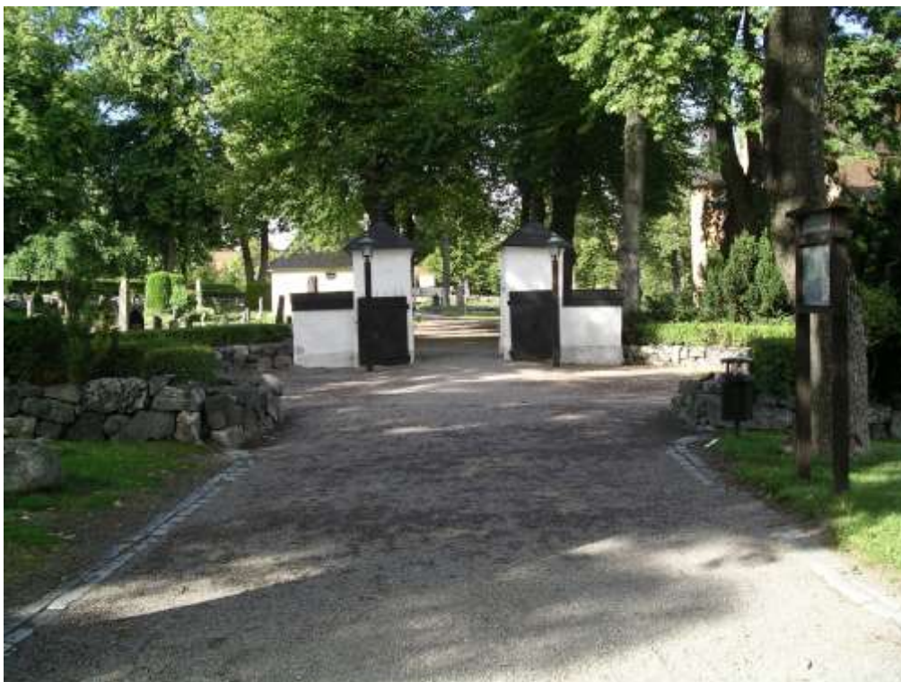
Stigluckan i söder. Utanför stigluckan är anlagd en rund, muromgärdad grusad plan. Gången omgiven av en allé leder till kyrkans västentré.