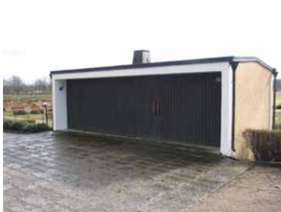
Bårhus på gamla kyrkogården byggt 1955. (IMG 6839)