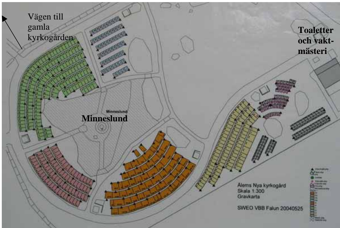
Karta över Ålems nya kyrkogård