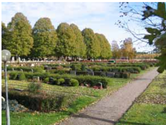
Kvarter 4 från sydväst. (KI Ålems kyrkog 030)