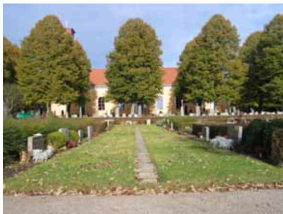
Kvarter 4 från söder. Kalkstensgångarna är nu på väg att tas bort och sås in med gräs. (KI Ålems kyrkog 032)