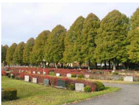
Kvarter 3 från sydost. (KI Ålems kyrkog 037)