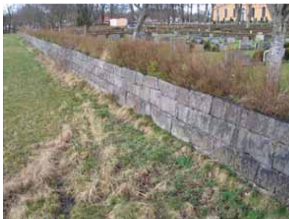
Del av gamla kyrkogårdens stödmur i söder. (IMG 6837)