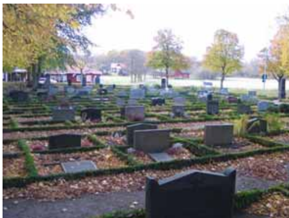
Kvarter 1A från sydost med gravplatser belagda med jord och omgärdade av låga buxbomshäckar. (KI Ålems kyrkog 105)