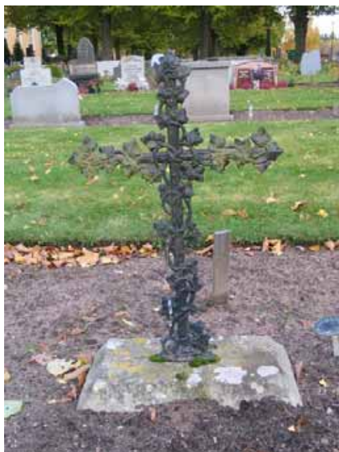
Ett litet gjutjärnskors i kvarter 1B (KI Ålems kyrkog 089)