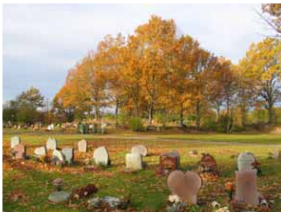
Vy över nya kyrkogården. Bilden är tagen från söder mot nordväst. (KI Ålems kyrkog 014)