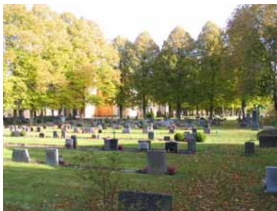
Kvarter 1B från sydväst med linjegravvårdar i mitten och köpta gravplatser till häger i bild. (KI Ålems kyrkog 026)