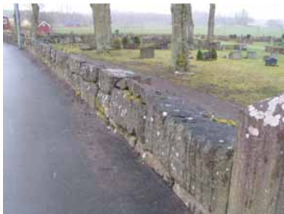
Del av gamla kyrkogårdens halvmur i norr. (IMG 6817)

Nya kyrkogården: I söder och öster omgärdas kyrkogården av ett brunmålat staket likt det staket som kantar gången från gamla till nya kyrkogården. I norr och väster utgörs omgärdningen av kallmurad stenmur som i väster är av äldre datum.