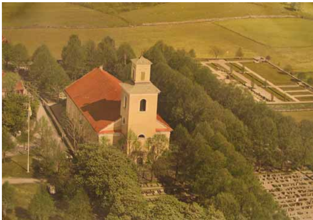
Flygfoto över Ålems kyrka och kyrkogård taget någon gång mellan 1940-talet och 1967.

Nästa utvidgning genomfördes i början av 1940-talet. Mark inköptes av Karl Adolfsson Ålem 1 och skolhemmanet Ålem 5. Ritningarna till den nya kyrkogårdsdelen gjordes av länssarkitekt Åke Strindberg. Arbetet avsynades 1947 och invigdes samma år av kontraktsprost John Sjöberg, Mönsterås. På en flygbild tagen tre år senare kan man se att ungefär hälften av det nya området är belagt med gravplatser. Hela kyrkogården var vid den här tiden till övervägande del belagd med grus. Flera gravplatser var omgärdade med häckar. Det var också relativt vanligt på de äldre delarna av kyrkogården att man hade en gravkulle överväxt med murgröna. Ett förslag till bårhus ritades 1948 av arkitekt Arne Delborn, länssarkitektkontoret. Det blev dock inte godkänt och först 1955 togs ett nytt förslag fram. I det bårhus som byggdes installerades kylanläggning.