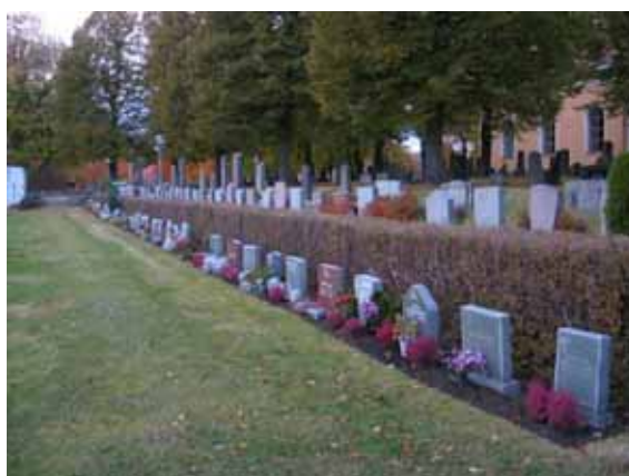
I gränsen mellan kvarter 4 och kvarter 1 är platser för urngravar ordnade. (KI Ålems kyrkog 129)