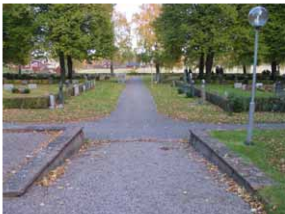
Vy över kvarter 2 från väster. (KI Ålems kyrkog 112)

eller insådda med gräs. Under slutet av 1900-talet har också några av de mindre gångarna inne i rutorna upplåtits som gravplatser. Hela området har ursprungligen varit belagt med jord eller grus men är idag insått med gräs. Gravvårdarna är ryggställda mot låga häckar av måbär. Majoriteten av gravplatserna är ordnade för familjegravar men det finns också ett mindre linjegravsområde i den nordöstra delen av området. Även detta kvarter är lummigt med höga lindar utmed en del av gångarna.