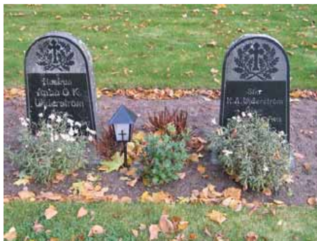
Två av linjegravvårdarna i kvarter 1B (KI Ålems kyrkog 104)