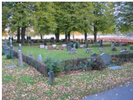
Vy över södra delen av kvarter två från väster. (KI Ålems kyrkog 113)