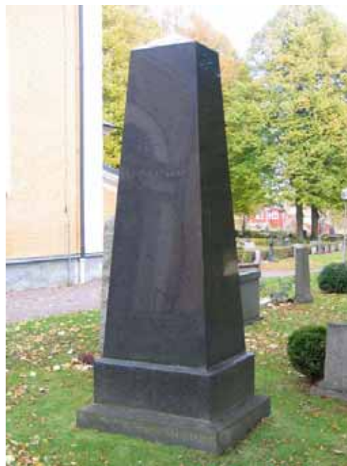
Påkostad gravvård i kvarter 1C. Formen är klassicistisk och typisk för tiden kring sekelskiftet 1900. (KI Ålems kyrkog 069)