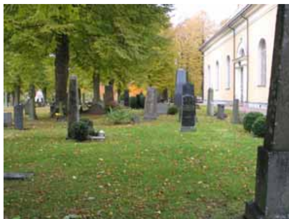
Norra delen av kvarter 1C från öster. (KI Ålems kyrkog 045)