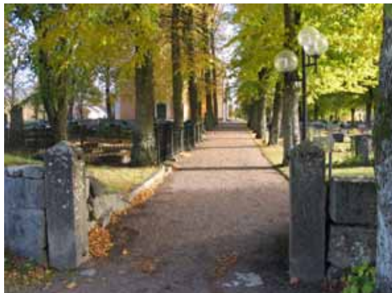
Gamla kyrkogårdens ingång i väster. (KI Ålems kyrkog 025)