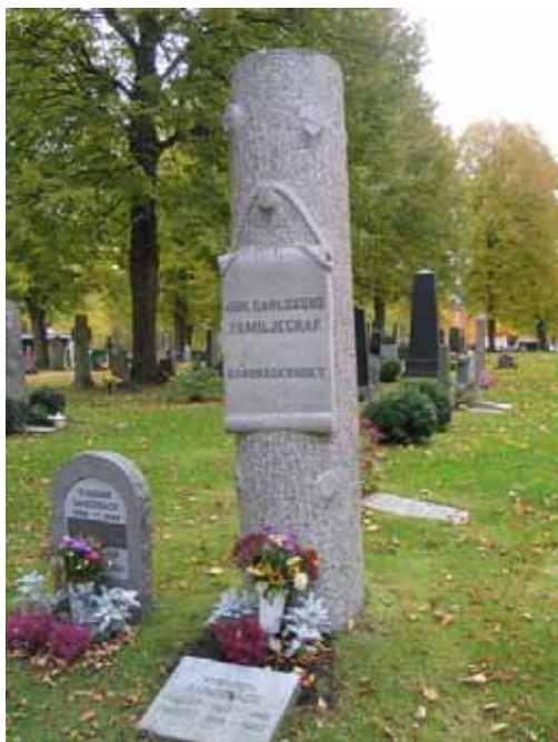
Gravvård i form av bruten trädstam. Denna typ av vård förekommer omkring sekelskiftet 1900. Kvarter 1C. (KI Ålems kyg 061)