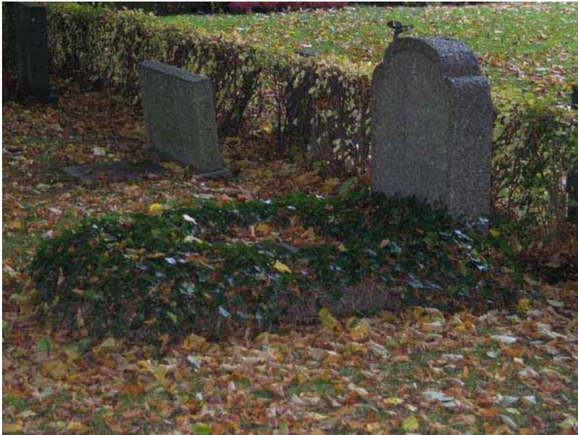
Gravvård med gravkulle överväxt av murgröna. Denna typ av gravplatsutsmyckning var tidigare mycket vanliga på våra kyrkogårdar. (KI Ålems kyrkog 119)