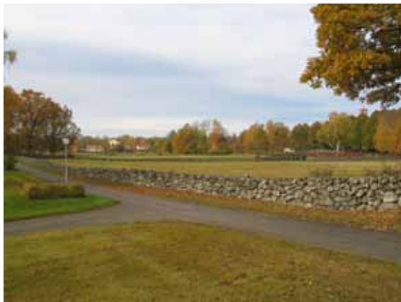
Nya kyrkogårdens omgärdning i norr. (KI Ålems kyrkog 020)

Nya kyrkogården: Ingång från gamla kyrkogården i nordvästra hörnet samt i anslutning till parkeringsplats i sydöstra hörnet. Vid den sistnämnda finns breda dubbla smidesgrindar för maskiner samt en mindre grind för besökare. Samtliga är svartmålade smidesgrindar.