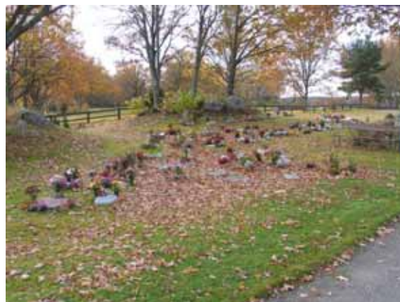
Kvarter anpassat för urnor på nya kyrkogården. (KI Ålems kyrkog)