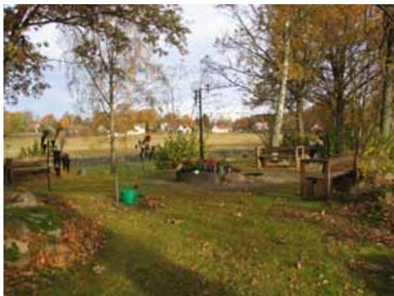
Minneslund på den nya kyrkogården. (KI Ålems kyrkog 015)