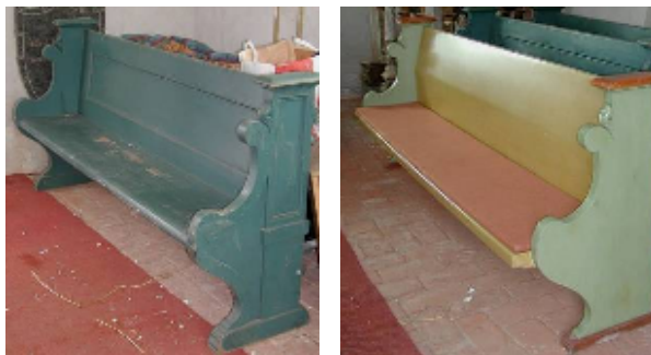
Till vänster ses en av 1905 års bänkar i originalskick, till höger hur de blev vid 1970 års ombyggnad.

Kyrkans senaste stora omgestaltning skedde 1970 enligt arkitekt Per Bohllins anvisningar. Putsen från 1905 bortogs från valv och väggar, fast västra väggen och sköldbågens undersida vid sydportalen sparades som dokumentationsytor. På kyrkorummets norra vägg frilades och restaurerades medeltida målningar. I fönstren ersattes tidigare rutor av "råglas" med genomsiktligt, gulskimrande nyantikglas. Golven i vapenhuset, koret och tornets bottenvåning höjdes, försågs med golvvärme och belades med hyvlade kalkstensplaner. Bänkinredningen gjordes sittvänligare och målades med nuvarande pistagegrön och klargul färg. På sakristian östra sida gjordes en tillbyggnad för kapprum, textilkammare, WC och brandsäkra förvaringsfack för kyrksilvret. I dessa nya utrymmen lades golv av återanvänt tegel.