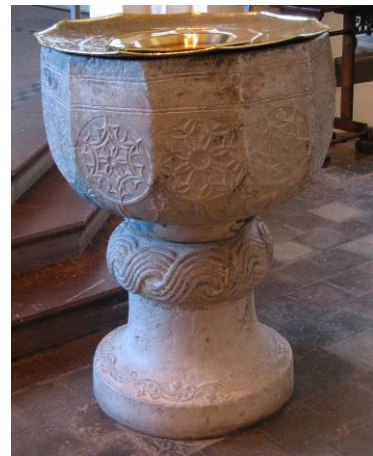
Kyrkans äldsta dopfunt är en så kallad nodfunt, daterad till perioden 1415-1425.

Kyrkan uppfördes förmodligen en kort tid före stadens grundande. Sedan stadsrättigheter utfärdats på 1200-talet blev kyrkan församlingskyrka både för stad och omgivande landsbygd. Från början bestod den av ett enskeppigt långhus med vapenhus i söder. Strax efter att långhuset stod färdigt tillbyggdes västtornet, ursprungligen krönt med huv och smal spets. I mitten av 1300-talet utbyggdes koret och norra sidoskeppet, vilka stod färdiga 1358. Grundläggningen på en bergnära tomt har borgat för stabilare murverk än de i stadens nedre kyrka, Heliga Trefaldighet nära Arbogaån.