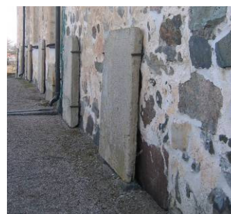
Yttertaket täcktes med koppar vid omläggning 1978. Vid senaste fasadrenoveringen 1994-95 borttogs all cement, lagningar gjordes med rent kalkbruk och kalkavfärgning i vitockra nyans.