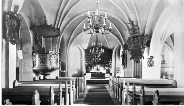
Kyrkorummet hade under 1900-talets första hälft öppna bänkrader, insatta vid 1904-05 års förnyelse. Valv och väggar saknade dekormålningar. Digital kopia av vykort från omkring 1900

Södra sidoskeppets kororgel installerades 1969-70. Vid omläggning av yttertaket 1978 ersattes de då 90-åriga järnplåtarna med koppar.