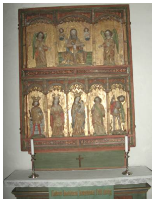
Altarskåpet har daterats till 1400-talets mitt och hade från början även två