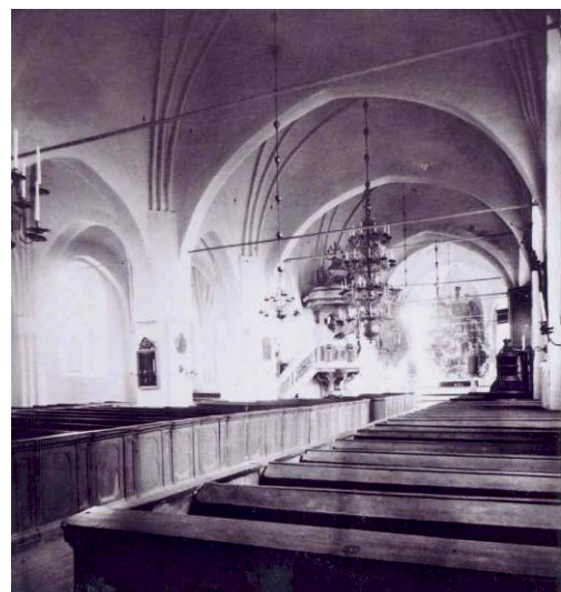
Kyrkorummet fotograferat före 1897, då bänkinredningen var sluten, till sina äldsta delar från 1600-talet

Vid en omläggning 1837 blev skiffer lagt på långhustaketets södra sida, istället för tidigare spån. Norrsidans och tornets spåntäckningar behölls, men vartefter de slets ut övervägde församlingen att ersätta även dem med skiffer. Antagligen ställde det sig för dyrt, eftersom upprepade reparationer och tjärstrykningar skedde fram till 1883, då istället järnplåt lades på båda långhusets takfall. Tornets spånbeklädnad består alltjämt.