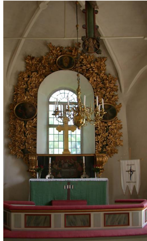
Kyrkorummet renoverades senaste gångerna etappvis, 1983 och 1985

Kyrkorummet är täckt med fyra stjärnvalv, kalkade i en svagt gulbruten nyans. Dekorationsmåleriet begränsar sig till ett invigningskors i koret. Golven i mittgång och bänkkvarter är belagda med lackade bräder. Bänkarna från 1887 stod från början i öppna rader, men vid omgestaltning 1940 fick de fasader tillverkade med bevarade bänkskärmar från 1752 som förlaga. Skärmarna är ljusgrå, har mörkare grå överliggare, röda listverk och marmorerade fyllningar. Längst fram sitter snidade, förgyllda barockdekorationer på hörnpilastrar. Predikstolen vid främre norra valvpelaren i barockstil är åttasidig, prydd med snidade, förgyllda akantusblad.