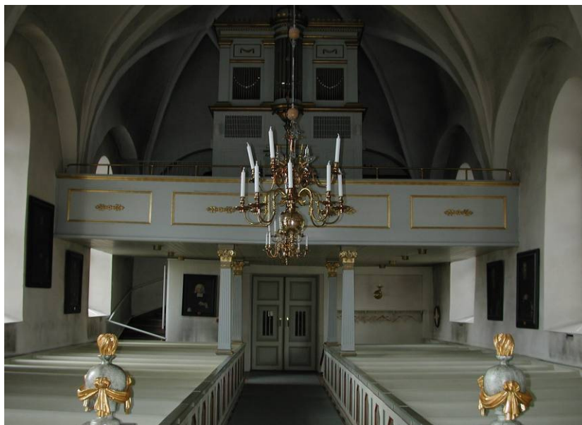
Orgelfasaden utformades 1840 av Pehr Gullbergsson, mest verksam i Upplands kyrkor

Norra sidokapellet har ett lägre kryssvalv och lackat tegelgolv. Det är inrett med flyttbart altarbord och lösa stolar, för mindre samlingar.