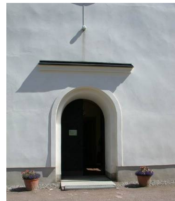
Tornet blev helt nyputsat 1998

Kolbäcks kyrka omfattar långhus som i öster har en kort tresidig koravslutning med strävpelare, mot norr en utbyggnad för sakristia och sidokapell, samt västtorn. Långhusets murar består av gråsten, fransett koravslutningen av tegel. Tornet är murat av gråsten upp till ungefär halva sin höjd och ovanför tegelmurat. Fasaderna är genomgående slätputsade, sockeln struken med ljusgrå cementfärg och väggarna kalkavfärgade i gulaktigt vitt. Fönsteröppningarna är rundbågiga och har fönstersnickerier av varierande ålder men nästan samma utseende, målade med ljusgrå linoljefärg. Tornet har med gesimser indelats i tre avsatser: I den nedersta är en rundbågig västportal med rakt överstycke, i den mellersta är klockvåningen med rundbågiga, tjärade ljudluckor och i den översta är urtavlor av svart plåt med förgyllda visare, en i varje väderstreck. Ovanpå tornets mur är en nyklassicistisk lanternin i svartmålat trä, med hörnpilastrar och snidade ornament, kupoltak, förgyllt kors och kula. Lanterninen omges av ett smidesräcke infäst i hörnpilastrar prydda med förgyllda urnor.