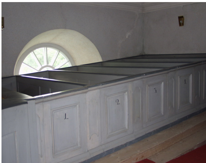
Orgelläktarens ursprungliga trägolv och sex hänkrader _