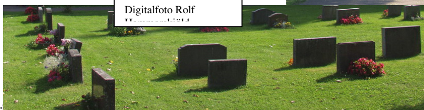
Digitalfoto Rolf 11/11/2013