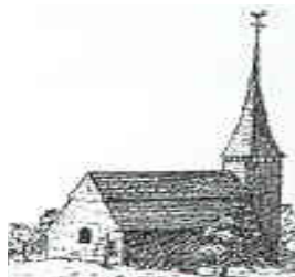
Då Olof Grau avtecknade kyrkan på 1750-talet fanns ännu ingen sakristia utbyggd.

Någon gång på 1500-talet tillbyggdes ett vapenhus och omkring 1600 det resliga klocktornet i trä på västra gaveln. Den alltjämt befintliga predikstolen har daterats till omkring 1650. Under senare hälften av 1600-talet inkom kollektmedel från andra församlingar för att kunna göra nödvändiga reparationer.