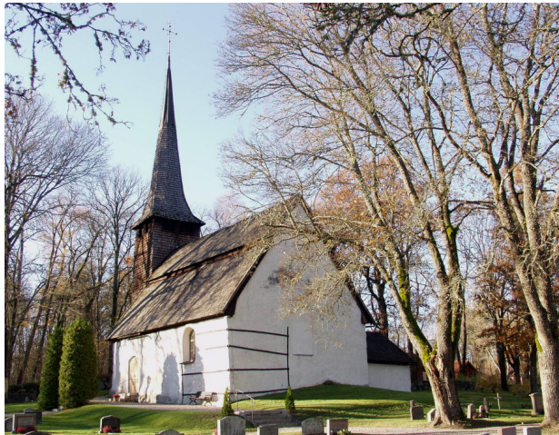
Södra långsidan och östra gaveln, vars korfönster bortogs 1952.

Kungs – Barkarö kyrka har ett litet långhus med kor under brutet, spåntäckt tak, samt på norra sidan en sakristia med spåntäckt sadeltak och hög plåtklädd skorsten. Murverken består av stor gråsten, samt tegel i muröppningarna. Fasaderna har spritputsats relativt tunt med KC- bruk, med krossgrus som ballast, samt avfärgats med vit cementfärg. Ankarslutar och sammanhållande stångjärn är målade med svart oljefärg. På södra sidan finns en liten rundbågig fönsteröppning och på den norra en bredare, stickbågig. Fönsterbågarna har blyinfattat nyantikglas. I anslutning till västra gaveln är ett högt, spetsigt klocktorn i trä, klätt med tjärstrukna spån.