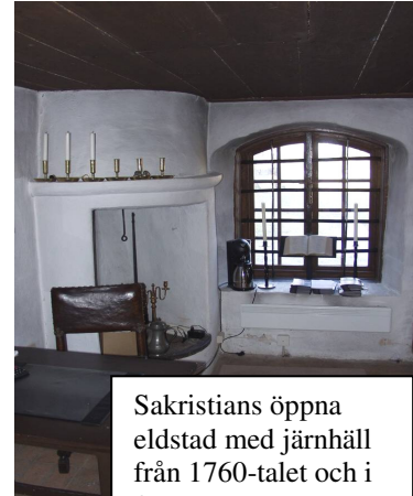
Sakristians öppna eldstad med järnhäll från 1760-talet och i fönstret ett andaktsaltare, iordningställt 1971.

En smal passage från koret leder till den lilla sakristian i norr, några steg nedanför. Möbleringen är gammal och i nordväst finns en öppen eldstad med järnhäll bevarad.