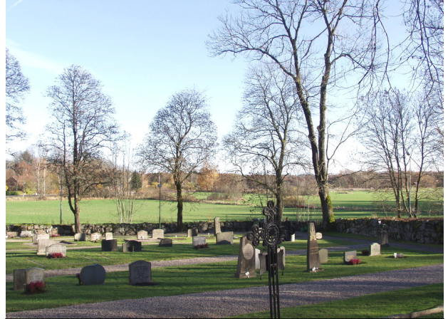
Kyrkogårdens sydöstra del, med Köpingskomplexet i bakgrunden

Kyrkogården är anlagd i en svag östsluttning och omgärdas av en bogårdsmur i kallmurade förband. I de två muröppningarna sitter svartmålade järngrindar från 1865. Vid infarten från söder finns en faluröd ekonomibyggnad från 1800-talet. Innanför muren finns en krans av gamla lövträd och en bred grusad gång.