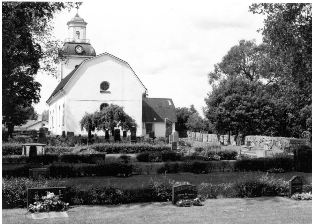
Östervåla kyrka med rakslutet korparti och långhuset täckt med brutet sadeltak. Till höger syns del av den f d kyrkogårdsmuren. 2002. VLM neg B 103 909: 32

Minneslunden tillkom 1998 och ligger i en ovalliknande försänkning centralt i en urlund som anlades 1971. Dess storgatstensbelagda gångar leder fram till en smykningsplats med en natursten som koncentrationspunkt.