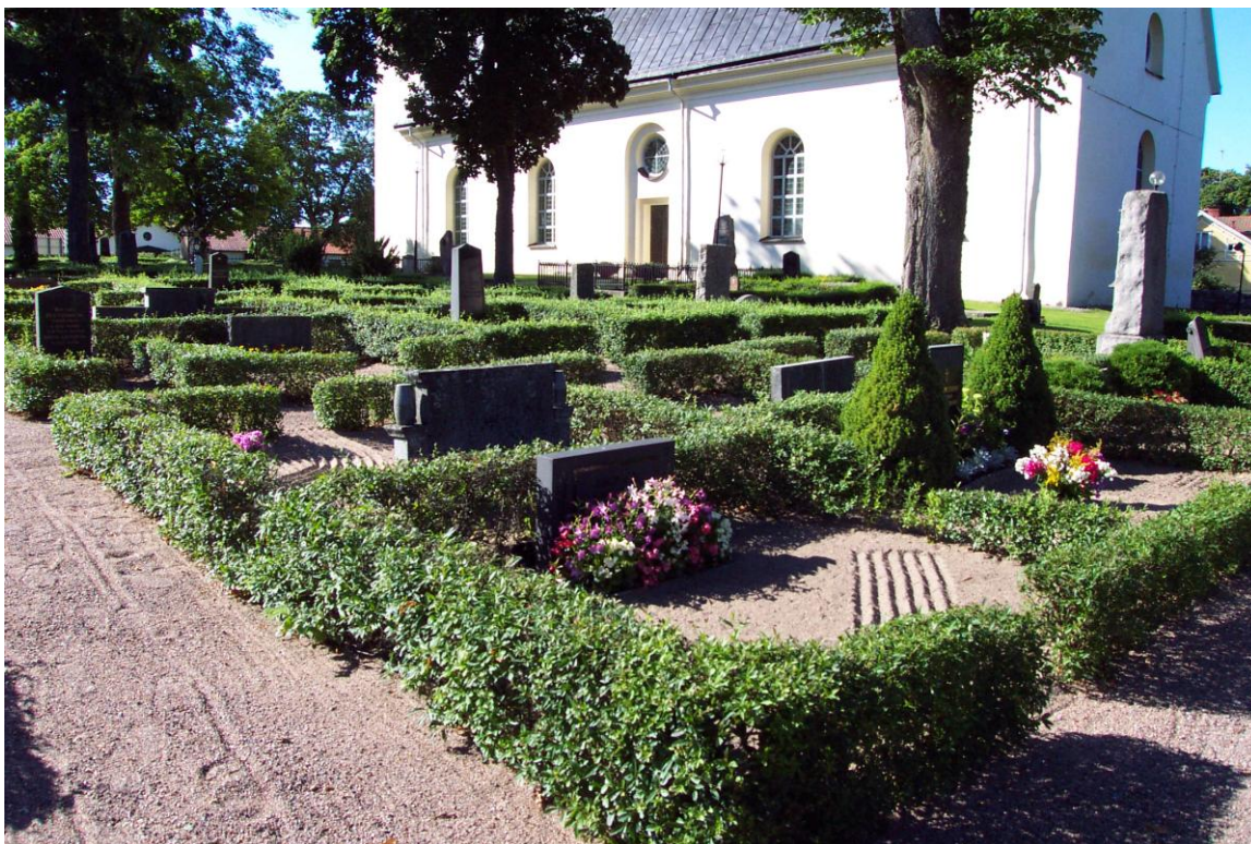
Närmast sydost om kyrkan finns kvarter med bevarade sandgravar, omgärdade av formklippta ligusterhäckar. Gravarna randkrattas och rymmer en rik gravkultur från 1800-talet och första hälften av 1900-talet. augusti 2002