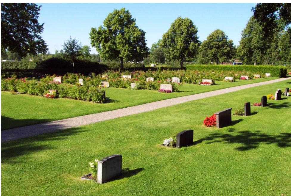
Den Södra kyrkogården som kom till 1941 präglas av tidstypiska låga och breda gravvårdar. Omkring 1980 planterades rygghäckar av vresros. Foto Carina Lindkvist, augusti 2002

Häckar och buskage förekommer över hela kyrkogården. De präglar miljön och förtydligar genom sina olika skepnader de olika delarnas karaktärer. Några bör omnämnas speciellt. De äldsta gravkvarterens bevarade sandgravar omgärdas av ett sammanhängande system kraftiga ligusterhäckar, troligen från förra hälften