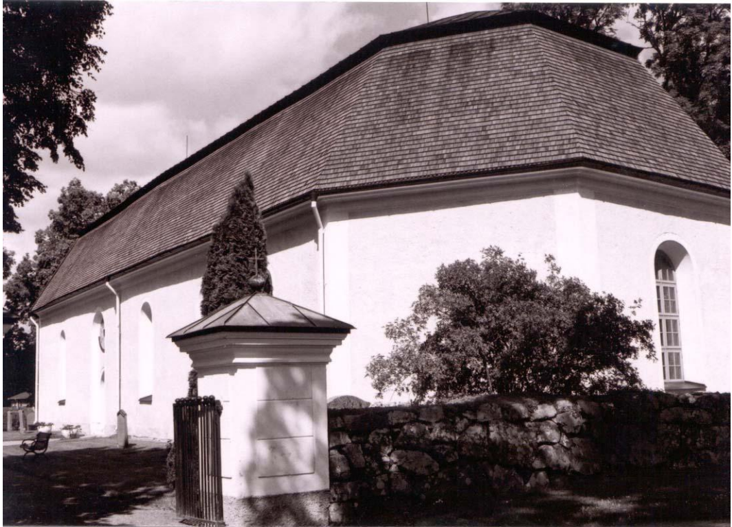
Harbo kyrka, södra långsidan och den tresidiga koravslutningen mot öster. Foto Rolf Hammarskiöld 2002. VLM neg B 103 909: 27

Kyrkobyggnaden uppfördes någon gång under 1400-talets första hälft med naturstensmurar, blindingar och gavelrösten i tegel, samt spånklätt sadeltak. På norra långsidan var sakristia utbyggd och på den södra ett vapenhus. Kyrkorummets valv tillkom samtidigt eller kort tid därefter och bemålades.