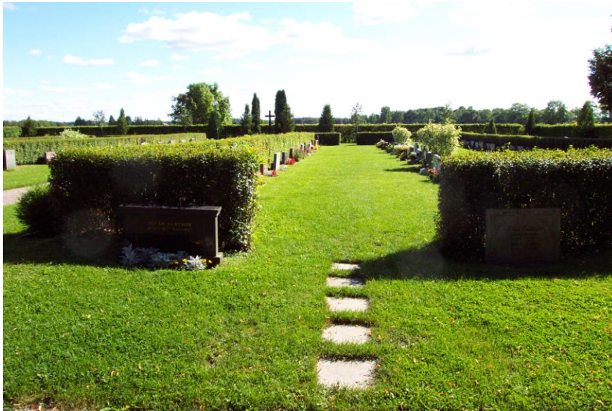
Gravrader och rygghäckar på den yngre kyrkogårdsdelen. Foto Carina Lindkvist 2002.

Delen är öppen till sin karaktär och hör till det vidsträckta landskapet utanför även om den visuella kontakten begränsas av den höga häcken.