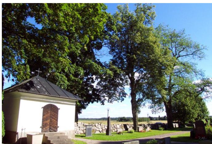
Det före detta gravkoret och trädkransen på den äldre kyrkogårdsdelen. Foto Carina Lindkvist 2002.

Den yngre delen är på flera sätt utformad efter samma principer som den äldre. Det gäller t ex familjegravskransar utmed kyrkogårdens och kvarterens ytterkanter och symmetriskt lagda gångar som avgränsar gravkvarteren. Den yngre delen speglar å andra sidan även sin tids sätt att utforma kyrkogårdar. Grönskan dominerar och ger ett lugnt helhetsintryck. De enskilda gravvårdarna är mindre till storlek och låga och breda till formen. De underordnar sig grönskans former. Marken är genomgående täckt av klippt gräs. Trädkransen var troligen till en början enhetlig till ålder och sort men är nu varierande. Träden är relativt små och bidrar marginellt till rumskänslan. Inne i de båda avlånga kvarteren finns det formklippta meterhöga rygghäckar. Till det karaktäristiska för den här delen hör även det enkla stora träkorset i fonden på mittgången och pelartujorna vid dess sidor och mellan träden i den södra kanten.