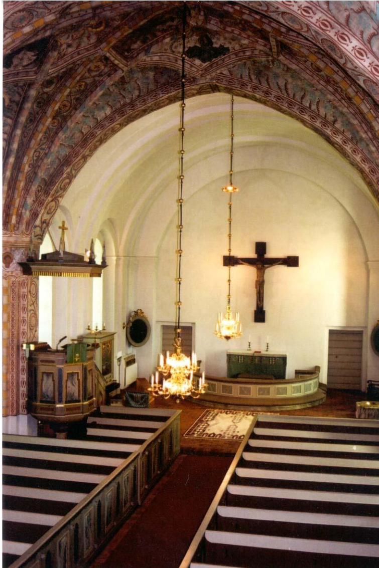
Harbo kyrka, interiör mot öster.

Foto Rolf Hammarskiöld 2002.VLM neg 103 908: 34