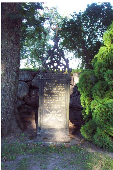
Gjutjärnsgravvård från mitten av 1800-talet i kransen av familjegravar längs muren.

Den äldre delen omgärdas helt av en bred och kraftig kallmur av gråsten medan den nyare delens yttre avgränsning består av en hög formklippt lövhäck. Den äldre delens nuvarande utformning kom till 1904 men har en 1800-talsmässig prägel. De typiska strukturerna i form av stenmuren, trädkransen, korsgångarna som delar upp kyrkogården i kvarter, kransarna av familjegravar utefter muren och de inre kvarteren samt de högresta gravvårdarna bildar en väl bevarad och sammanhållen helhetsmiljö. De största förändringarna är att nästan samtliga gravar lagts om från grus till gräs och att gravplatsbeläggningen ändrats inne i kvarteren. Det f.d. gravkoret från 1810, i kyrkogårdens östra kant stämmer väl in i denna miljö. Som gravkulturen från sekelskiftet bjuder är gravvårdarna och gravanläggningarna varierade till stil, form och inskription. De utgör en väsentlig del av helhetskaraktären. De stora höga ädla lövträden i trädkransen och utmed korsgångarna ger den här delen en lummig och sluten karaktär.