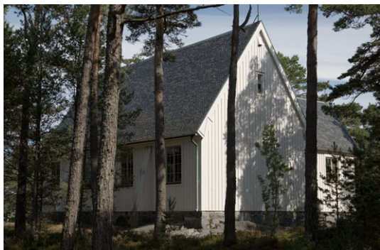
Exteriör från sydöst.

Läktaren i vapenhusets övre våning öppnar sig mot långhuset och bärs upp av två smala kvadratiska pelare. Förmodligen förstorades