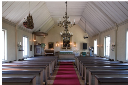
Interiör mot koret i öster.