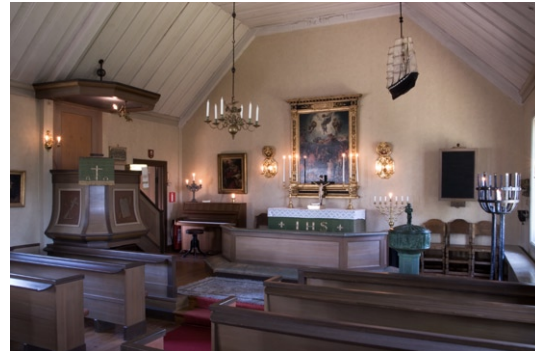
Interiör med altare, predikstol och dopfunt i kor et.

gande utdragbara lådor. Dörren till vänster om alkoven leder till en liten tambur med separat ingång.