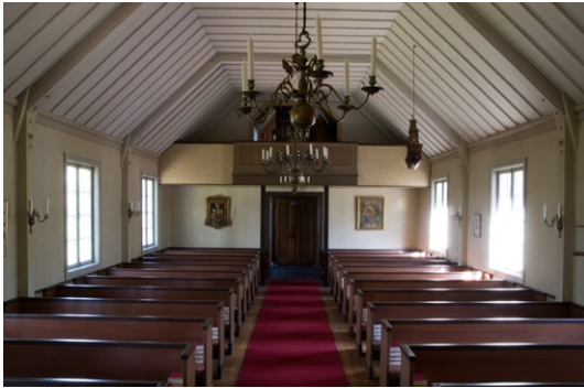
Interiör mot entré och läktare i väster.

läktaren under 1950-talet och läktarbarriären flyttades fram i samband med att orgeln installerades 1951. Läktarbarriären är liksom altare, predikstol och bänkinredning målad i en ljus olivgrå kulör med bruna toner. Bänkinredningen av trä är öppen med 12 bänkrader på vardera sidan mittgången. I kor et dominerar den femsidiga altarringen i brun lasyr med mörkare brunt ramverk. Knäfallet är klätt med grönt skinn. På kor ets norrsida återfinns predikstolen, bemålad med symboler för tron, hoppet och kärleken samt lagens tavlor. I taket hänger en skulpterad, förgylld ängel.