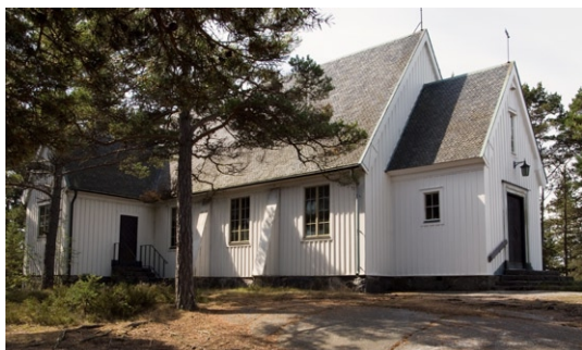
Exteriör från nordväst.

forternas ovansida är belagd med likaledes vitmålat skivmaterial. Det skiffertäckta taket avslutas av vita vindskivor med bredare avslut vilka dekoreras av en list lagd i ett Z. Långhusets gavelspetsar kröns av svarta smideskors och på vapenhuset sitter en vindflöjel. Sakristians gavelspets kröns av en mindre kyrktupp.