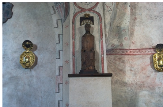
Interiör med medeltida madonnaskulptur.

I kor ets norra del finns en ingång till sakristian . Dess portal är tvåspråkig och rundbågig. Dörren är utförd av kopparplåtar på järnram.