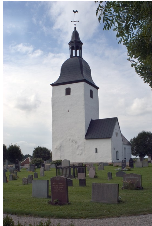
Exteriör från nordost med östtorn och sakristia .

Vapenhusets murar är uppförda som skal-murar av tegel med en kärna av gråsten. Södra gaveln är helt murad av tegel. På gavelväggen