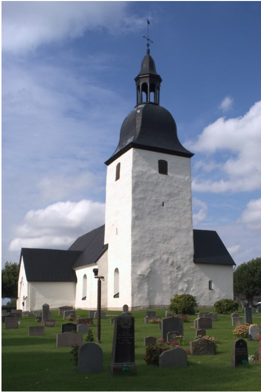
Exteriör från sydost.

På kor ets södra sida finns ett fönster, som sannolikt togs upp i samband med valvslagningen under 1400-talet. Även detta fönsters storlek har dock förändrats.