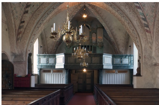
Interiör mot väster.

monument över segern i slaget vid Narva . Predikstolens nuvarande färger härstammar från en renovering 1885. På predikstolen står ett timglas, som skänktes till kyrkan 1742. Det består av fyra glas i en plåtbehållare, fäst i en obeliskformad ståndare av trä.