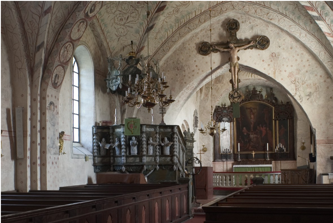
Interiör mot koret i öster.

kans västra del täckts med gipsat trätak, tillkommet under 1700-talets början. Trätaket i sin tur ersatte ett äldre, troligen stjärnvalv , som rasat samman. Det nya valvet dekorerades med målningar av konservator Anton Hällström. Målningarnas färger harmonierar med de medeltida, men har andra motiv.