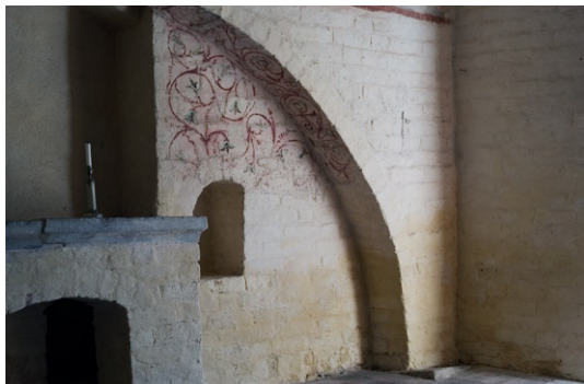
Interiör av vapenhuset .

Mot vapenhusets östra vägg finns ett altare. Det är byggt av tegel och har två relikgömmor. Som altarskiva fungerar locket av en romansk gravkista av kalksten. Till höger om altaret finns