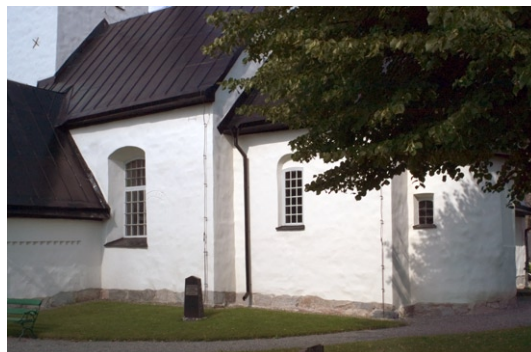
Exteriör med långhus , kor och absid i öster.

Den ursprungliga kyrkan hade små, högt sittande fönster. Idag genombryts långhuset av två högsträckta fönster, som senast fick sin form i samband med en reparation 1830. Det norra fönstret togs ursprungligen upp vid 1700-talets