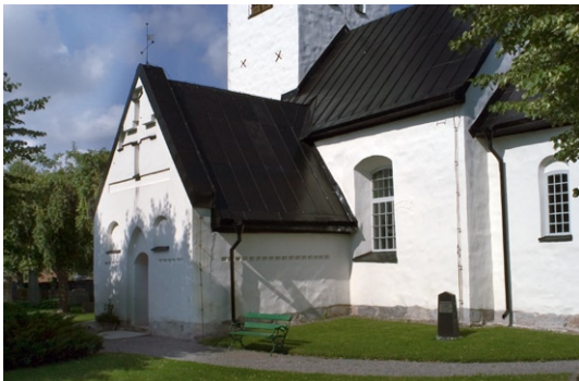
Exteriör med vapenhus och långhus från sydost.

Vapenhusets södra fasad är rikt dekorerad med en korsblinding i gavelröset . På vardera sidan om ingången finns två rundbågiga nischer