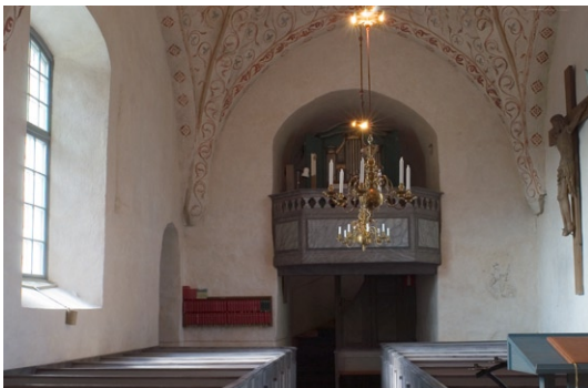
Interiör mot väster.

I väster, mellan långhus och tornrum, finns läktaren, för första gången omtalad 1697. Nuvarande läktares äldsta delar härrör från 1754. Sedan dess har läktaren gjorts om ett flertal gånger, senast 1921–22, då den förminskades. Läktarbarriären är enkelt utförd med blåmarmorade fyllningar och profilsågade bräder i övre delen. 1754 brädslogs läktaren undertill. Möjligen var det i samband med detta som läktarens undersida försågs med en målning på duk. Målningen föreställer en kvinnlig genie med hund och är troligen en profan målning från en herrgård i närheten. På undertaketets östra del finns dekorativa blomstermålningar, troligen från 1600-talet.