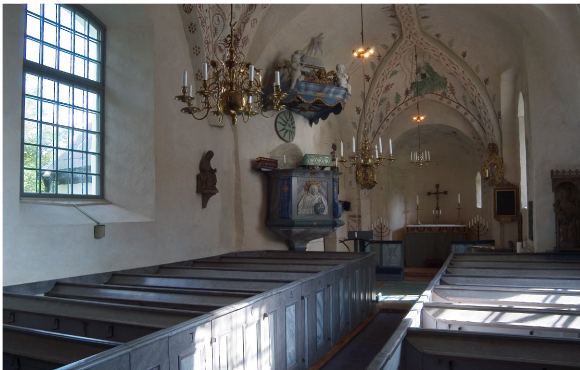
Interiör mot öster.

förenas med den utvidgade triumfbågen . Under den sistnämnda renoveringen, öppnades även bågen mellan långhuset och tornrummet upp.