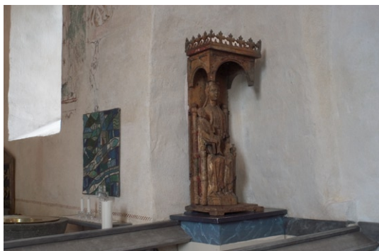
Del av medeltida Mariaskåp vid långhusets södra sida.