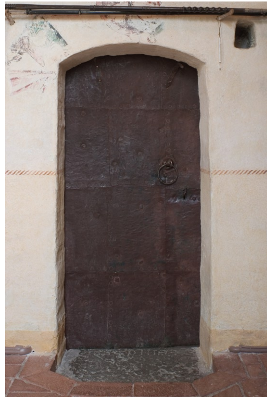
Järnskodd dörr till sakristian.

Orgeln inköptes till Hilleshög 1773, men har förmodligen tidigare använts i något privathem, kanske i ett adels hus i Stockholm eller på någon herrgård i trakten, kanske i ett privatkapell. Orgeln är inbyggd i ett vackert rokokoskåp med ornament av papier maché. De ursprungliga skåpdörrarna förvaras på läktaren men har ersatts av nytillverkade. Orgeln, som förmodligen är Sveriges minsta, renoverades senast av Grönlunds Orgelbyggeri, Gammelstad, 1961 och har idag 4 stämmor.