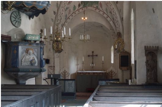
Interiör mot kor och absid.

I väster, mellan långhus och tornrum, finns läktaren, för första gången omtalad 1697. Nuvarande läktares äldsta delar härrör från 1754. Sedan dess har läktaren gjorts om ett flertal gånger, senast 1921–22, då den förminskades. Läktarbarriären är enkelt utförd med blåmarmorade fyllningar och profilsågade bräder i övre delen. 1754 brädslogs läktaren undertill. Möjligen var det i samband med detta som läktarens undersida försågs med en målning på duk. Målningen föreställer en kvinnlig genie med hund och är troligen en profan målning från en herrgård i närheten. På undertaketets östra del finns dekorativa blomstermålningar, troligen från 1600-talet.