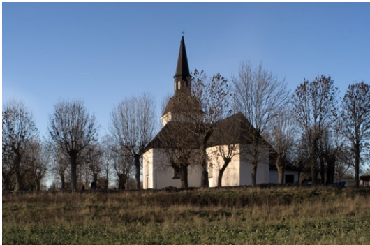
Exteriör från sydost.

plåt. Ett flertal är från sekelskiftet 1700 och har smideskarmar med rosor i skärningspunkterna. Såväl fönster- som dörrsnickerier är målade i