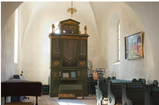
Gamla orgeln i södra korsarmen.

Kyrkans enda återstående föremål från medeltiden utgörs av ett skadat triumfkrucifix av ek från 1400-talets andra hälft, upphängt i sakristian . Flera av kyrkans inventarier är från mo-