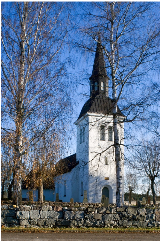
Exteriör från nordväst.

plåt. Ett flertal är från sekelskiftet 1700 och har smideskarmar med rosor i skärningspunkterna. Såväl fönster- som dörrsnickerier är målade i