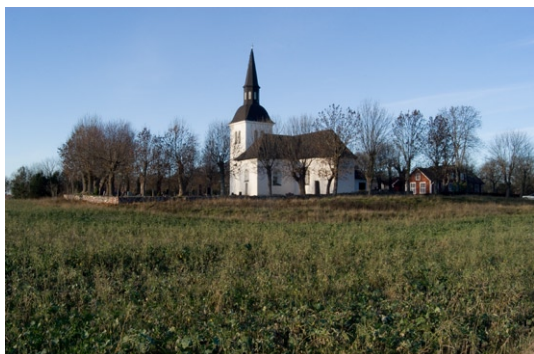
Skå kyrka från sydöst.

muren har vitputsade tegelstolpar med tak av järnplåt, krönta av järnkors på kulor från 1956, efter ritningar av arkitekt B Schill.