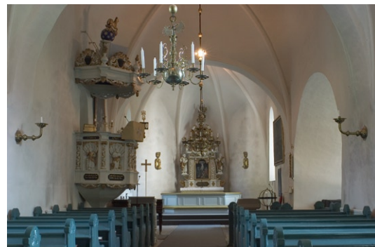
Kyrkorummet åt öst.

Kyrkans nuvarande planform kom till efter branden 1695. Långhus, kor och tvärrarm är kryssvälvda av tegel med ribbor. Valven är slagna efter branden 1695, med undantag för långhusets mellersta travée vars valv klarade branden. Väggar och valv är vitkalkade. Långhuset, tvärrarmen och sakristian täcks av brädgolv som