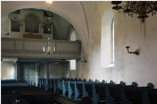
Kyrkorummet åt väst.

av Walter Thür Orgelbyggen och omfattar 14 stämmor. Kyrkan har ytterligare en orgel uppställd i tvärarmen. Den är från 1700-talets slut och byggdes ursprungligen för Lovö kyrka. 1885 skänktes den till Sänga kyrka och 1967 flyttades den till Skå. Orgeln är byggd av Per Niclas Forsberg, Drottningholm, har sju stämmor och är målad i grönt med förgyllning.