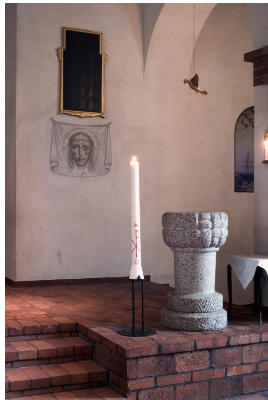
Dopfunten med fresken Veronikas svetteduk av Olle Hjortzberg på väggen bakom. © OLLE HJORTZBERG/BUS 2008