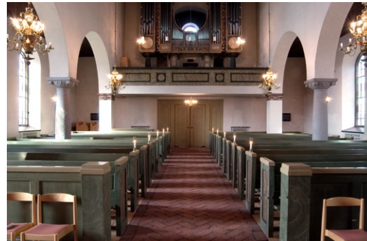
Kyrkorummet från öster.

Sakristian , belägen under koret , är smyckad med en dekorationsmålade list som löper runt