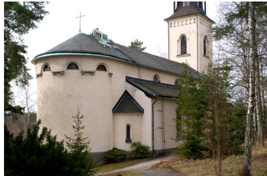
Kyrkan med dess runda kor från nordöst.

Kyrkans långskepp har sadeltak och dess sidoskepp valmade takfall. Det rundade koret har ett rundat takfall vilket liksom övriga takfall är