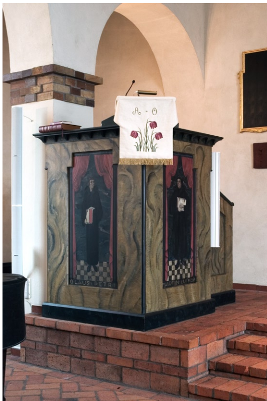
Predikstolen med målningar av Olle Hjortzberg. © OLLE HJORTZBERG/BUS 2008

taket. Till källaren kommer man antingen från norr via en trappa som följer den runda absidens form, eller från källarvåningens dörröpp-