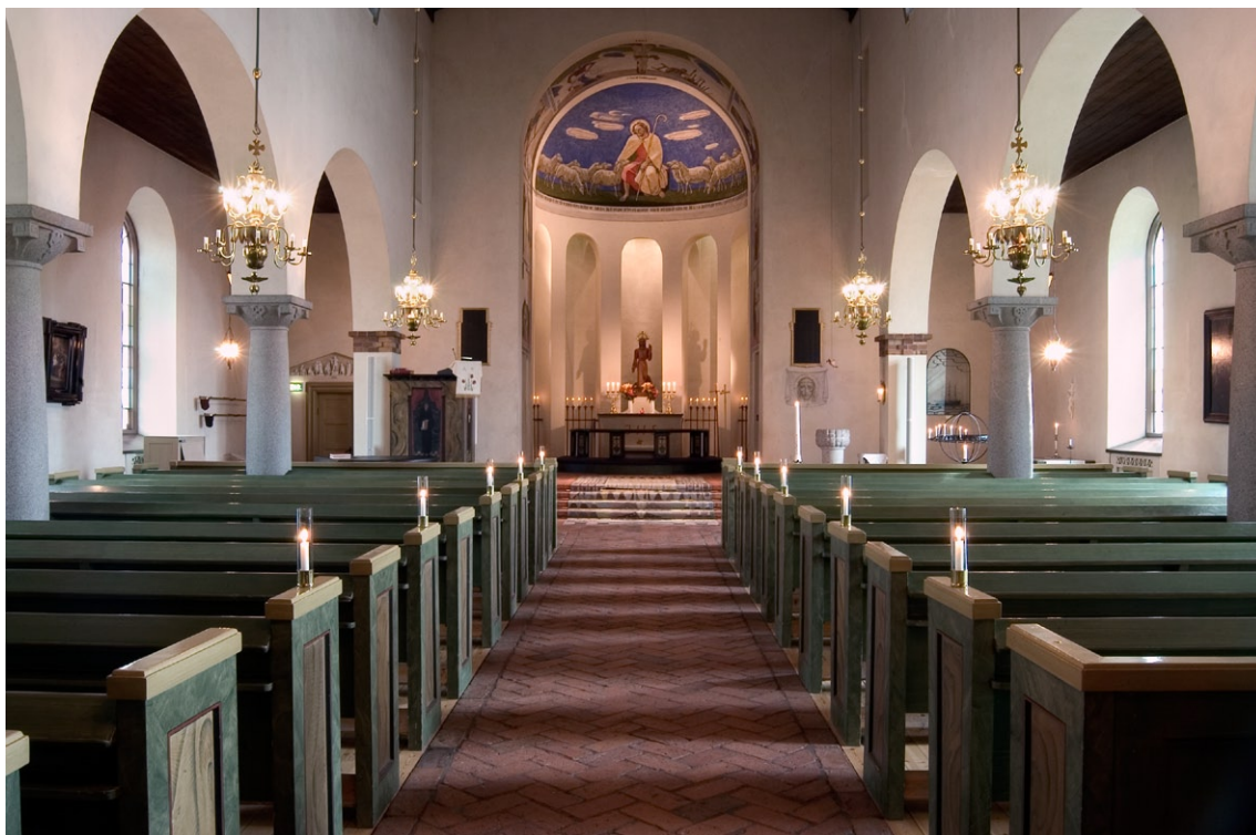
Kyrkorummet från väster.

brunlaserade med diskreta dekorationer såsom ramverk och växtornamentik. Sidoskeppens tak är brunlaserade, plana bräddtak. Taken i övriga utrymmen är vitputsade.