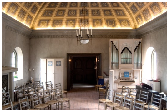
Kyrkorummet från väster.