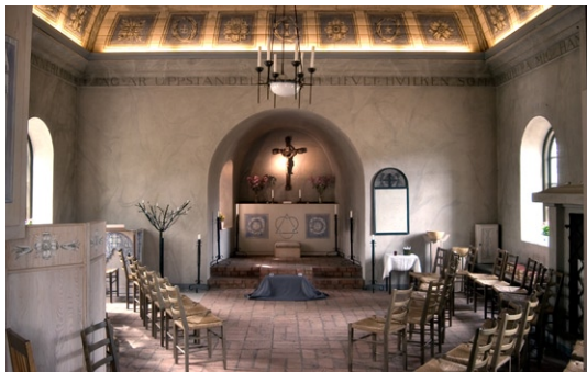
Kyrkorummet från öster.

Kapellets golv är mönsterlagt i rött tegel, förutom golvet i vapenhuset som är belagt med huggna kalkstensplattor. Väggarna är putsade och försedda med en diskret marmorering i ljus gråa toner på vit botten. Under en profilerad list som avslutar väggarna löper, som en bård runt rummet, texten i Johannes 11:25–26, ”Jag är uppståndelsen och lifvet, hvilken som tror på mig, han skall lefva, om han än död blefve. Och var och en som lever och tror på mig, han skall icke dö evinnerliga”. Ovanpå den profilerade listen ligger en ljusramp. Väggarnas marmorering tillkom vid 1991 års renovering men textbården är ursprunglig. Från vapenhuset sitter ett dörrpar med två fyllningar i vatdera dörrblad. De övre fyllningarna har renässansformat