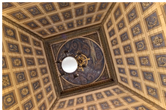
Kapellets innertak med målningar av Filip Månsson.

ramverk. Dörrarna är liksom entrédörrarnas insidor ådringsmålade. De kopplade fönsterbågarna är invändigt brunmålade och försedda med handblåst glas.