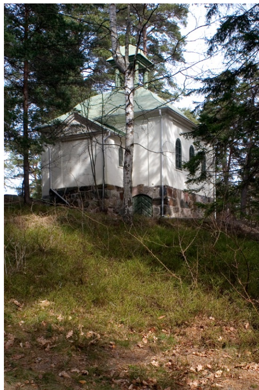
Kapellet från sydväst.

Kapellets tak är som en kupol med svängda takfall och en öppen lanternin som kröns av ett kors med klot ytterst på korsarmarna. På det