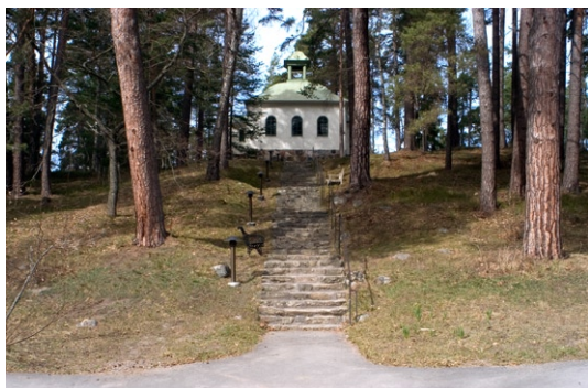
Kapellet från söder.

klipporna. På kyrkogårdens östra del finns en minneslund som tillkom 1972. Runt kyrkogården leder en granitmur. Ingången till kyrkogården är belägen i söder, där svartmålade smidesgrindar sitter fästade i kyrkogårdsmuren