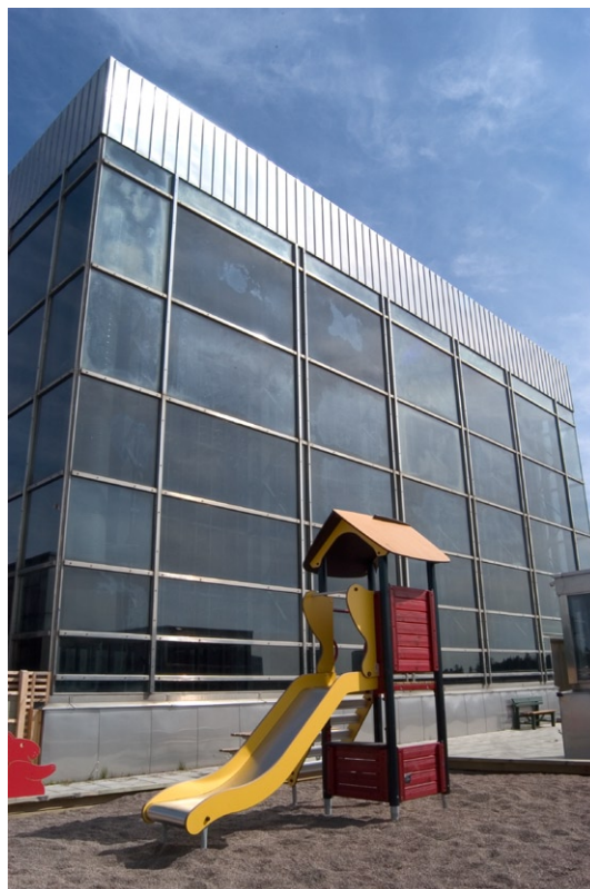
Exteriör mot sydväst.

Fastigheten Lammet 2 är en rektangulär tomt som upptas av Tibble kyrka med tillhörande församlingsbyggnad. Fastighetens omfattning sammanfaller med församlingsbyggnaden vars