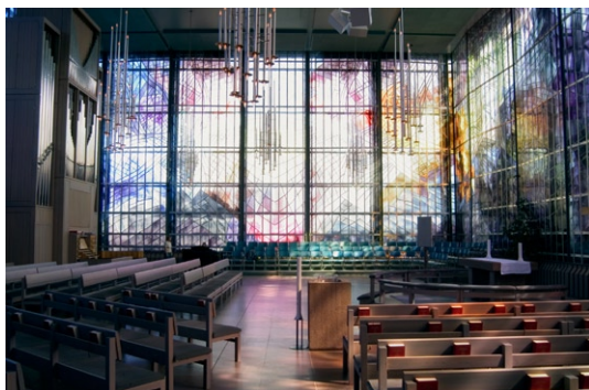
Interiör mot nordost.