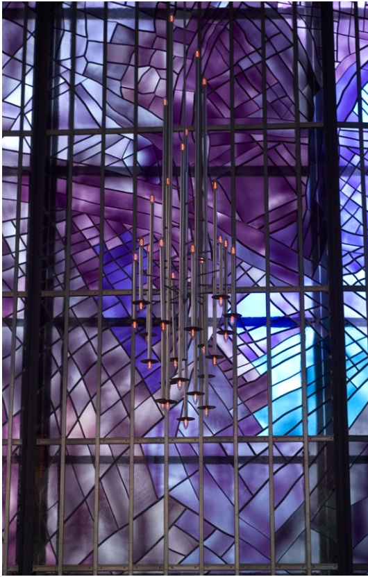
Detalj av väggarnas glasmosaik.

Utmed ena väggen är gradängar av mera tillfällig karaktär uppställda för kören.