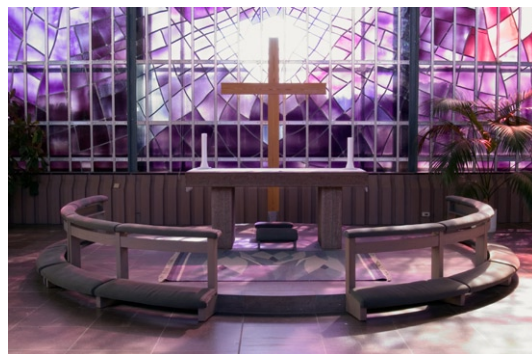
Interiör mot koret i sydost.

Glasmosaikerna är rummets enda utsmyckning. Den bildar fond till det tre meter höga