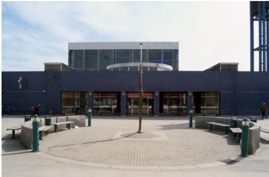
Exteriör mot nordväst.

plan höjer sig dels kyrkan i form av en glaskub, dels klocktornet i form av en kampanil . Även trapphusets cylinderformade lanternin sticker upp över terrassen. Kyrkan är orienterad i syd-ost-nordväst med koret i sydost.