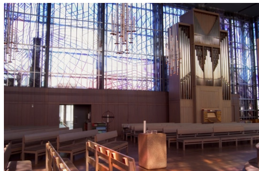
Interiör mot sydost.

Vid bakre väggen står orgeln, byggd i Danmark 1977 av Fredriksborgs Orgelbyggeri i Hillerød. Den var ursprungligen ritad i ett mindre format, men själva orgeln visade sig emellertid inte rymmas i den föreslagna skalan. Därför förstörades hela orgeln med ungefär tre meter på höjden och går nu från golv till tak. Orgelfasaden är ritad av Göran Kjessler.