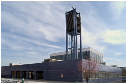
Exteriör mot väster.

Församlingsbyggnaden i två våningar har fasader klädda med blåglaserad klinker. Den bildar med sitt platta tak en terrass för kyrka och klockstapel. Kyrkans väggar är helt i glas, med en yttre glasvägg monterad i stål utanför den egentliga glasmosaik. Klocktornet är byggt i blålackerat stål och rostfritt.