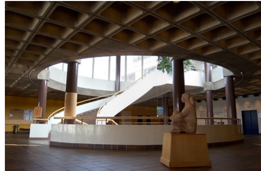
Interiör av entréplan med ljusgård.