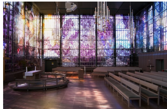
Interiör mot sydväst.

Kyrkans huvudentré i nordväst leder in till en rymlig foajé med golv av kalkstensplattor och kassettak av betong. En monumental trappa i kalksten och kraftiga, målade pelare binder samman byggnadens olika plan. Runt trappan grupperar sig lokaler för församlingens olika verksamheter. Trappan avslutas med en rund lanternin som släpper in ett flödande dagsljus i byggnadens inre. Högst upp ligger en förhall med takljus och en tung, slät, målad kyrkport av stål. Bakom kyrkportens tunga, släta stäldörrar öppnar sig ett högt, rektangulärt kyrkorum med väggar av glasmosaik. Glas i olika former och färger, sammanfogade med blyspröjs, är monterade i rektangu-