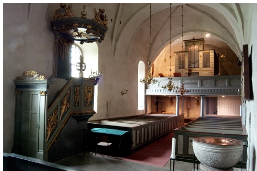
Interiör mot orgelläktaren i väster.

Under 1770-talet uppfördes orgelläktaren,