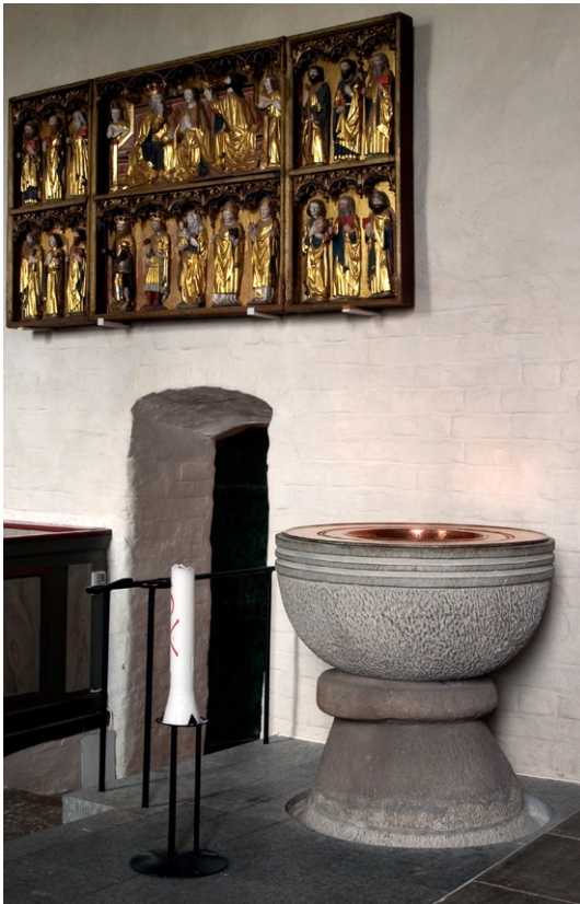
Dopfund och altarskåp.

rik dekor. Predikstolen har ännu dörren bevarad. Dörren flankeras av två pilastrar och omramas upptill av ett överstycke. Liksom altaruppsatsen donerades predikstolen av Charles de Geer. Hans insats symboliseras genom det de Geerska vapnet under bokpulpeten och på ljudtakets norra sida.