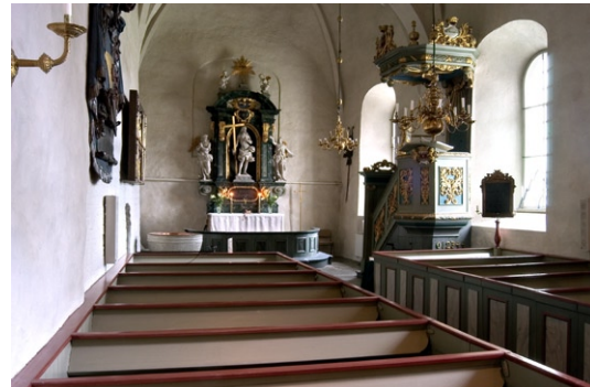
Interiör mot koret i öster.

Vapenhusets tegelvalv är sexdelat med helstensribbor. Ingången vidgades 1870–71 samt 1936.