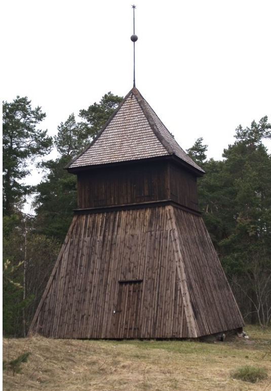
Klockstapeln väster om kyrkan.

Kyrkogården har utvidgats i flera etapper mot söder och öster. Den gamla bogårdsmuren finns dock bevarad åt norr och väster. Den äldsta kyrkogårdens södra gräns gick tidigare längs