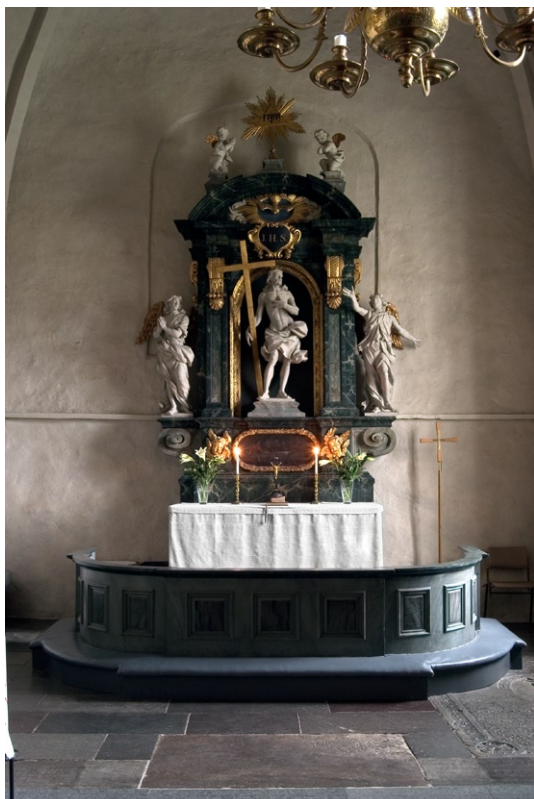
Altaruppsats, altare och altarring.