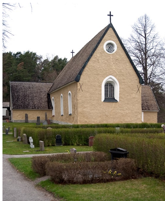
Exteriör med östgavelns korfönster och vapenhus i söder.

På en höjd väster om kyrkan står klockstapeln, uppförd i början av 1600-talet. Den är brädklädd och täcks av ett spåntak, krönt av en flöjel. Ursprungligen hade stapeln en klockbockskonstruktion, varav endast hjärtstocken