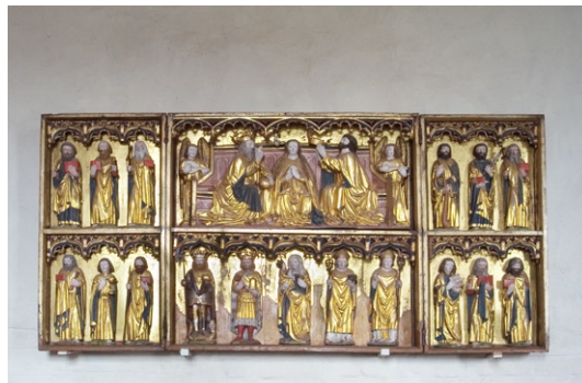
Altarskåp i ek från 1460-talet.