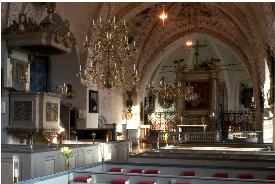
Interiör mot öster.

Från vapenhuset kommer man in i kyrkorummet. Långhusets fyra kryssvalv har valvpilastrar i förband med murarna, vilket tyder på att valven redan var planerade när murarna uppfördes på 1430-talet. Långhusets valvmålningar från 1449 är utförda av Johannes Iwan, liksom korvalvets dekor med bl a donatorsvapen. De karaktäriseras av ett måleri som breder ut sig över ytan (horror vacui). Långhusets valvmålningar har varit överkalkade, men togs åter fram 1924 och korvalvet befriades samtidigt från påmålningar.