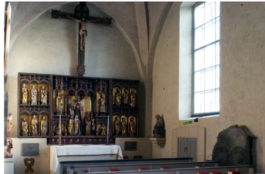
Altarskåp från 1488 av Johannes Snickare med motiv från korsnedtagningen.

lan finns en framställning av Kristus och de vita och fåvitska jungfrurna. Skåpet är daterat till 1480-talet och tillskrivet Johannes Snickare. Det har efter tillbyggnaden av koret på 1690-talet fram till restaureringen 1924 haft sin plats i Braheket bakom högaltaret. Vid sidan av altarskåpet hänger en inskriptionstavla uppsatt av Nils Brahe. Triumfkrucifixet ovanför altarskåpet är även det troligen utfört av Johannes Snickare och tillkommet vid samma tid som altarskåpet.