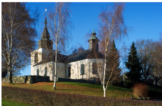
Exteriör från sydost.