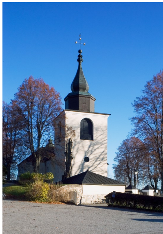
Exteriör från väster.

Huvudentrén är sedan 1690-talet placerad i tornet. Västportalen har en fyra trappsteg hög, tresidig sandstenstrappa med ledstång utmed muren i norr. Likaså har södra entrén en hög stentrappa medan norra korsarmens entré är