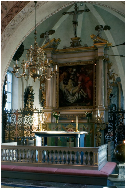
Interiör mot koret i öster.

ställning av apostlarna och på utsidan målningar. Ursprungligt måleri och förgyllning på skåpets insidor är i stor utsträckning bevarat. På predel-