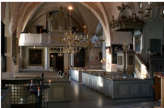
Interiör mot väster.

ställning av apostlarna och på utsidan målningar. Ursprungligt måleri och förgyllning på skåpets insidor är i stor utsträckning bevarat. På predel-