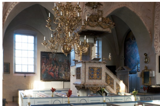
Predikstol från 1696 av Andreas Heysig, placerad på norra pelaren.

I samband med tillbyggnaden under 1690-talet fick kyrkan delvis ny inredning. Predikstolen är signerad ”fecit Andreas Heysig Å: 1696”, en bildhuggare verksam mot slutet av 1600-ta-